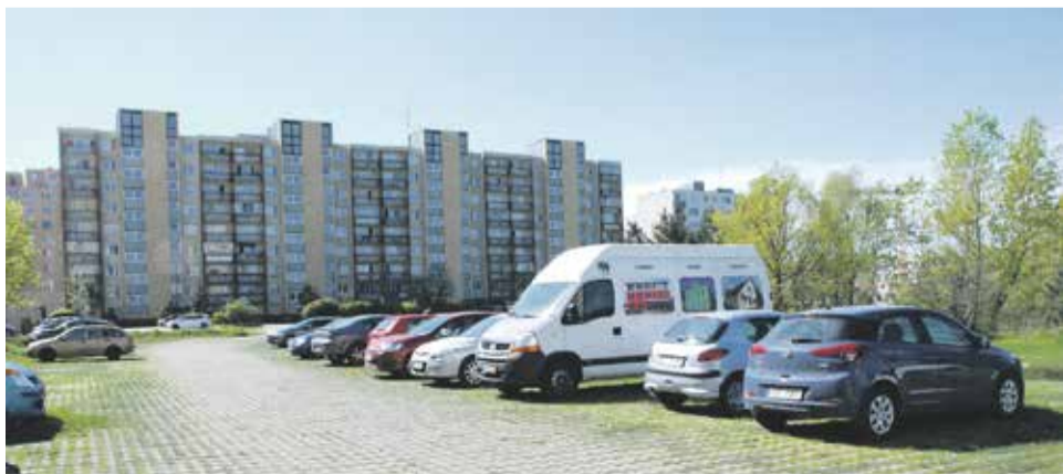
Pri križi - plánovaná výstavba nájomných bytov