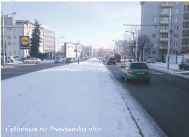
Cyklotrasa na Trenčianskej ulici