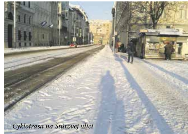
Cyklotrasa na Štúrovej ulici