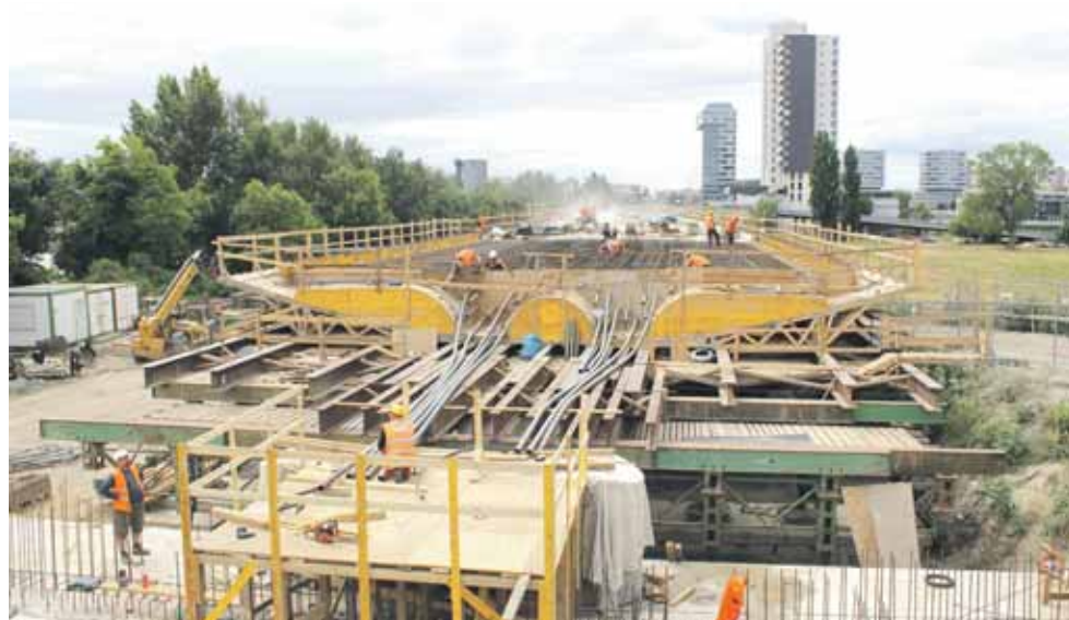
Práce na výstavbe trate v roku 2015.