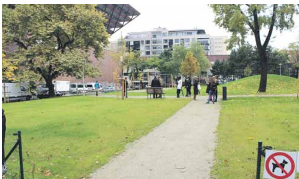
Otvorenia v roku 2016 sa dočkal aj Parčík na Belopotockého ulici.