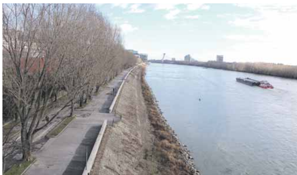
Dunajské nábrežie pred rekonštrukciou.