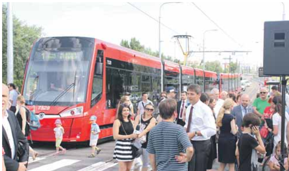
Významnou udalosťou roku 2016 bolo otvorenie el. trate do Petržalky.