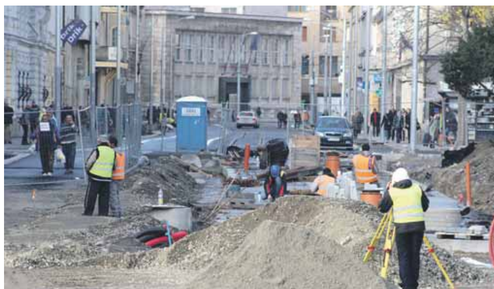
Štúrova ulica počas prác.