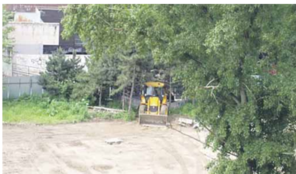
Parčík v roku 2013.