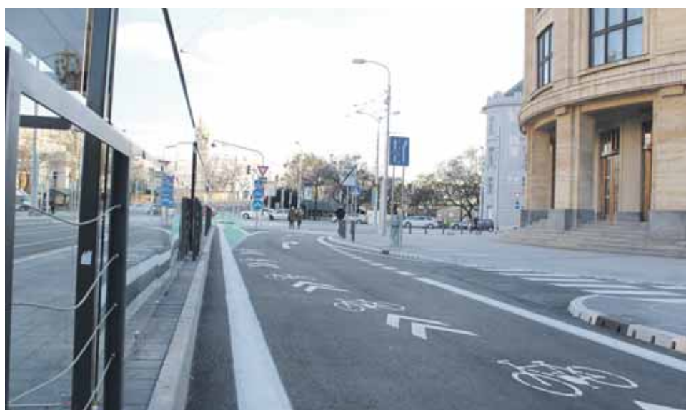
Štúrova ulica po odovzdaní v roku 2016.