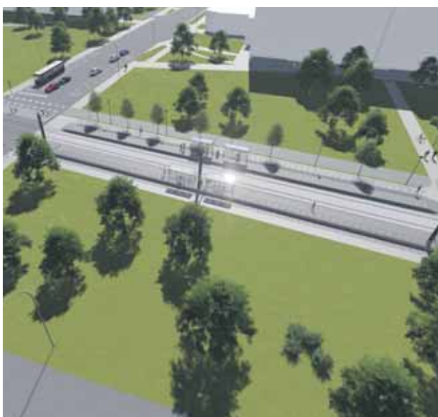
Zastávka Zrkadlový háj.