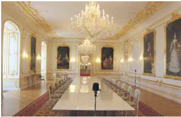
Reprezentačná rokovacia sála (Jedna zo štyroch reprezentačných siení)

Š. Holčík: Je to práve to, čo návštevník nemôže vidieť. Sú to miestnosti na prvom poschodí paláca, ktoré budú prístupné asi len raz do roka. Sú tu ale aj krásne exponáty v rámci SNM a sprístupnené budú aj zachované nálezy z obdobia začiatku nášho letopočtu, teda storočie pred Kristom a storočie po Kristu. Rád by som upozornil aj na možnosť rekonštrukcie ďalšej barokovej záhrady, ktorá bola na východnej terase kde je dnes divý les a gýčová socha sv. Alžbety, ktorá do tohto areálu nepatrí. A v budúcnosti by bolo možno vhodné posta-