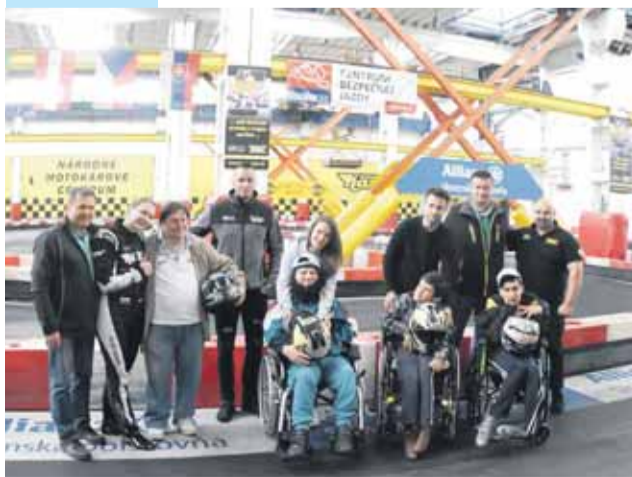
Video z jazdy hendikepovaných na našom facebooku