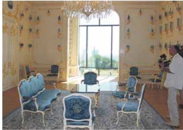
Porcelánový salón, jeho súčasťou je aj renesančný arkier

sa rozhodlo, že budovy okolo paláca zbúrajú. Išlo zrejme o kšeft, pretože objekty boli postavené z výborných tehál a tie sa dali predať, no samotný palác je postavený najmä z lomového kameňa, čo sa dalo speňažiť ťažšie. Zlikvidovaný bol Nový palác – nesprávne nazývaný Tereziánium, ďalej záhradná sála, budovy na západnej terase a pod. V roku 1942 bolo na základe súťaže rozhodnuté, že aj hradný palác je možné zbúrať, okrem korunnej veže, a postaviť tam niečo iné. Paradoxne, vďaka druhej svetovej vojne k jeho zbúraniu nedošlo, pretože vojna potrebovala peniaze, a tak originálna stavba zo-