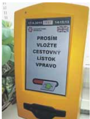
pravej časti štrbiny označovača.

Do doby zavedenia širších cestovných lístkov, ktorá je plánovaná v súvislosti so spustením III. etapy IDS BK v novembri 2015, cestujúci dočasne označujú úzke cestovné lístky v širšom označovači vložením cestovného lístka do