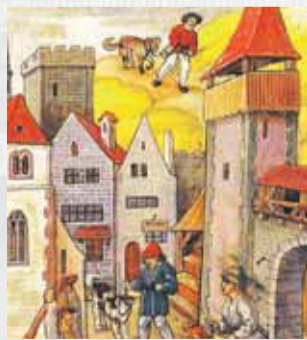
Túlaví psi boli problémom mnohých stredovekých miest, na čo poukazuje aj ilustrácia v zúrišskom kódexe z 15. storočia.

Neodmysliteľnou súčasťou života v stredovekom Prešporku boli desiatky, ba až stovky túlavých psov. Pre obyvateľov a najmä funkcionárov mesta predstavovali zaiste neprijemný problém, aj keď sa to priamo nikde nespomína. Stručné údaje v komorných (účtovných) knihách, ktoré sú uložené v Archíve mesta Bratislavy, hovoria však jasnou rečou. Pod stárou položkou Výdavky na kata figuruje neraz závažné údaje o počte zabíjaných psov. Vo fiškálnom roku 1509/1510 kat a jeho pomocníci utratili 98 psov,