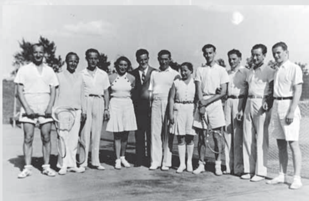
Tenisti I. ČsŠK Bratislava v 2. polovici 30. rokov 20. storočia.

Riadiaci župný orgán sa hneď od začiatku podieľal na