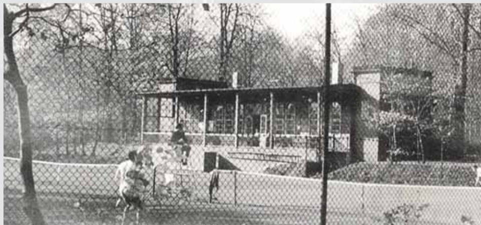
Tenisové kurty I. ČsŠK Bratislava boli v Petržalke neďaleko futbalového štadióna.

Koncom novembra 1927 „eškári“ hrdo hlásili, že rady ich tenistov sa rozšírili už na deväťdesiat členov a v nasledujúcom roku postavila tri