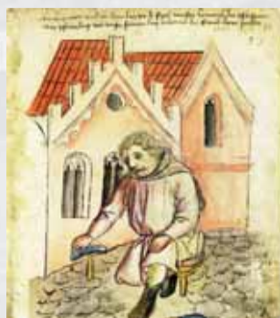
Mestský dláždič na miniatúre v norimberskom rukopise (1456).

Ulice v starom Prešporoku dlho neboli dláždené. Ku koncu 15. storočia boli dláždicami pokryté iba Hlavné námestie a Dlhá (dnes Laurinská a Panská) ulica. Na ostatných frekventovanejších uliciach či uličkách boli v lepšom prípade poukladané v nesúvislom slede veľké kamene, po ktorých Prešporčania a návštevníci mesta kráčali alebo preskakovali z jedného na druhý, aby sa najmä