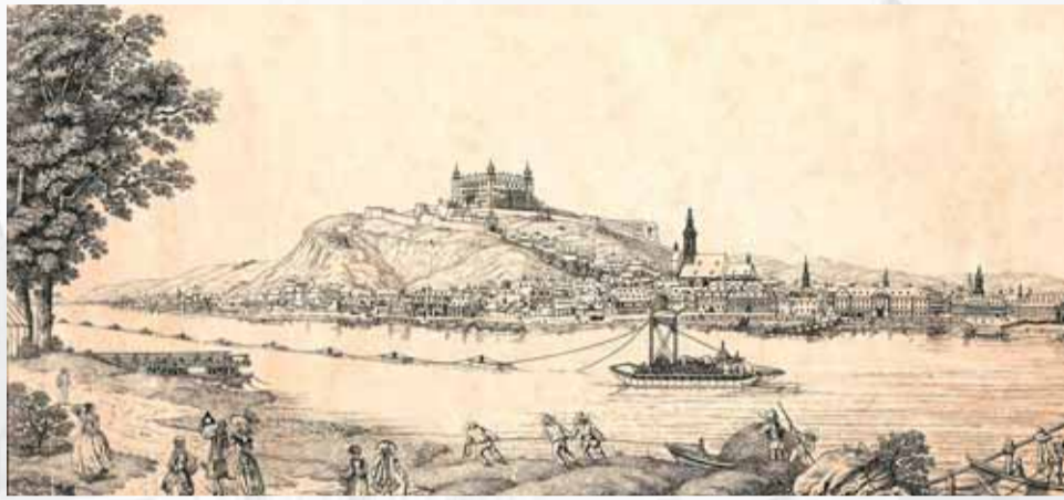
Slobodné kráľovské mesto Prešporok na vedute z roku 1787. (Zo zbierok GMB.)

Hneď v popredí veduty, na petržalskom nábreží vo vtedajšej časti Mostnej nivy (Bruck-Au) vidno pestrú škálu postáv. Ich oblečenie