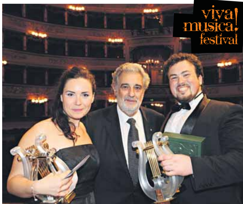
Sonya Yoncheva, Plácido Domingo, Stefan Pop.

Svetová husľová špička a držiteľ Guinnessovho rekordu, ako najpredávanejší klasický umelec