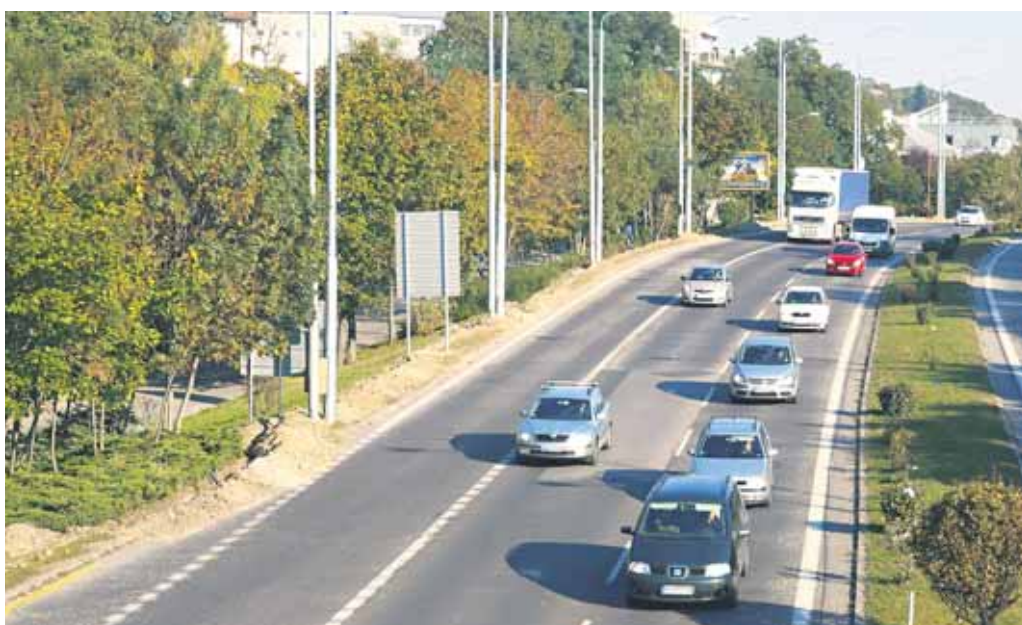
Bratislavská samospráva spustila projekt rozšírenia existujúcej trolejbusovej siete v širšom okolí Horského parku. Súčasťou projektu je aj výmena pouličného osvetlenia.