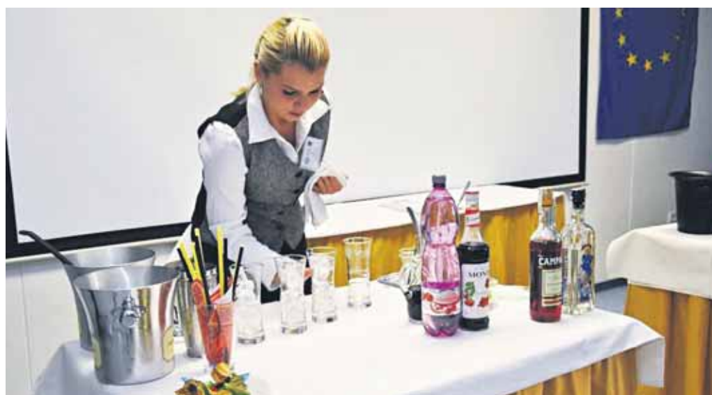
Študenti z 23 stredných škôl zo Slovenska, Česka, Poľska, Chorvátska a Ruska súťažili minulý týždeň na pôde Strednej odbornej školy Na pántoch. Porotu sa okrem iných snažili zaujať aj budúci kuchári, čašníci, barmani, cukrári a predavači.