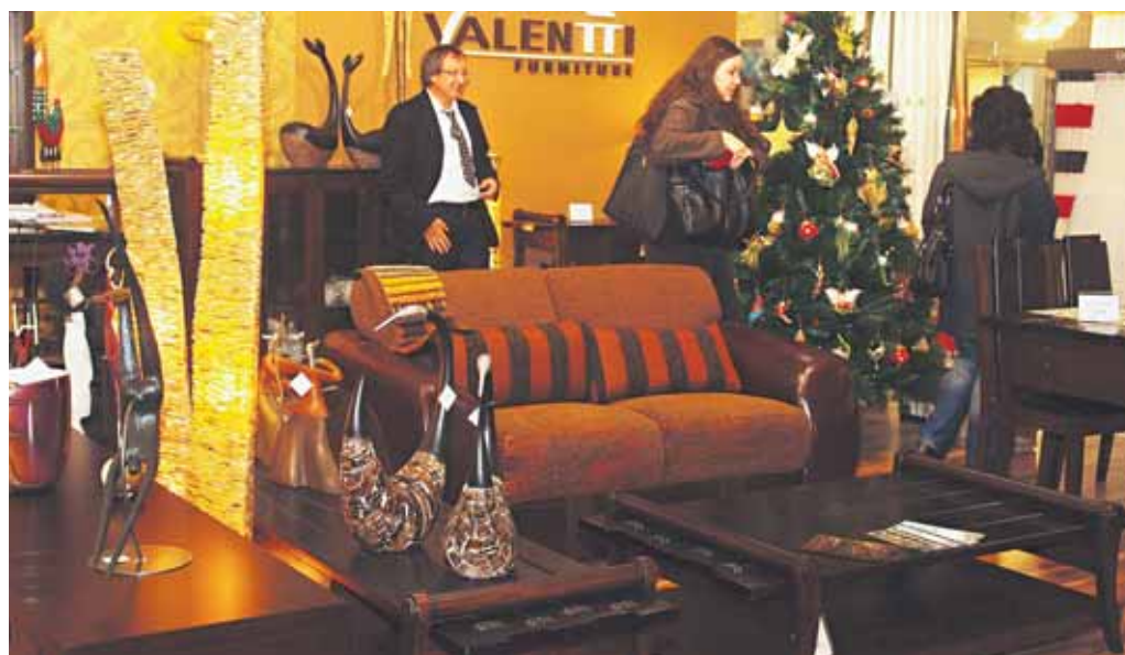
Medzinárodný veľtrh nábytku Moddom uspokojil exkluzívnymi kúskami aj náročných zákazníkov.