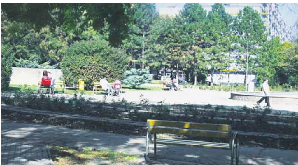
Na internet sa presunula diskusia o novej podobe parku na Račianskom mýte, Nové Mesto spustilo webovú stránku, venovanú jeho revitalizácii – racko.zanovomesto.sk. Vizualy vystavujú aj v priestoroch miestneho úradu na Junáckej 1.