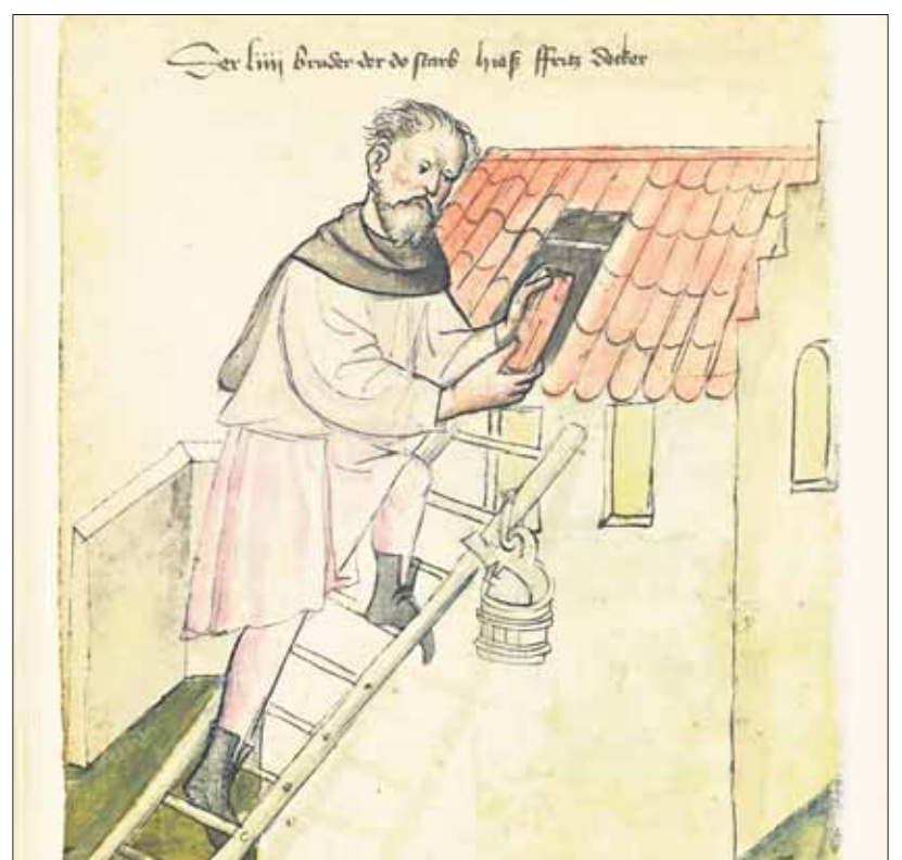
Stredoveký pokrývač v norimberskom ilustrovanom kódexe

Na slávnostných zasadnutiach cechu, ktoré sa uskutočňovali po spoločnej účasti na bohoslužbách jednak pri príležitosti výročia cechu a jednak štvrtročne, vložil každý majster do cechovej pokladnice 30 grajciarov a každý tovariš 11