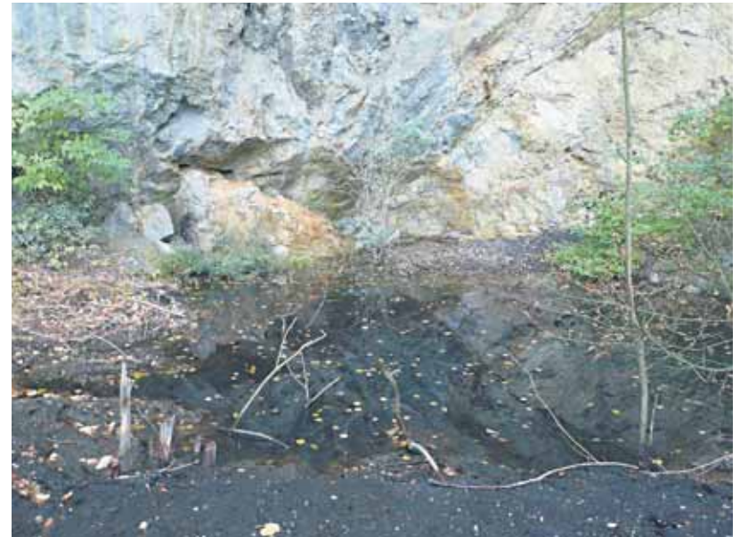
V kameňolome Srdce v Devínskej Novej Vsi sa nachádza už roky nebezpečná skládka.