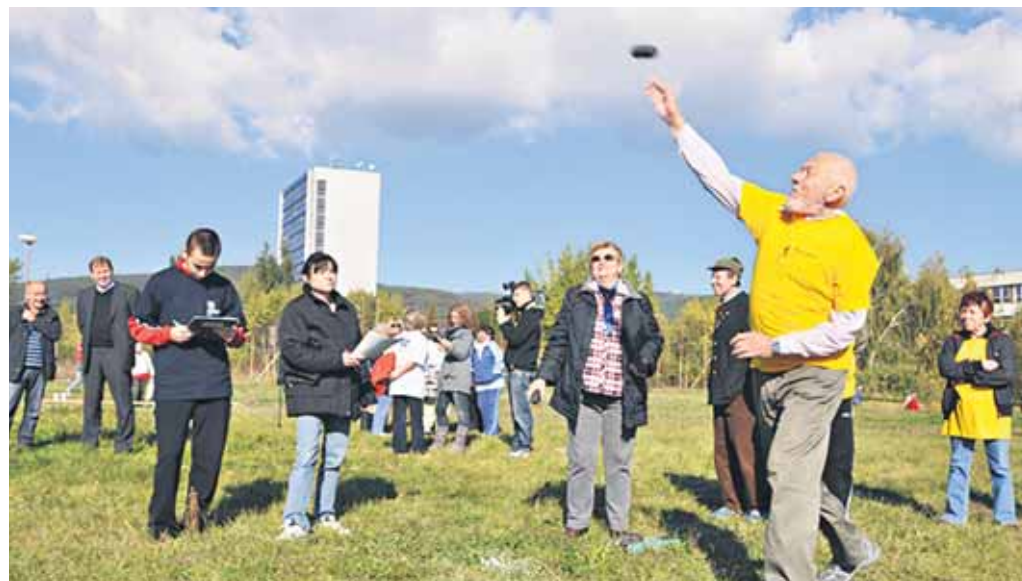
Bratislavská župa pripravila prvý ročník športového podujatia pre seniorov so zariadení v pôsobnosti kraja aj hlavného mesta. Najlepšie sa darilo seniorom z KD Modra, ktorí sa stali celkovými víťazmi. Druhé miesto získali Dúbravčania z Domova Pri kríži a tretiu priečku obsadili športovci z Ružinovského domu seniorov.