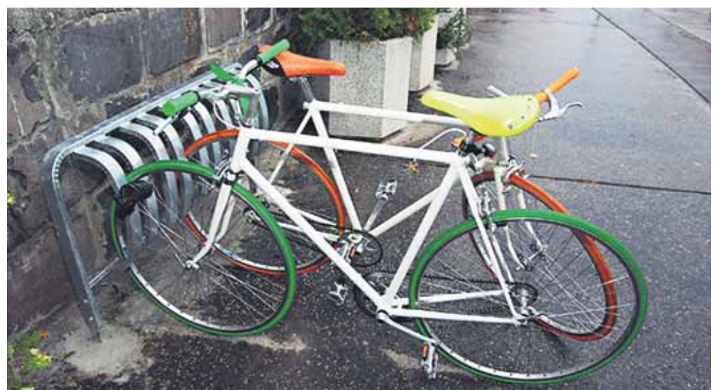
Tri nové cyklostojany sa objavili v Rači – jeden pred budovou kultúrneho strediska Impulz na Dopravnej ulici, druhý pred tým na Žarnovickej, tretí pred miestnym úradom na Kubačovej.

Obyvateľom ich odovzdali v rámci Európskeho týždňa mobility.