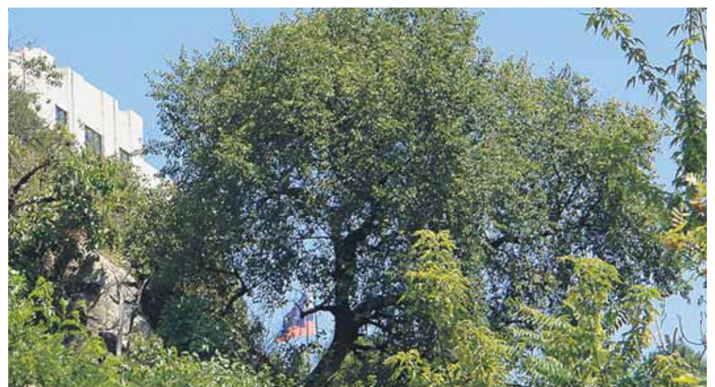
Do konca septembra možno poslať hlas jednému z dvanástich finalistov 9. ročníka ankety o Strom roka 2011, ktorú vyhlásila Nadácia Ekopolis. Jej cieľom je upozorniť na staré, vzácne a ohrozené stromy. Najmladším finalistom je storočná čerešňa mahalebková z Bratislavy, vyrástla na hradnom brale.