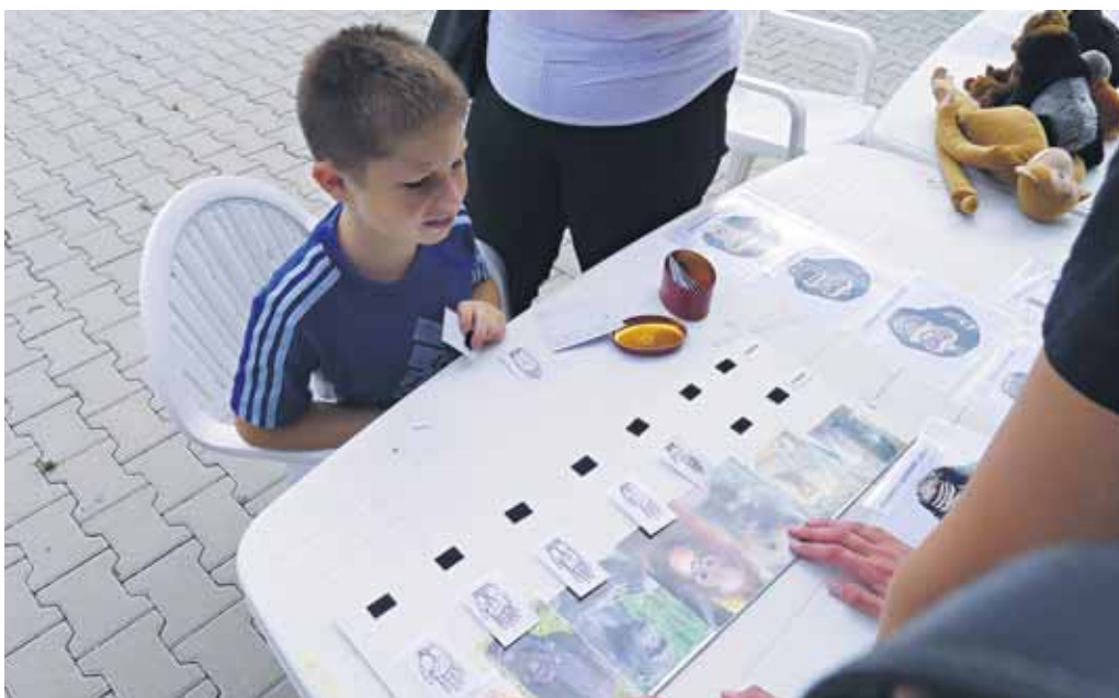
Otestovať si svoje vedomosti o ludoopoch, prípadne si ich doplniť, mohli návštevníci bratislavskej ZOO v rámci nedávneho Poobedia s ludoopmi. Zatiaľ čo najmenej deti mali k dispozícii plyšové hračky a jednoduché obrázky, tie väčšie rozoznávali významy výrazov tváre u šimpanzov a potrápili sa s priradovaním obrázkov rúk a nôh k jednotlivým druhom.