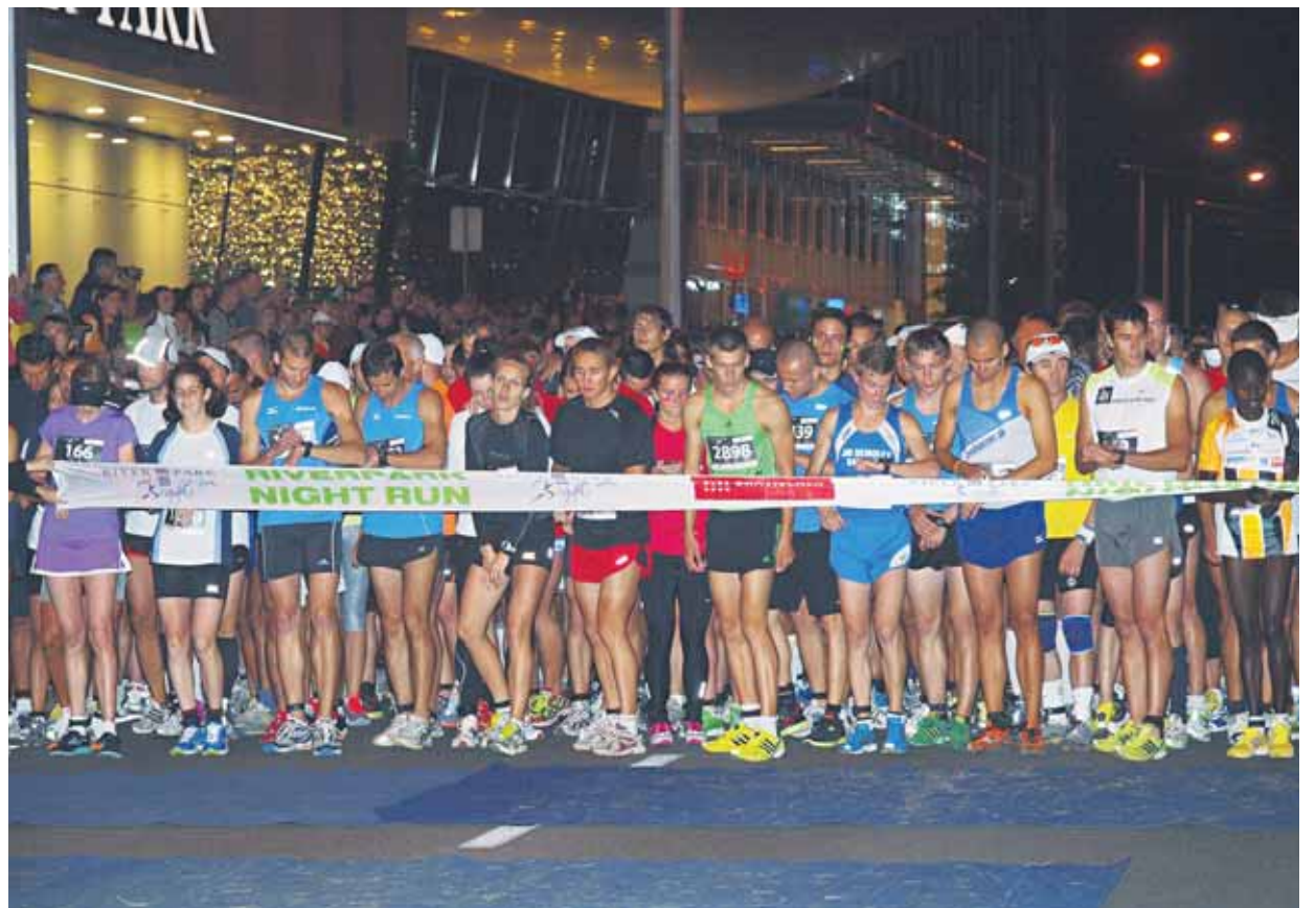
Trofeje v mužskej i ženskej kategórii putovali do Kene.