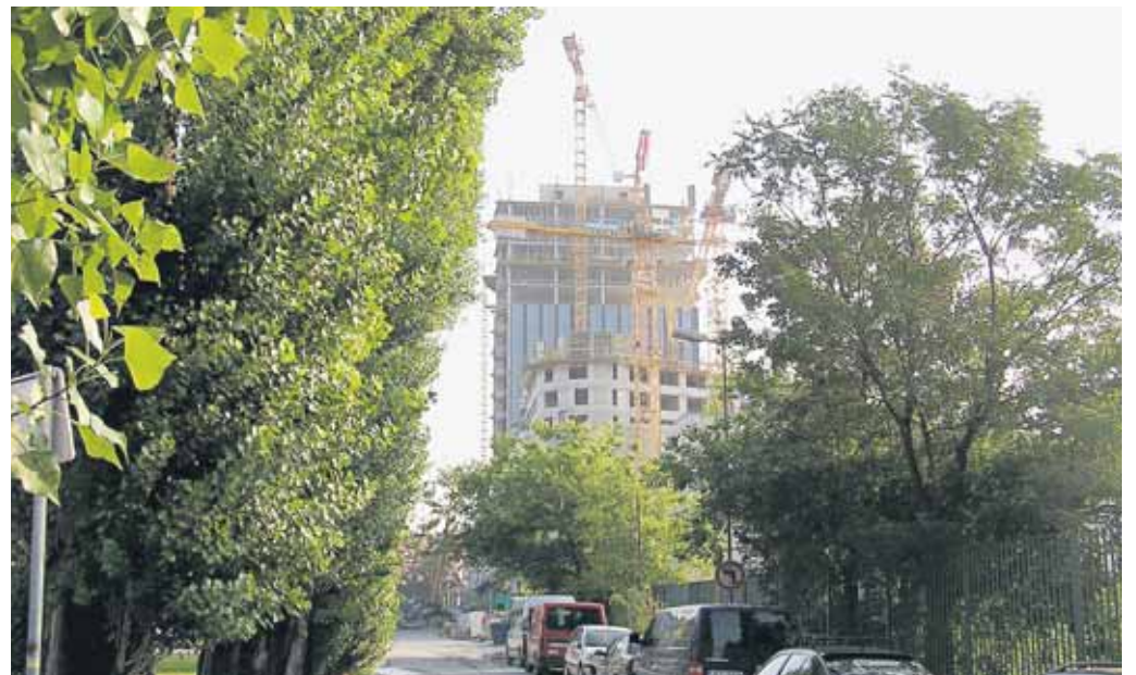
Multifunkčný komplex Centrál v blízkosti Trnavského mýta, ktorého otvorenie je naplánované na rok 2012, má podľa investora projektu, spoločnosti Immocap Group, obchodné priestory obsadené už na 65 percent, administratívne na 75. Medzi budúcich nájomníkov patrí predovšetkým telekomunikačná spoločnosť Orange Slovensko.