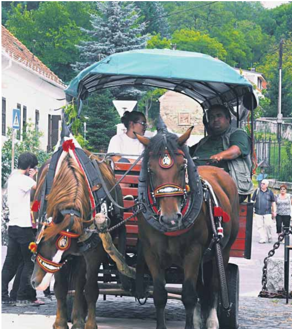
Vinobranie v mestskej časti Devín patrilo k jedným z prvých. Atrakciou bol aj vyzdobený kónský záprah, čo vozil všetky deti a rodičov, ktorí prišli v kroji, alebo aspoň v čepci, klobúčiku či v lajblíku.