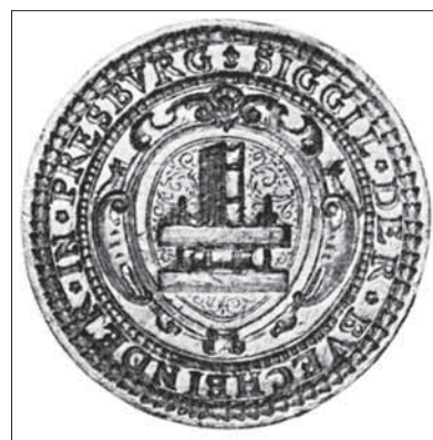
Pečatidlo prešporských knihviazačov uložené v Múzeu mesta Bratislavy.

Zaujímavým ustanovením v štatúte knihárov z roku 1760 bolo, že majster, prv než niekoho prijal za učňa, si mohol až pol roka overovať, či sa na to hodí. Učebná doba bola stanovená na štyri roky, ale mohla sa skrátiť, ak bol učeň primerane snaživý. Aj dĺžka tovarišskej vandrovky bola určená na štyri roky. Po vyučení jedného učňa nesmel majster v nasledujúcich dvoch rokoch prijať do učenia ďalšieho. Schôdza tovarišov sa konala každé dva mesiace, a to u ich predáka, nazývaného tovarišský otec (Gesellenvater), v nedeľu o druhej popoludní. V ten deň zozbierali za každý odpracovaný týždeň po jednom gracijari na chudobných ľuďoch a po dva gracijare mesačne na chorých tovarišov.