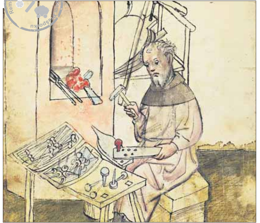
Stredoveký klinciar v norimberskom kódexe.

ki sa platili členské do tunajšej cechovej pokladnice, mohli voľne predávať „svoje remeselnícke výrobky, ktoré majú hlavičku a špic, ako aj rôzne veľké klinec“. Majstri mali prísne zakročiť proti fušerom, ktorí by chceli predávať tovar na trhoch či inde, a v súčinnosti s mestskou vrchnosťou zabezpečovali zhabanie ich tovaru, z ktorého polovica pripadla vrchnosti a druhá časť cechu. Výška ročného členského príspevku majstra (Jahrschilling) bola jeden zlatý. Ak cudzí majstri alebo podomoví preda-