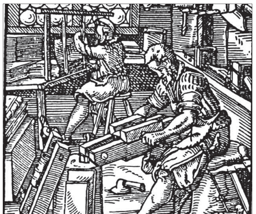
Knihárska dielňa na rytine J. Ammana z roku 1568.