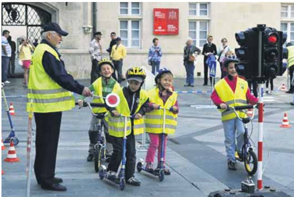
Súčasťou Európskeho týždňa mobility bolo vo štvrtok 22. 9. 2011 na Primaciálnom námestí v Bratislave aj detské dopravné ihrisko.