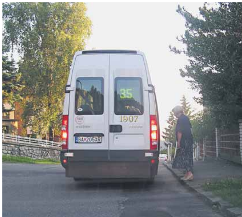
Bratislavský kuriér monitoroval náhodne