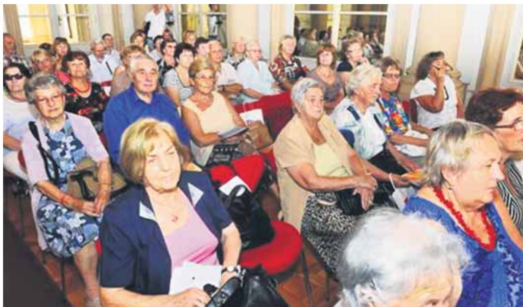
Bratislavskí seniori sa 15. augusta opäť vrátili do školských čias. V Zrkadlovej sále Primaciálneho paláca otvorili Letnú univerzitu pre seniorov, na ktorú sa prihlásilo takmer 150 účastníkov.