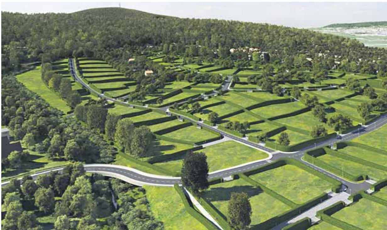
Vizualizácia projektu Záhorské sady.

Západná časť Bratislavy začína postupne dobíhať rozvinutejší východ. V minulom roku bolo oproti krematóriu otvorené obchodné centrum Storeland, v novej štvrti Bory vyrástlo Metro a v tomto roku bolo začiatkom augusta otvorené diaľničné napojenie Stupava - juh, ktoré výrazne odbremeniť frekventované križovatky v okolí. Lokalita prirodzene získava na atraktivite, čo sa postupne prejaví aj novými obytnými štvrtami a hustejším osídlením.