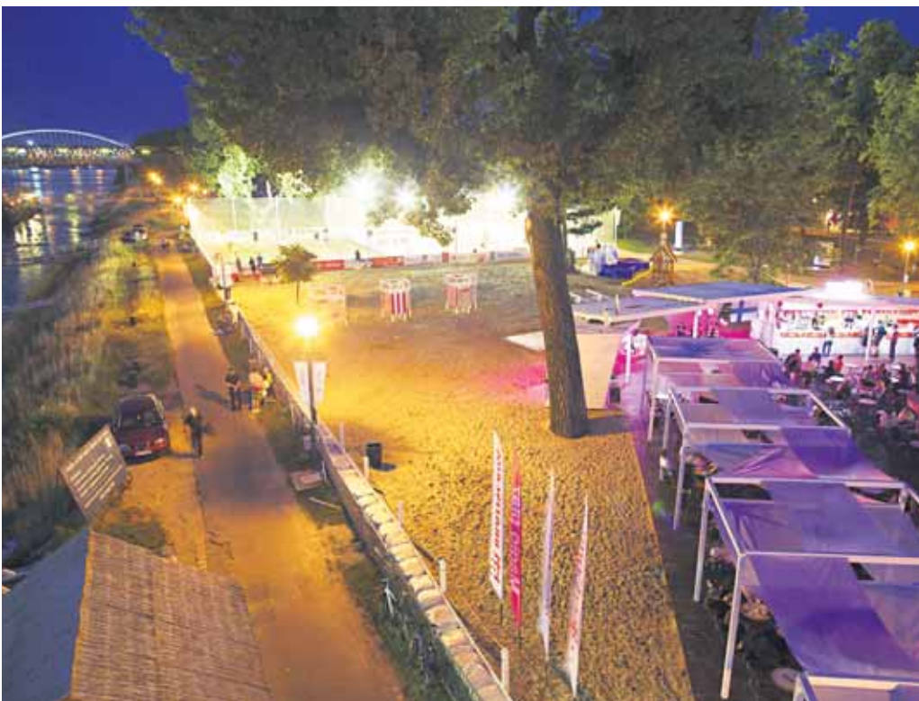
Kultúrnymi a športovými aktivitami je tohtoročný program doslova nabitý. Na pódiu sa zatiaľ vystriedali kultúry 12 krajín, momentálne prebieha Mexický týždeň a sezónu uzavrie Thajský týždeň.