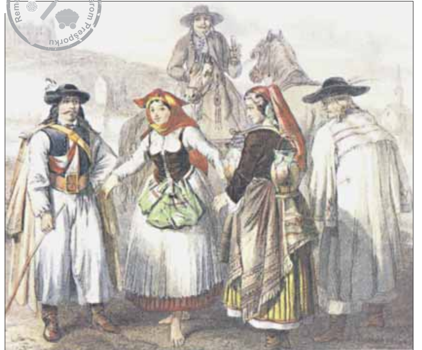
Maďari a Chorváti z okolia Prešporka oblečení v halenách (okolo roku 1850).

variš ani učeň nesmel kupovať ani popíjať víno v Podhradí, na Farskej ulici alebo v Dome bielych bratov (na dnešnej Panskej ulici). Koho by pri tom prichytili, dostal by pokutu, a to majster 12, tovariš 6 funtov a učeň 3 funty vosku. Kto sa chcel stať učňom, musel sa dostaviť s dvomi ručiteľmi k majstrovi a ten sa za prítomnosti ďalších dvoch majstrov dohodol na podmienkach a dĺžke učenia, ktoré mohlo trvať dva alebo tri roky. Ak sa dohodli na dvoch rokoch, tretinu z peňa-