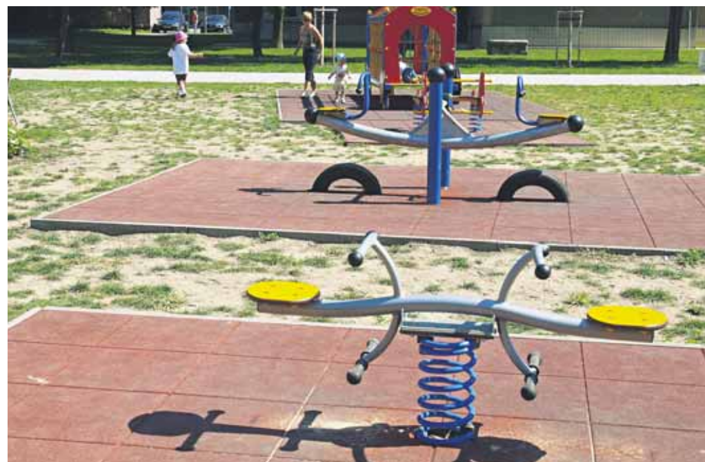
Ružinovčania už chodia do zrekonštruovaného parku s detským ihriskom v Ružovej doline, v ktorom sa objavili aj fitness prvky a drobná záhradná architektúra. Okrem toho v ňom pribudli chodníky, parkový mobiliár, zábrany proti parkovaniu na zeleni a vysadili tam 47 nových stromov.