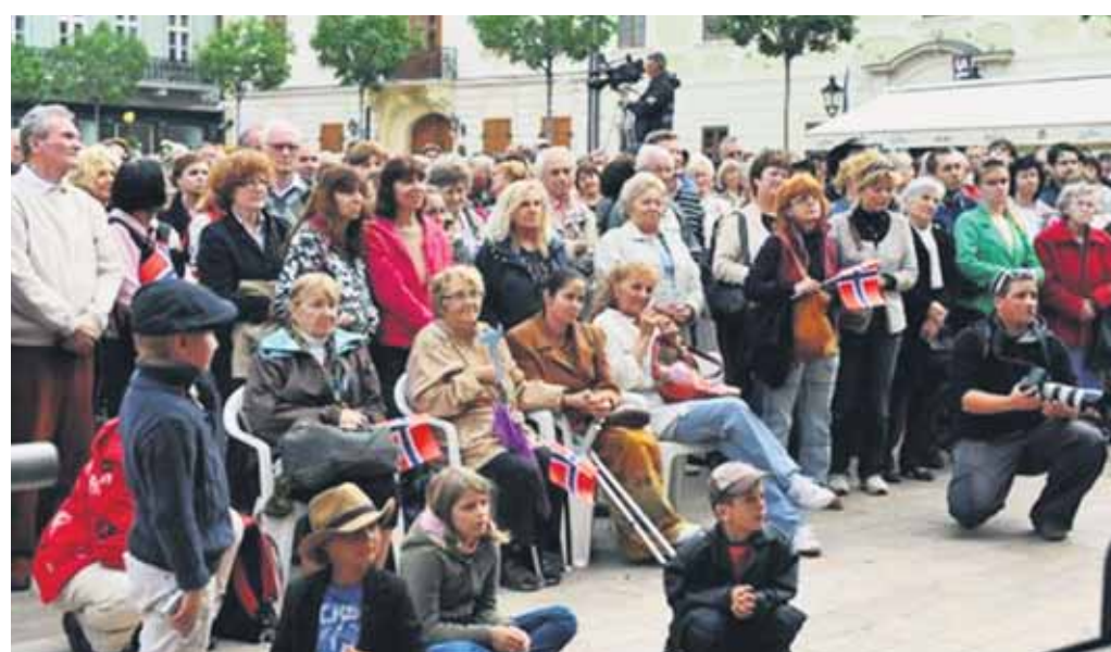
Solidaritu a úctu Nórsku a pozostalým obetí tragédie vyjadrili obyvatelia a návštevníci Bratislavy v nedeľu 31. júla 2011 prostredníctvom symbolického Koncertu pre Nórsko. Stalo sa tak vďaka občianskej iniciatíve Ruža pre Nórsko a magistrátu Bratislavy.