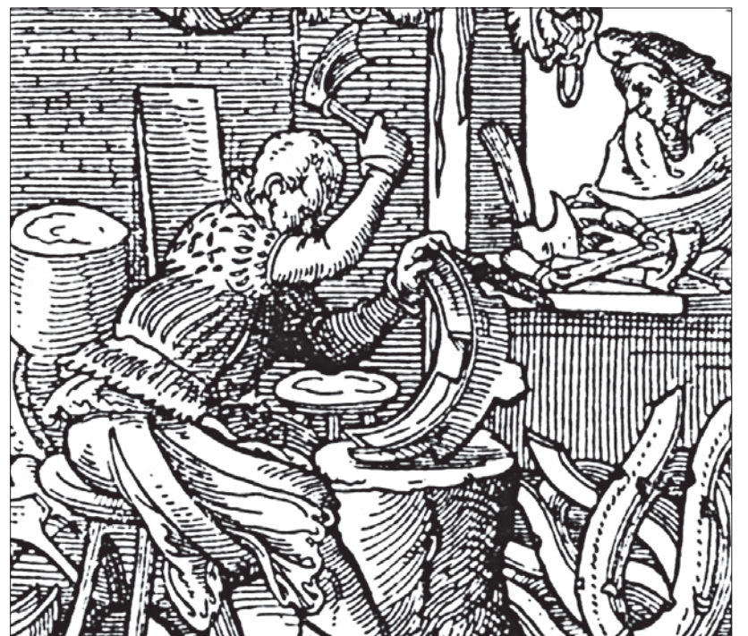
Sedlárskeho majster na rytine Josta Ammana z roku 1568.