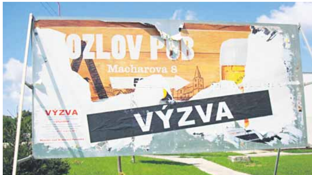
Čiernou páskou začali v Petržalke označovať „načierno“ postavené billboardy. Objavuje sa na nich výzva, aby ich vlastníci, prípadne zriaďovateľ alebo užívateľ, zosúladiли svoje zariadenie s platnou legislatívou. Ak sa tak nestane do 31. augusta, odstránia ho.