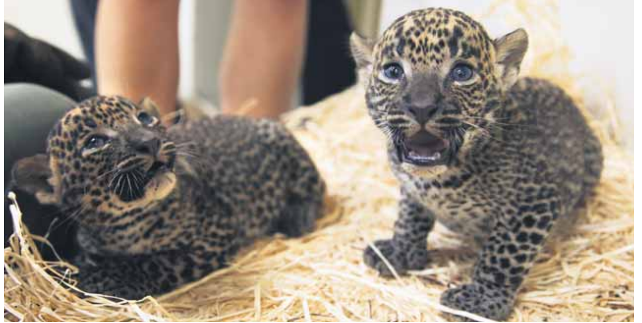
Sarisku s jej dvoma malými slečnami dočasne premiestnili späť do vnútorných boxov, na cudzích ľudí totiž reagovala agresívne.

Dve mládatá leoparda cejlónskeho - samicčky Nayana a Nimali - sa ešte koncom júna narodili v bratislavskej ZOO. Sú to prvé leopardie mládatá narodené v novom Pavilóne šeliem.