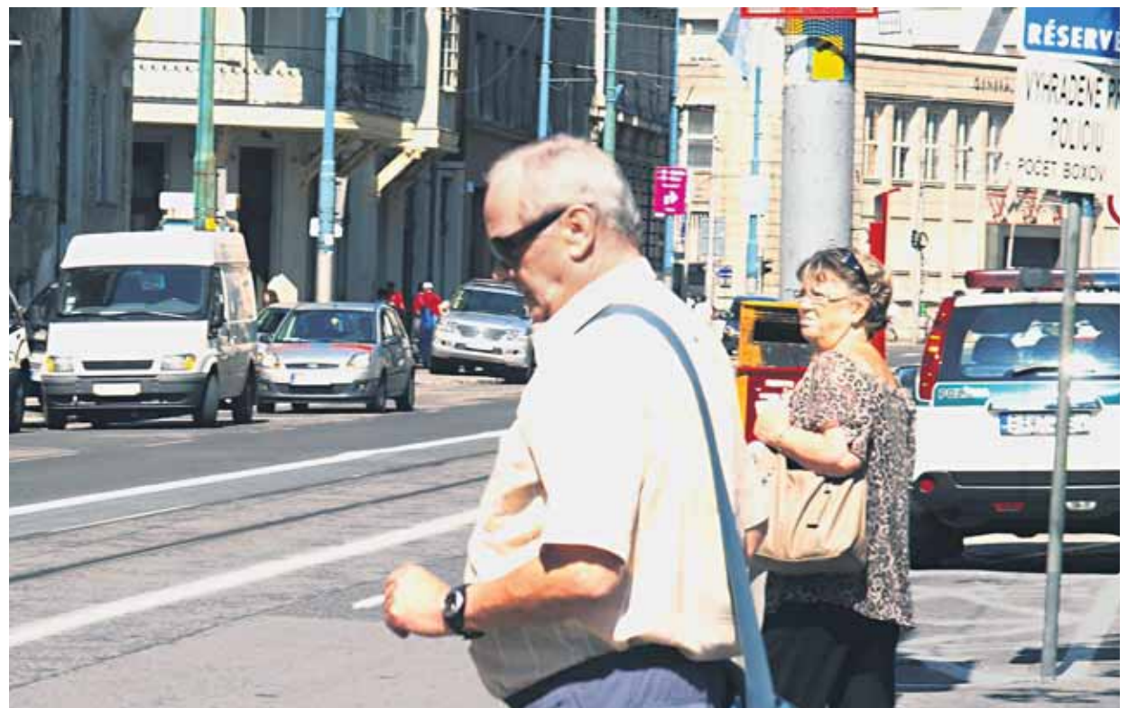
Fajčiarov na zastávke sme nemuseli dlho hľadať ani s naším objektívom.