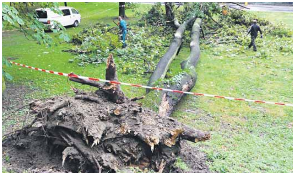
V Sade Janka Kráľa, oproti bývalému štadiónu Artmedie Petržalka, sa v koreňovej časti zlomil javor poľný, našťastie nikoho nezranil. Odstraňovali ho pracovníci miestneho podniku verejnoprospešných služieb.