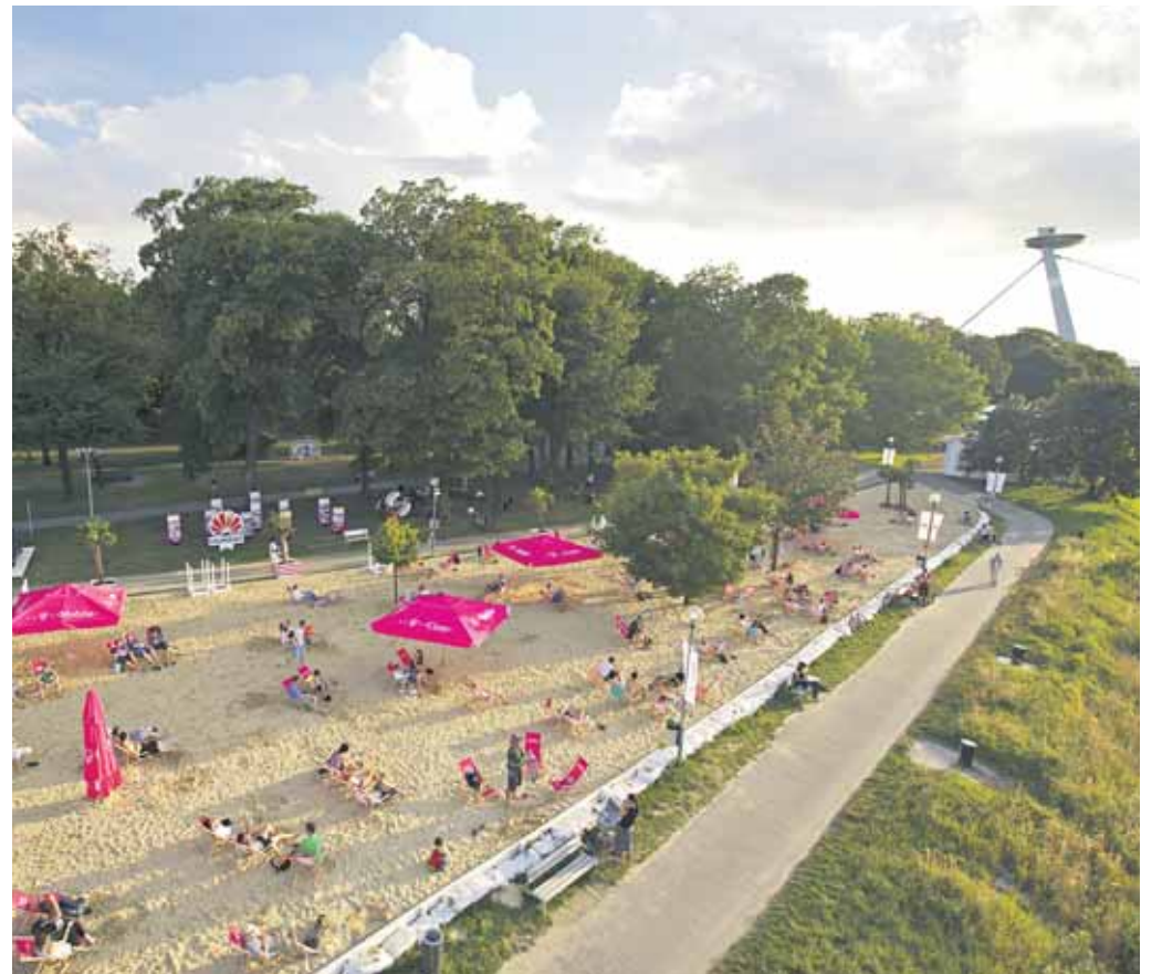
Oblíbená mestská pláž vstúpila do svojej záverečnej fázy. Z 93 prevádzkových dní si už odkrútila 83. I keď leto nebolo podľa predstáv, návštevníci sa nemuseli nudieť.