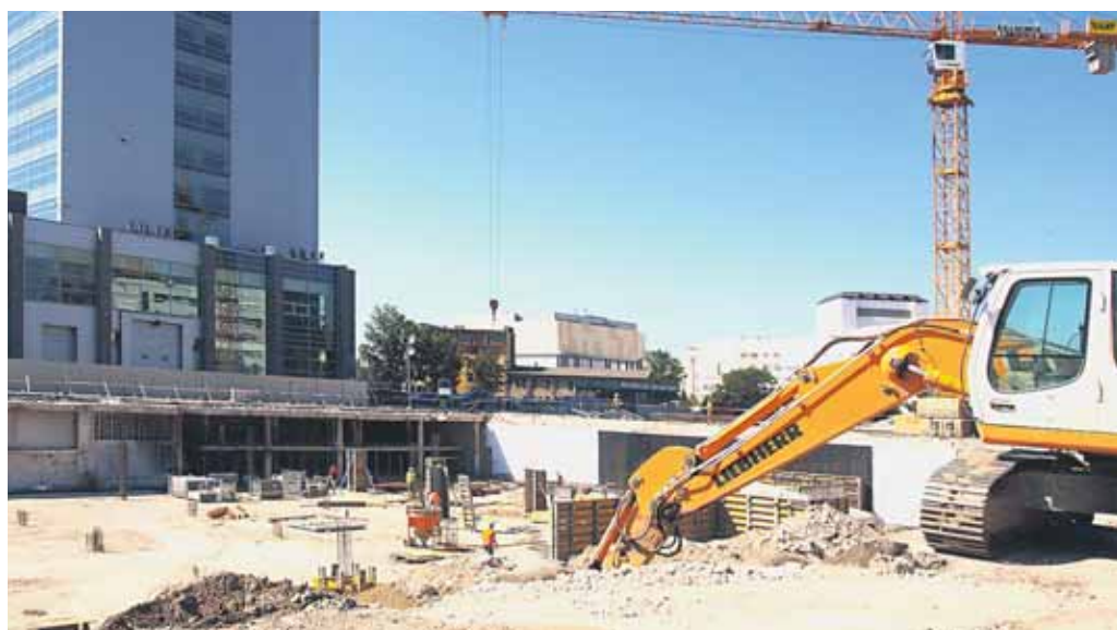
Nové polyfunkčné centrum začali stavať v bezprostrednej blízkosti objektu Tower 115 a budovy nového SND. Ako sa píše na internetovej stránke J&T Group, projekt Panorama City bude obsahovať aj siluety dvoch monumentálnych obytných veží, ktoré sa stanú najvyššími budovami na území bývalého Československa.