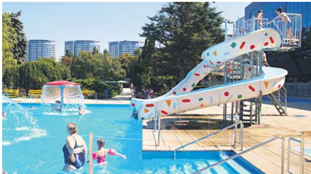
Stráviť celé tohtoročné letné prázdniny na kúpaliskách bratislavské deti kvôli počasiu nemohli. Minulý týždeň sa tam ale mohli vybrať hneď niekoľkokrát, na snímke je atmosféra na Tehelnom poli v bezprostrednej blízkosti Zimného štadióna Ondreja Nepelu.