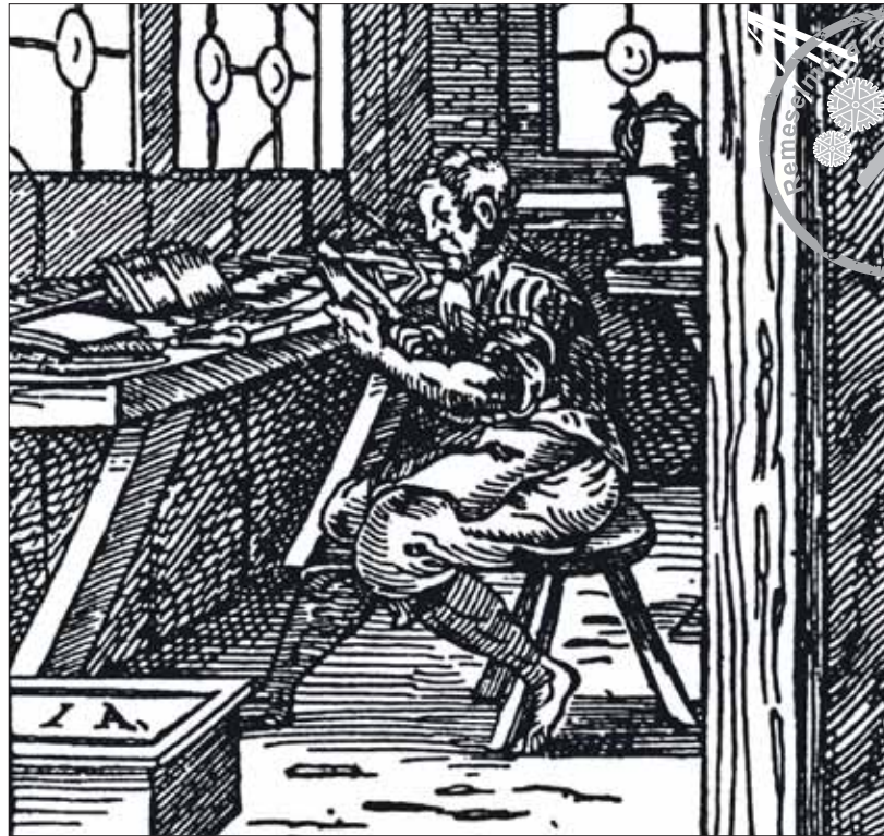
Hrebenár na rytine Josta Ammana z roku 1568.

Štatút prešporšského hrebenárskeho cechu z roku 1741 je písaný po nemecky a pozostáva vlastne z dvoch častí: zo všeobecnej, ktorá