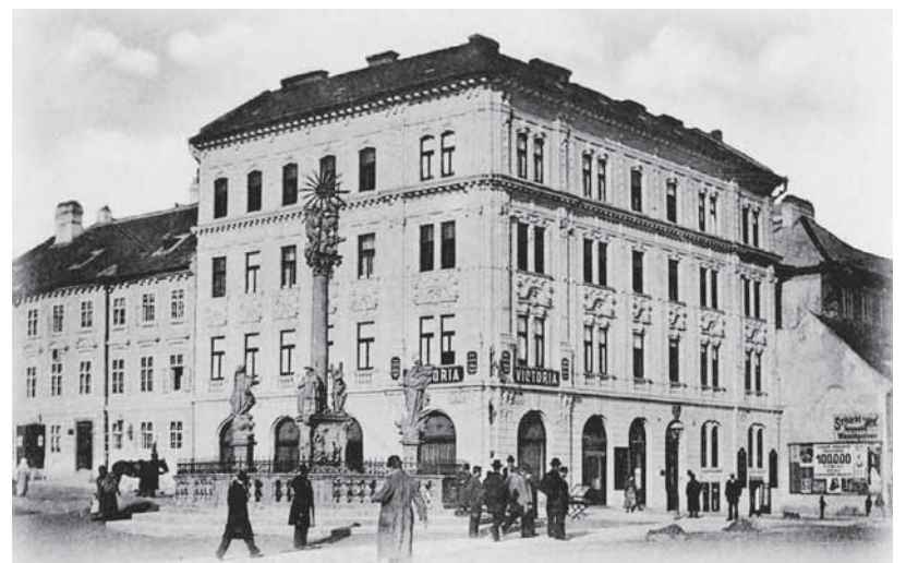
Kaviareň Victoria, neskôr Corso na Rybnom námestí.

že roku 1885 v Prešporoku oficiálne evidovali 12 kaviarní, roku 1895 poskytovalo zákazníkom služby 17 kaviarní a o dvadsať rokov neskôr, čiže roku 1915, si mohli Prešporčanovia posediť pri káve a prečítať si