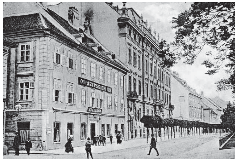
Kaviareň Secession na niekdajšej Promenáde (dnes Hviezdoslavovo námestie) bola koncom monarchie obľúbeným miestom prešporšských právnikov.

Roku 1773 pracovali v hrebenárskom cechu v Prešporoku štyria majstri, ktorí spolu s tovarišmi dokázali vyrobiť za mesiac viac než 3 700 rozmanitých hrebeňov v hodnote takmer 150 zlatých, čo predstavovalo priemerne asi 450 zlatých na jedného majstra do roka. Okolo roku 1820 bolo v meste už sedem hrebenárov, na Podhradí dvaja, roku 1828 pôsobilo v Prešporoku 11 hrebenárskych majstrov.