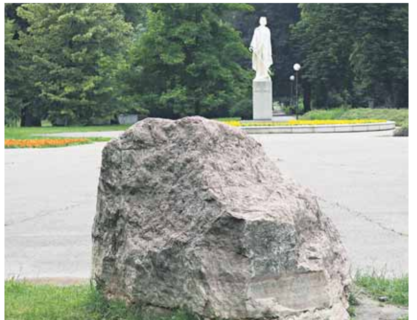
Základný kameň budúceho Pamätníka slovenského vystahovalectva v Sade Janka Kráľa.