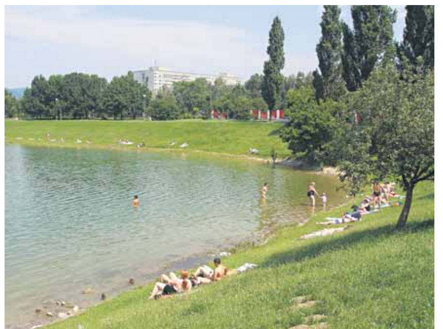
Kvalita vody bude aj počas leta pravidelne kontrolovaná.