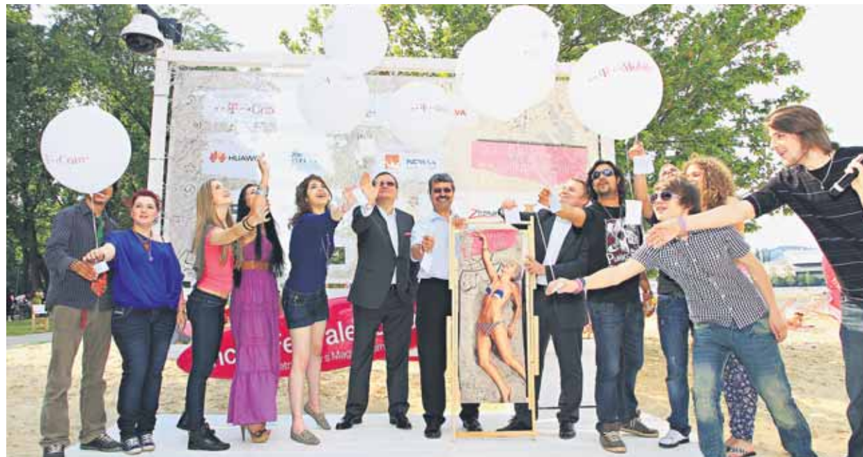
Na otvorení sa zúčastnili aj finalisti Česko Slovenskej Superstar.