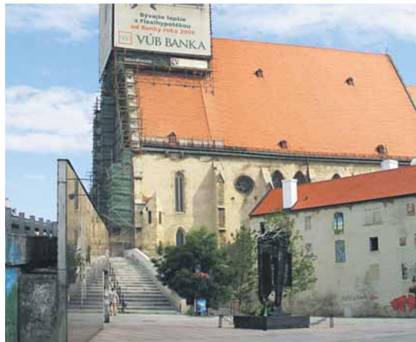
Zmenšené kulisy zbúranej Neologickej synagógy postavia na budúci rok pred Bibianou.