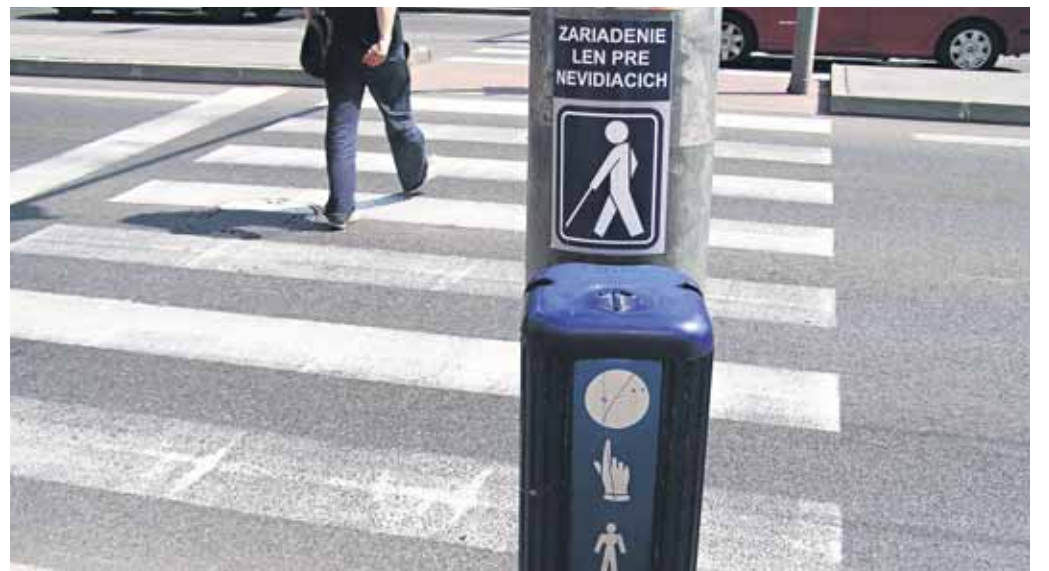
Dopytové zariadenia pre chodcov (modré skrinky na signalizačných stožiaroch) na bratislavských križovatkách rozlišia. Na niektorých je totiž aktivovaná len funkcia pre nevidiacich občanov, mnohí vidiaci ich však považujú za tie, pomocou ktorých si „privolajú“ zelenú na semafore. Skúšobne nalepili nálepky na skrinky na križovatkách Šancová – Jelenia, Trnavská – Jéheho, Záhradnícka – Miletičova, Záhradnícka – Jéheho a Trnavská – Sabinovská.