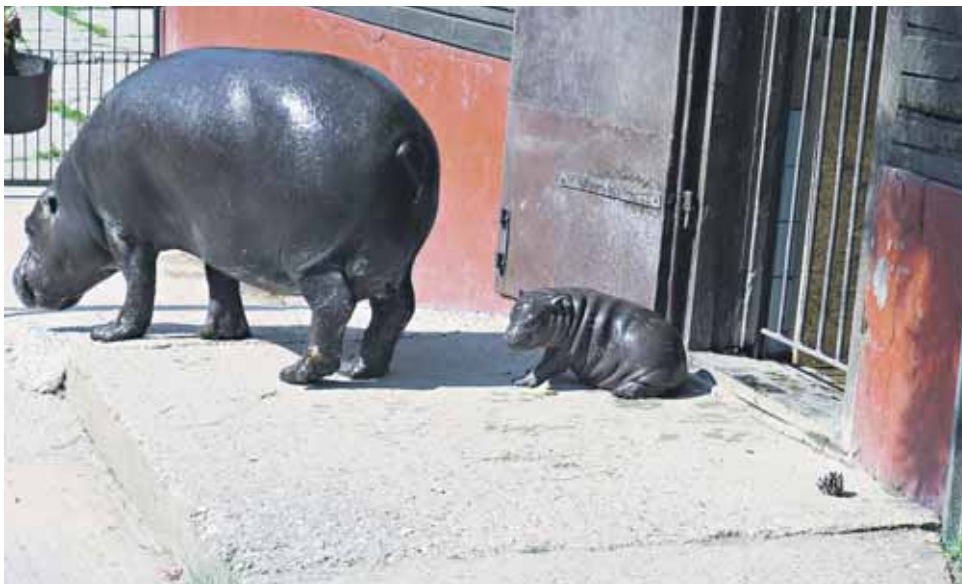
Najmenší hrošík libérijský, ktorý sa už mesiac pohybuje po bratislavskej ZOO, sa narodil rodičom s obrovským vekovým rozdielom.