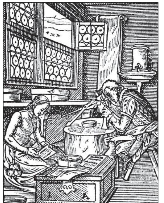
Ihlárska dielňa na rytine Josta Ammana (1568)

Úmerne s rozvojom palných zbraní upadal aj význam panciernického remesla, ktoré v novoveku postupne zanikalo. Potreby panciernickej výroby ešte istý čas zabezpečovali kováčske dielne a hámre.