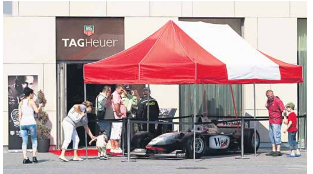
Firma TAG Heuer priviezla na Slovensko zberateľský kúsok Formuly 1 McLaren MP4-13, v ktorom McLaren F1 tím jazdil v sezóne 1998 a dosiahol v ňom skvelé úspechy. Exponát bol vystavený počas predposledného májového víkendu pred Eurovea Galleria v Bratislave.