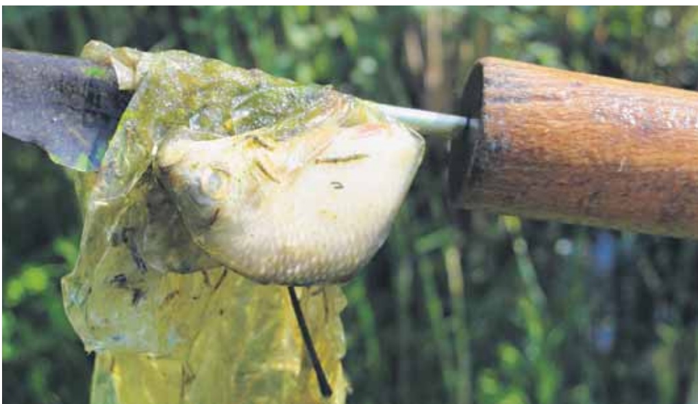
Celkovo 72 igelitových vriec naplnili odpadkami tí, ktorí prišli čistiť okolie Chorvátskeho ramena v Petržalke (bolo ich 190). Našli aj niekoľko neživých rýb a žiab (jedna ryбка sa udusila v gumenej rukavici, aká sa používa pri výbere pečiva v obchodoch), kondómy a takmer plnú fľašu značkového alkoholu.