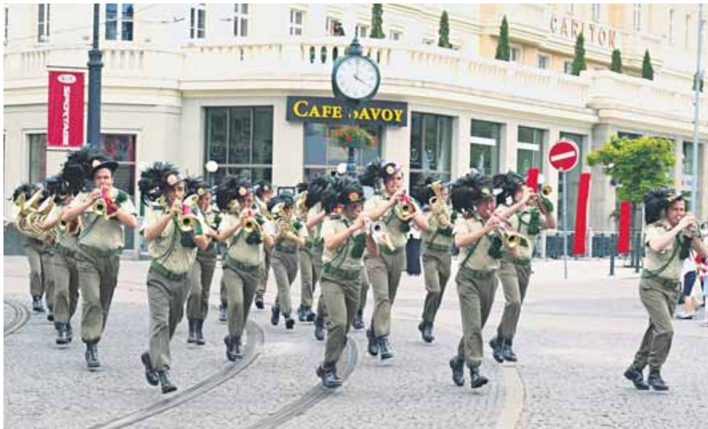
Takmer dve desiatky podujatí ponúka počas tohto mesiaca festival Taliansky kultúrny jún. Jedným z prvých podujatí boli koncerty dvoch vojenských telies na Hviezdoslavovom námestí – vojenskou dychovou hudbou Ozbrojených síl SR a talianskou vojenskou dychovou hudbou.