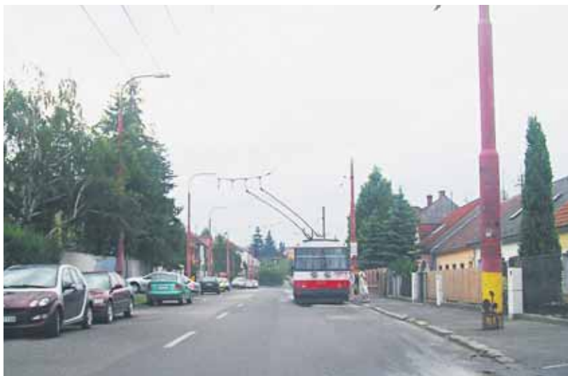
Trolejbusy by mali časom opustiť ulicu Pri Suchom mlyne.

budujú odbočenia na trolejbusovú trať Kramáre - Mlynská dolina, čo umožní predĺženie linky 207 z centra mesta k Vojenskej nemocnici. Dĺžka navrhovanej trolejbusovej trate je 2 050 metrov. Využitím nového prepojenia by malo dôjsť aj k zníženiu neproduktívnych manipulačných jazd o 85 000 kilometrov za rok, čo by predstavovalo ročnú úsporu 63 000 eur. Realizácia stavebných činností je naplánovaná na september 2012 až marec 2013. Termín začatia prevádzky je predpokladaný v apríli 2013.