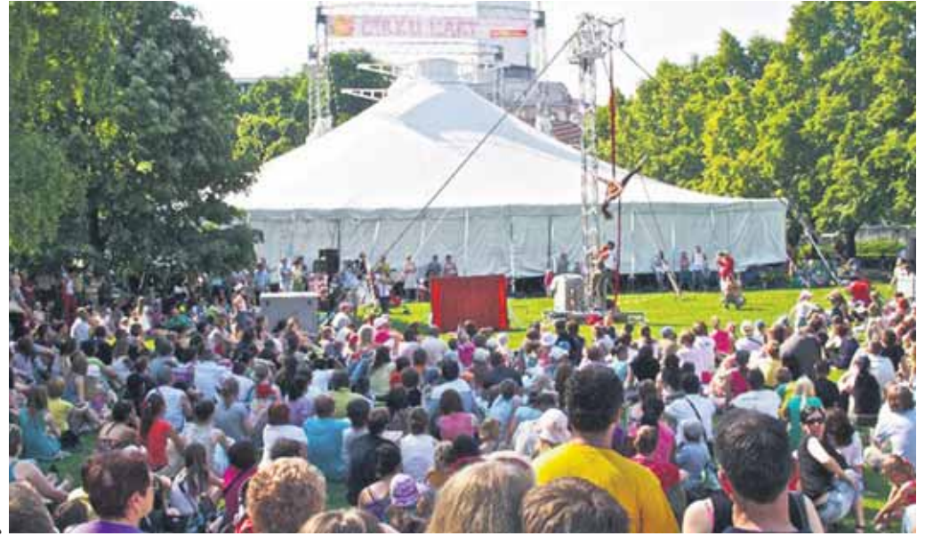
Festival nového cirkusu Cirkulart má za sebou svoj nultý ročník. Viacerí obyvatelia hlavného mesta aj vďaka nemu objavili čaro Medicej záhrady, ktorá praskala vo švíkoch. Hlavný program sa odohrával v cirkusovom šapitó, ktoré vhodne dopĺňalo atmosféru predstavení konajúcich sa pod holým nebom, trávnikoch či chodníkoch.