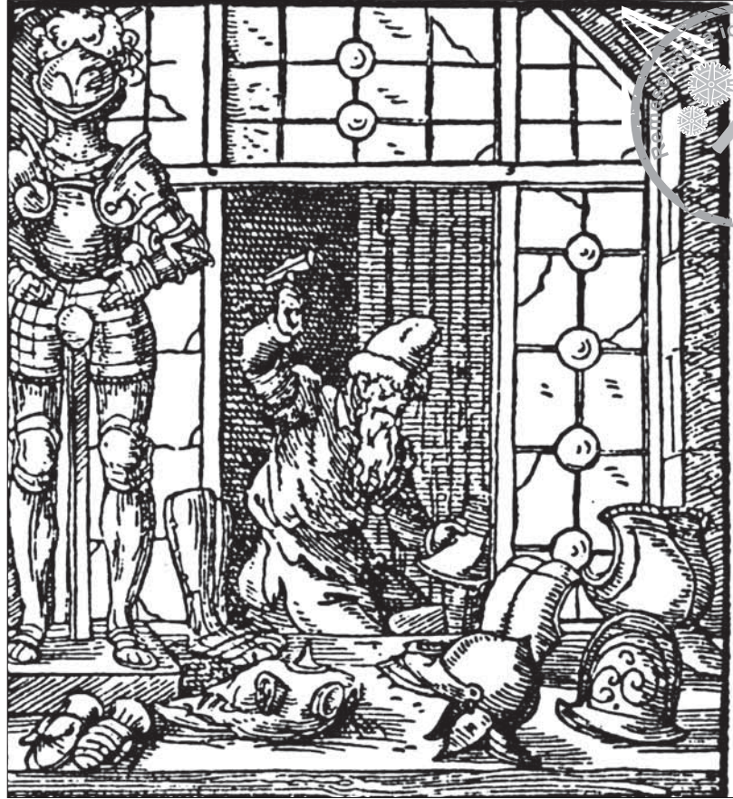
Panciernik na rytine Josta Ammana (1568)

Na spevnenie drôteného brnenia sa neskôr (od prelomu 13. a 14. storočia) zvykli pridávať aj kusy kovového plátu, ktoré mali