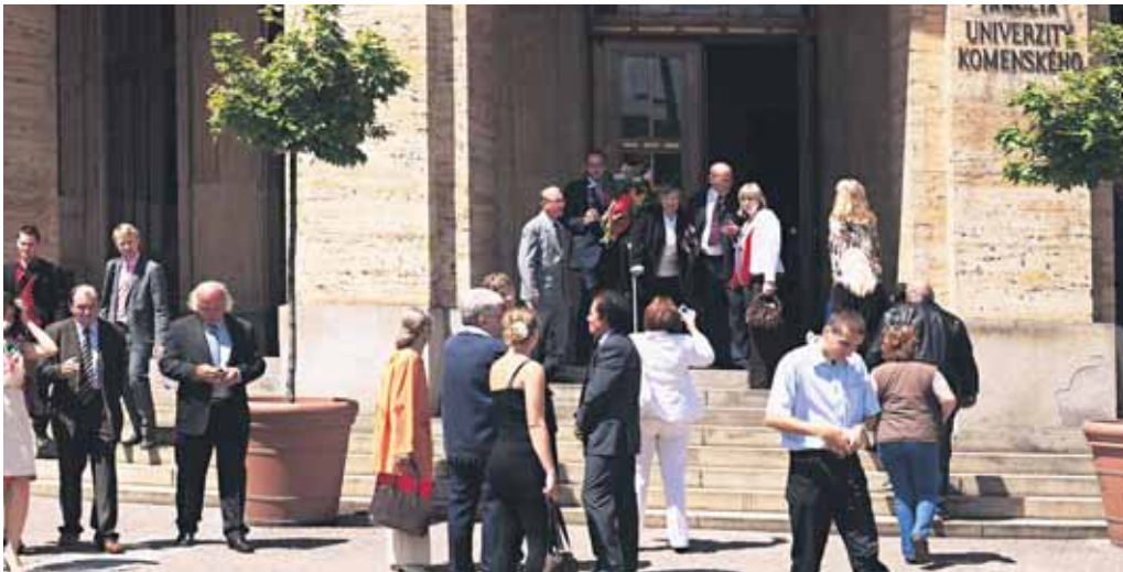
Na najväčšej slovenskej univerzite – Univerzite Komenského v Bratislave – sa od stredy 8. júna 2011 začne obdobie letných promócií. Do konca júla sa tu uskutoční spolu 153 promócií absolventov. Najviac – až 110 promócií – čaká na absolventov magisterského a doktorského štúdia, 39 promócií zorganizuje univerzita pre absolventov bakalárskeho stupňa štúdia.