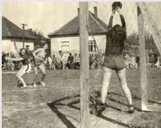
Hlavným poznávacím znakom českej hádzanej bola vždy brána – vyššia ako širšia

Ku cti hádzanárskeho činovníka slúžilo, že sa snažili šport zachrániť, no prílišný optimizmus sa