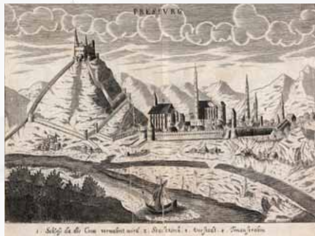
Medirytina Prešporoka od neznámeho autora z roku 1685 sa nachádza v zbierkach Galérie mesta Bratislavy.

O čo nehodnovernejšie pôsobí samotná veduta, o to reálnejší je slovný opis mesta, ktorého autorom je J. Ch. Wagner. Do slovenčiny ho možno pretlmočiť nasledovne: „Prešporok je v dnešných dňoch hlavným mestom tohto kráľovstva; leží na Dunaji v pôvabnom a utešenom kraji. Mesto nie je osobitne veľké ani mocné, zato Hrad, kto-