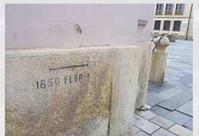
Ryska s dátumom 5. februára 1850 na nároží Primaciálneho paláca.

Prístavný most v Bratislave postavili v rokoch 1777 – 1985, no železničná časť bola daná do prevádzky už v roku 1983. Pôvodne, až do roku 1993 niesol názov Most hrdinov Dukly. Ocelový diaľnično-železničný most premostuje Dunaj i časť Zimného prístavu v dĺžke takmer 600 m. Tento dvojpodlažný most s diaľnicou na hornom, železnicou a chodníkom pre peších i jazdným pruhom pre cyklistov na spodnom podlaží je ojedinelým technicky vyspelým dielom. Pôvodne bol navrhovaný na 50-tisíc vozidiel denne, no podľa aktuálnych údajov Národnej diaľničnej spoločnosti po ňom každý