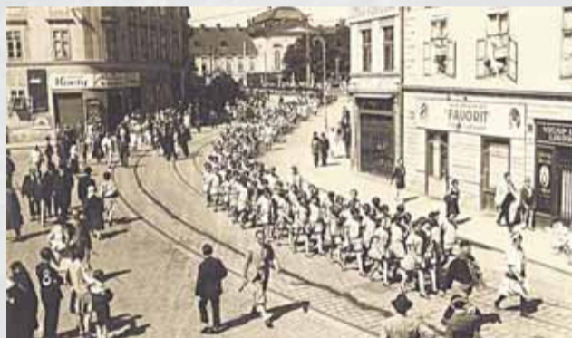
Sokolský sprievod Bratislavou po otvorení novej sokolovne v júli 1927.

Po prieniku nemeckého handbalu do Bratislavy v polovici 20. rokov 20. storočia sa ťažkopádni obhajcovia českej hádzanej zobudili. Príležitosť niečo urobiť a nielen si zaspomínať na pomerne nedávne skvelé hádzanárske časy dal Bratislavčanom propagačný zápas moravských klubov ženskej českej hádzanej Moravskej Slavie proti Achillesu Brno. Slovenský denník si vtedy nostalgicky povzdychol: „Svojho času hrala sa krásna hádzaná v Bratislave, ale behom doby zašla. Bol to dôsledok stále zhoršujúcej sa situácie I. ČSČK Bratislava, ktorý nemal toľko hmotných prostriedkov, aby tento šport mohol podporovať. Za to maďarské a nemecké spolky ujal sa ženských športov a priniesli do Bratislavy nemecký handbal, ktorý sa tak ujal, že bol založený zväz handballu.“