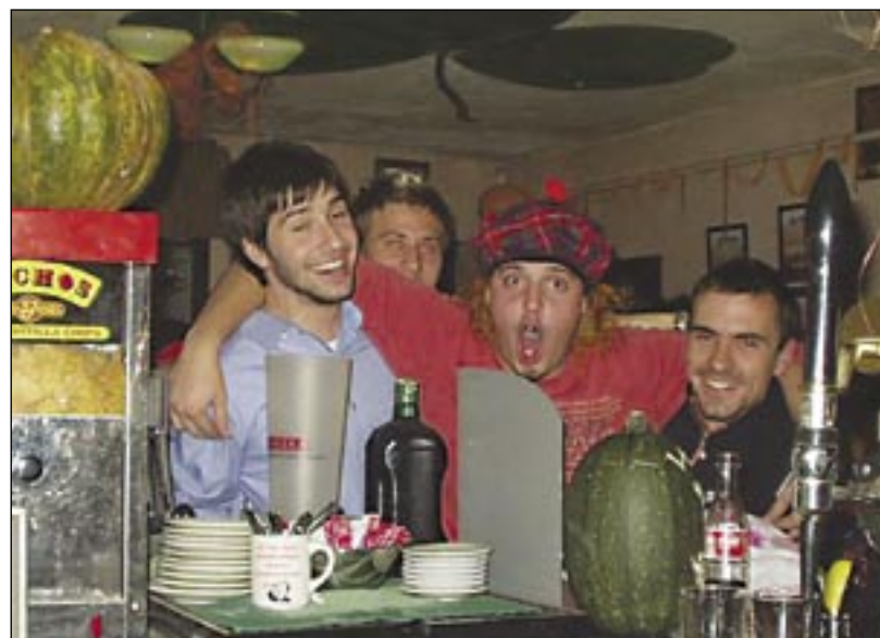
Samospráva chce od 1. decembra účinnejšie bojovať proti hlučným zariadeniam

Hlasovanie: PRÍTOMNÝCH: 25 poslancov, ZA: 22, PROTI: 0, ZDRŽALI SA: 3.