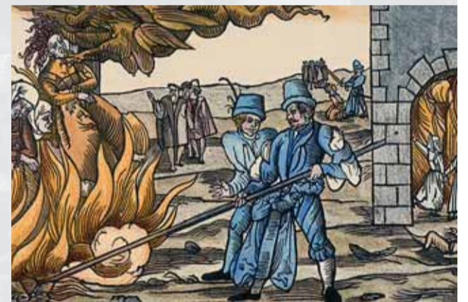
Kolorovaný leták so znázornením upalovania bosoriek zo 16. storočia.

Súčasťou súdneho protokolu údajne bola aj nevelká potvrdenka s malou červenou