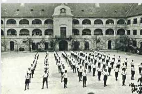
Vyvíjajúci vojaci c. a k. 72. pešieho pluku na nádvorí Vodných kasární.

Prvé moderné dvojposchodové kasárne v Bratislave (niekdajšom Prešporoku) dostavali a dali do užívania armáde roku 1763. Celý náklad na ich stavbu poskytlo mesto. Pôvodne slúžili na ubytovanie 500 vojakov, čo významne odbremenilo mešťanov od povinnosti ubytovávať vojakov. Ide o kasárne na dunajskom nábreží, ktoré sa v známej zľudovenej pesničke ospevujú ako „prešporácka kasáreň maľovaná“. V historickom povedomí sa pretieto kasárne vžil názov Vodné kasárne. V posled-