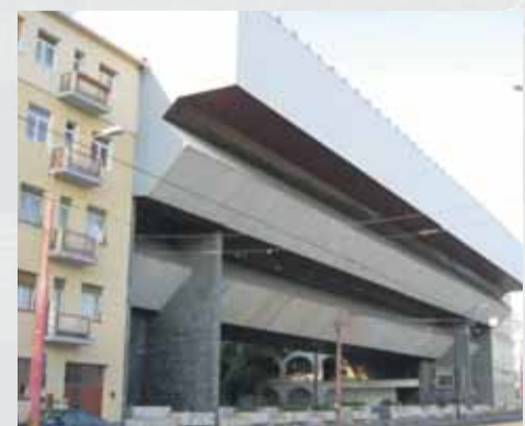
Dnešná podoba priečelie SNG, niekdajších Vodných kasární.