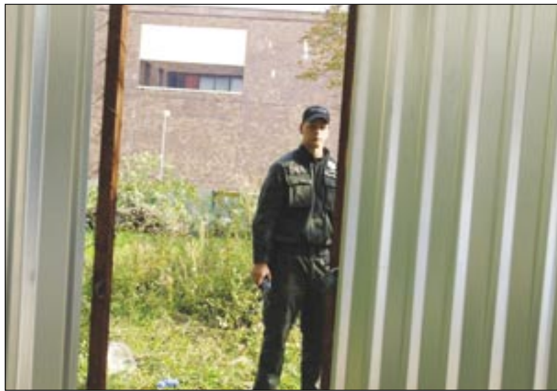
Na zásah polície bol výrub zastavený

Dodajme, že investor síce mal rozhodnutie mestskej časti na výrub drevín v parčíku na Belopotockého ulici z apríla minulého roku, avšak toto rozhodnutie je podmienené právoplatným stavebným povolením stavebného