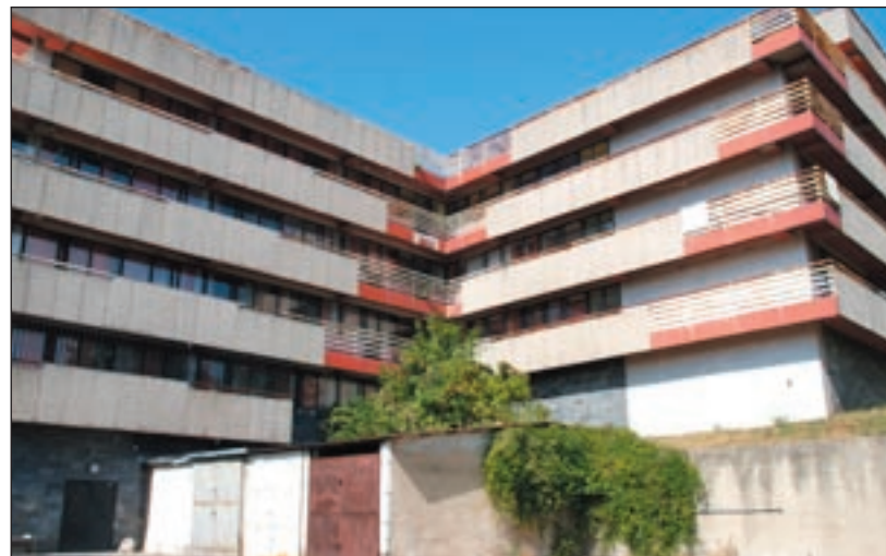
Najkritickejšia je situácia v Mlynskej doline

Ďalším nezanedbateľným problémom je financovanie počas školského roka. Príspevky dostáva internát od štátu iba desať mesiacov, ale akademický rok trvá plných 12. Množstvo študentov si dopĺňa štúdium alebo má štátnice aj cez letné prázdniny, ktoré platia pre stredné a základné školy. Zvyšné dva mesiace je internát bez príjmu a musí si pomôcť, ako vie.