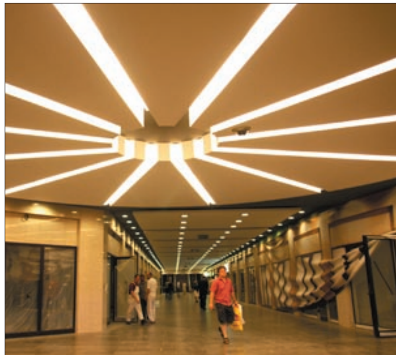
Ukážkový podchod na Hodžovom námestí