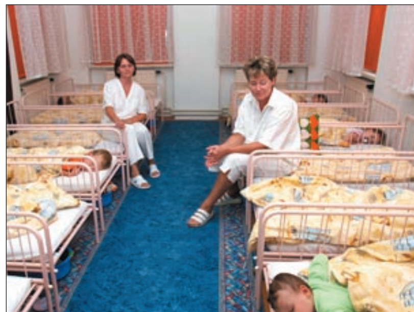
Starosta odovzdal jasliam na Čajkovského ulici novú kuchyňu