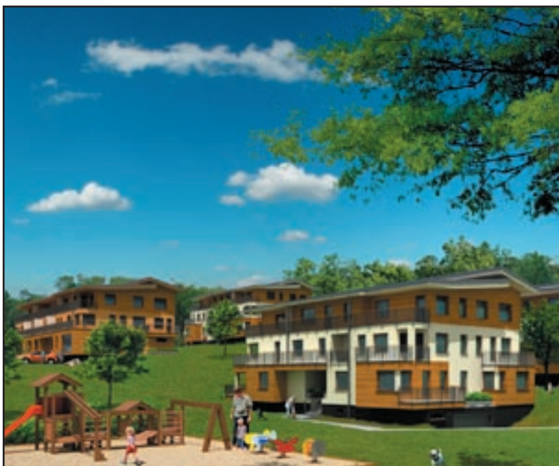
Vizualizácia projektu Viladomy Devín