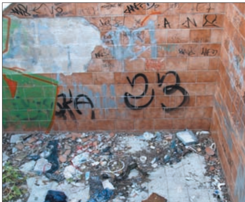
Takáto tvár niektorých bratislavských podchodov nie je žiadnou výnimkou