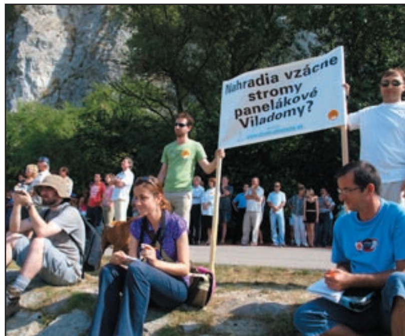
Protestná akcia hŕstky odporcov

na viladomoch už niekoľko stavebných úprav. Rozhodli sa znížiť rezidencie v tretej a štvrtej etape o jedno podlažie, čo znamená o 50 – 60 bytov menej a stratu 315 miliónov korún (10 456 084 eur). Zmenili pôvodnú fasádu domov, kvôli požiadavke zachovania vidieckeho rázu Devína. Domy dostali sedlové