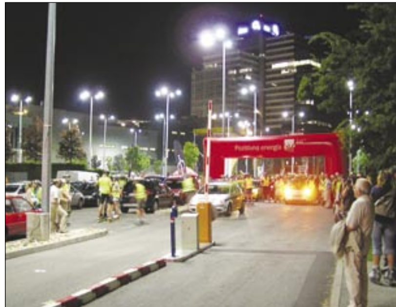
Na večerný štart za Auparkom sa v piatok postavilo vyše tisíc korčuľiarov