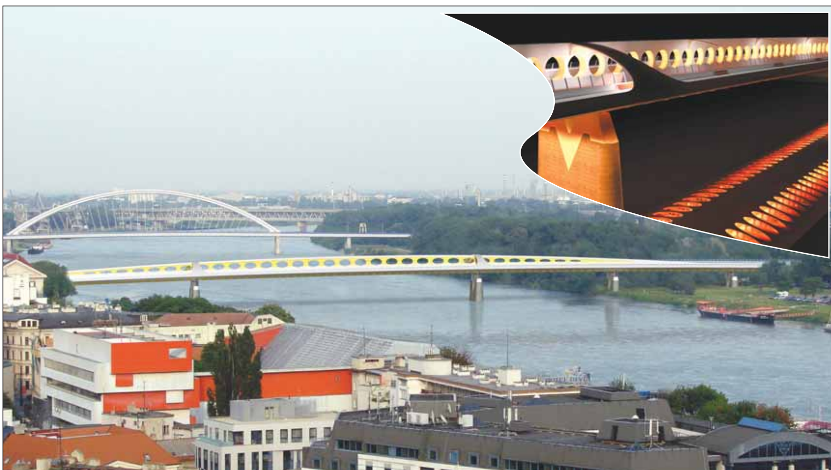
Vítazný variant B „Perforované rebro“ získal vyše 11 000 hlasov

Prestavba mosta, na ktorom je v súčasnosti komunikácia, pešia lávka a nevyužívaná železničná trať, bude dôležitou súčasťou budovania prvej etapy nosného dopravného systému. Cez Dunaj sa bude dať dostať do Petržalky aj rýchlou električkou. V prvej fáze spojí Šafárikovo námestie a Bosákovu ulicu. Neskôr by mala premávať až po Janíkov dvor. Pre