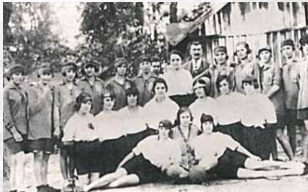
Handbalistky ŠK Ligeti a PTE Bratislava v roku 1925 pred vzájomným zápasom.

bratislavských klubov, a to maďarského PTE (Pozsonyi Torna Egyesület) a nemeckého Zwirnfabrik SC. Zápas sa odohral na ihrisku „cvernovkárok“ v areáli ich továrne. Z krátkého oznamu v novinách neboli veru nadšení najmä