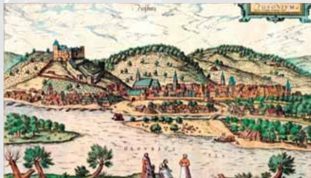
Kolorovaná veduta Bratislavy z 2. polovice 16. storočia vcelku verne zachytáva neskorostredovekú podobu mesta a jeho okolia vrátane západných a južných predmestí.

Najstarší zachovaný súpis daňových poplatníkov síce zachytáva len predmestia Bratislavy, no aj tak je významným prameňom pre poznanie topografie. V daňovom zozname sú zaznamenané tieto predmestské ulice či lokality: super fossatum Castris (dnešná Zámocká ulica), Gaissngasse (Kozia ulica), Slutergasse (Nánosová, dnešná Zochova), privata monialum (neskôr Nuppenpahn, Panenská), Alta strata (neskoršia Hochstrasse, Vysoká), platea Pistorum (Pekárska, neskôr Holzgasse, čiže Drevená ulica), platea