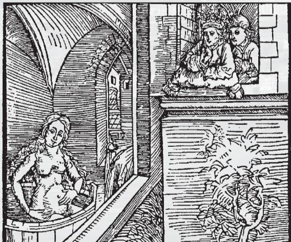
Očista tela v kúpeľi neraz neušla pozornosti neželaných divákov, ako to dosvedčuje aj súveky stredoveký drevoryt.