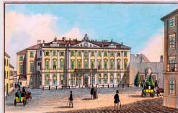
Primaciálne námestie s palácom na kolorovanom lepte Vincenta Reima z polovice 19. storočia.

Uhorský kráľ a neskôr aj rímsko-nemecký cisár Žigmund Luxemburský (žil v rokoch 1368 – 1437) sa vyznačoval nesmiernou chuťou do jedla. Hraničila priam s obzerstvom. V Archíve mesta Bratislavy sa zachovalo viacero dobových správ a dokumentov, potvrdzujúcich túto jeho vášeň. Roku 1410 na stretnutí Žigmunda s rakúskym vojvodom Ernestom v Bratislave len im dvom priniesli na stôl 1 teľa, 2 ovce, 4 prasce, 28 kureniec, 17 káhov, 1 kapúna a 200 vajčiek. Pochopiteľne, pekne a chutne upravených. V iný pôstny deň zasa Žigmundov jedálny lístok pozostával popri množstve nakladaných a solených rýb aj zo stovák haringov a 4-tisíc rakov. O tom, či toto „pôstne sústo“ stihol skonzumovať, pramene už nehovorí.