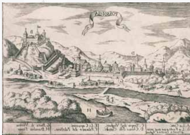
Veduta po zrkadlovom otočení podáva správny pohľad na Prešporok.

nievajú nielen veže kostolov a radnice, ale aj kamenné domy mešťanov, ktoré kontrastujú s prízemnými domcami na predmestiach. Architektúra kostolov i mestských domov je skôr schematická než realistická. Vo vnútornom meste sú označené iba dva objekty, a to Dóm svätého Martina (C), ktorý sa v legende – nevedno prečo – označuje ako uhorský kostol, druhým je františkánsky kostol (D), ktorý sa zasa taktiež dosť nezvyčajne identifikuje ako katolícky kostol.