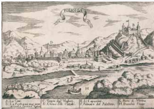
Veduta Prešporoka okolo roku 1690. V legende sú po taliansky označené tieto objekty: A – mesto, B – pevnosť, kde sa stráži uhorská (kráľovská) koruna, C – uhorský kostol, D – katolícky kostol, E – kapucíni, F – palatínsky palác, G – Viedenská brána, H – rieka Dunaj.

Druhá osobitosť veduty spočíva v tom, že v legende pod obrázkom, kde sa popisujú jednotlivé objekty, je viacero nesprávnych údajov. A tak, hoci samotné zobrazenie panorámy a topografie mesta i hradu (po zrkadlovom obrátení) zhruba zodpovedá vtedajšej skutočnosti, je takmer isté, že autor veduty v Prešporoku nikdy nebol a rytinu vyhotovil na základe dákej predchádzajúcej predlohy. Takéto prípady v zobrazovaní miest neboli