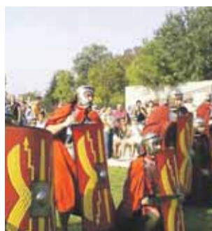
šiu predstavu, ako vyzeral svet

Osvedčenú klasiku obohacuje Múzeum mesta Bratislavy (MMB) o novinky – virtuálne poznávanie histórie pomocou interaktívnych zariadení. MMB verí, že si návštevníci si vytvoria kvalitnej-