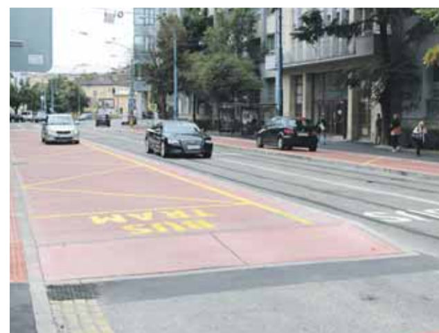
Zdá sa, že niektorí vodiči si na nový spôsob prechádzania týmto úsekom musia zvyknúť.