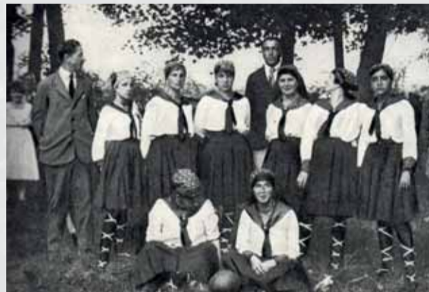
Hádzanárky I. ČsŠK Bratislava v roku 1921.

Predstavitelia Československého zväzu hádzanej a ženských športov, ktorí sa uzniesli v marci 1921 zriadiť na Slovensku tri župy – Západoslovenskú, Stredoslovenskú a Východoslovenskú, podporovali pôsobenie vyspelých tímov z Čiech a Moravy u nás. Hráčky I. ČsŠK Bratislava získali takto možnosť konfrontovať si sily so súperkami z Achilles Brno.