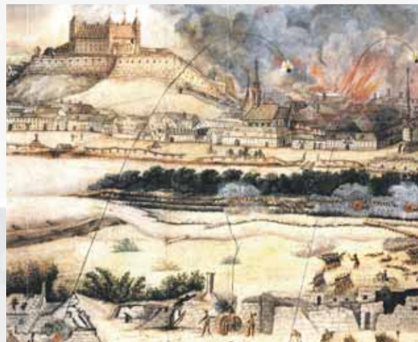
Bombardovanie Prešporoka francúzskym vojskom v júni 1809 na malbe neznámeho francúzskeho autora.

Po prehratej bitke pri Wagrame (5. – 6. júla) sa vlastne skončil aj boj o Prešporok. Dňa 13. júla 1809 prišiel do Prešporoka francúzsky kuriér, ktorý odovzdal generálovi Bianchi mu správu o uzavretí prímeria. Podľa podmienok prímeria po-