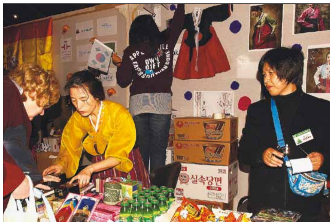
Ďaleký východ bol zastúpený kórejskými špecialitami.