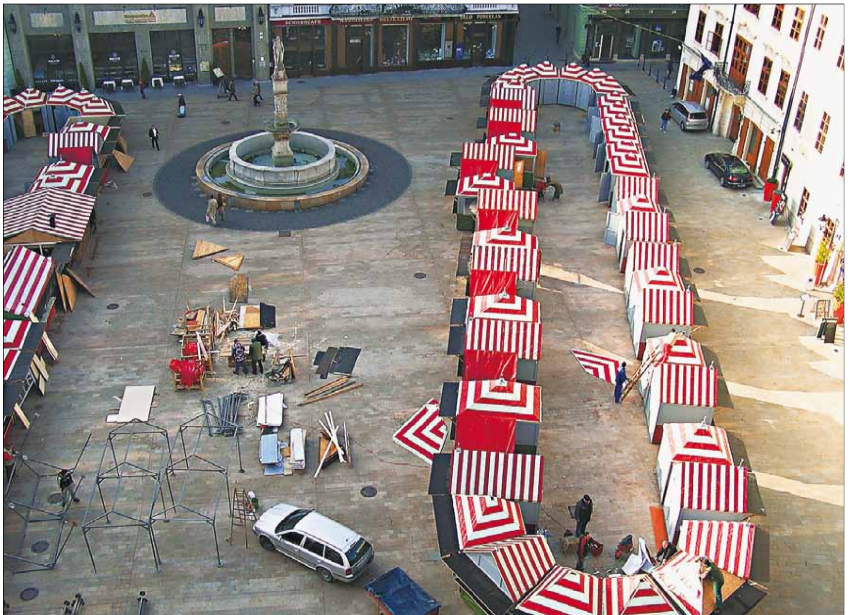
Novodobé vianočné trhy sa konajú na Hlavnom námestí od roku 1993. V roku 2003 sa rozšírili aj na Františkánske námestie.