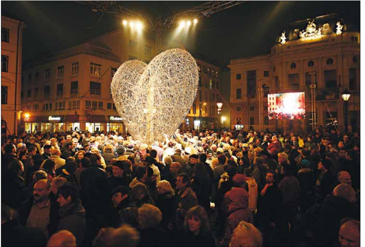
Srdce Európy je zhotovené z drôtu z kedysi najstráženejšej štátnej hranice.