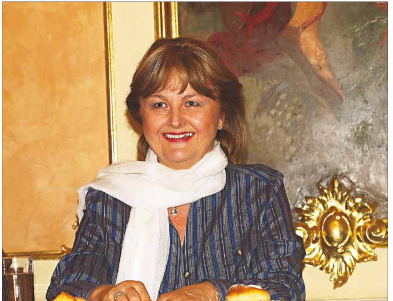
Edita Gruberova vystúpila v SND po 41 rokoch.

Vyrastala v Rači, a tak nás zaujímal, ako si spomína na detské a dievčenské roky. „To je už dávno, dnes to všetko vnímam inak. Ale detstvo je vždy krásne dobrodružstvo, hľadanie, poznávanie. Už od dvanástich rokov som sa však naplno venovala hudbe. Precitovala ju, hudba ma fascinovala, unášala do sveta tajomna a fantázie. Účinkovala som v detskom zbore, neskôr v Lúčnici. To boli roky, ktoré boli naozaj výnimočné, tak ako