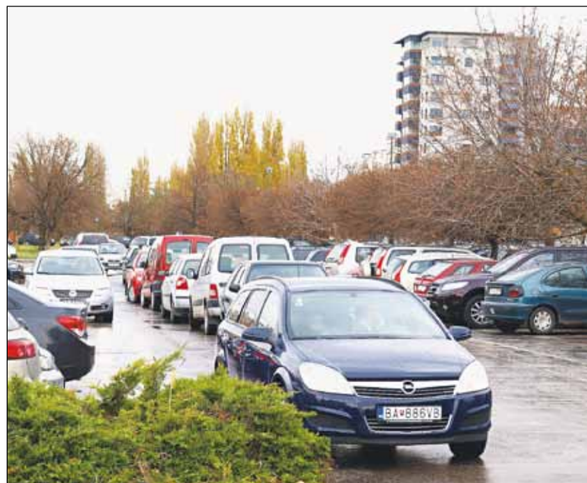
V Ružinove zaberajú parkovacie plochy hlavne zamestnanci okolitých firiem.