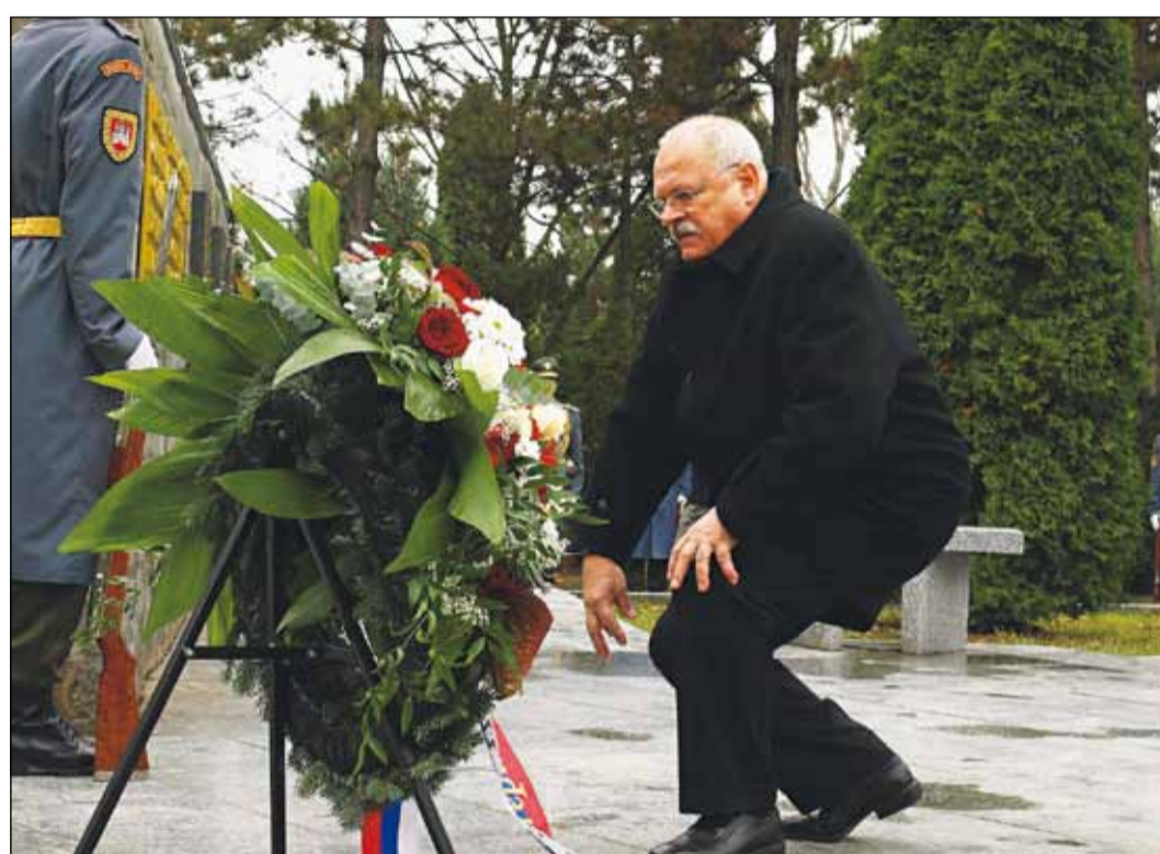
V rámci pietnej spomienky pri pamätníku popravených a umučených politických väzňov komunizmu na Ružinovskom cintoríne vzdal obetiam svoju poctu aj prezident SR Ivan Gašparovič.