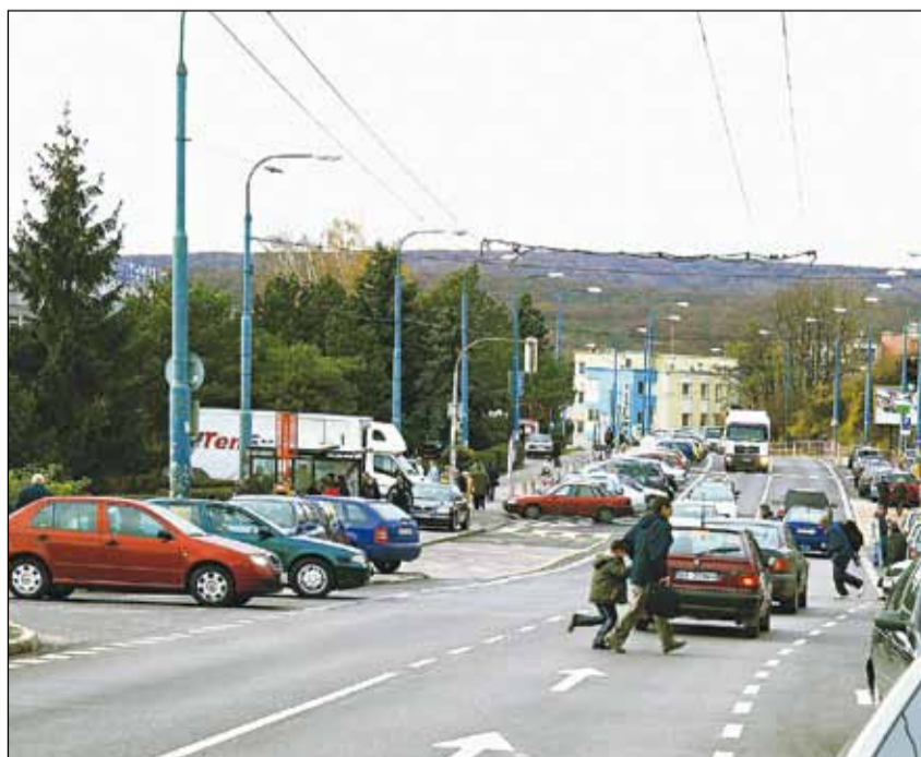
Na Kramároch je prebiehanie pacientov k svojim vozidlám bežnou praxou.