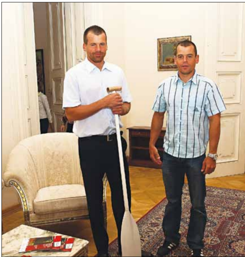
Bratislavčania a olympijskí víťazi bratia Hochschornerovci 4. decembra odovzdajú „zlaté“ pádlo šťastnému dražiteľovi.