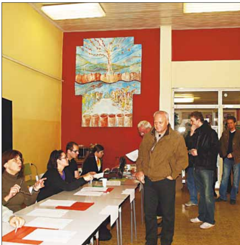
V prvom kole bola volebná účasť v Bratislavskom kraji 19,46 %.

Zvyšných trinásť pozícií - namiesto terajších päťdesiatich bude v novom parlamente zasadať 44 poslancov - obsadia víťazi zo zvyšných desiatich obvodov na území regiónu, spadajúcich pod okresy Senec, Pezinok a Malacky.