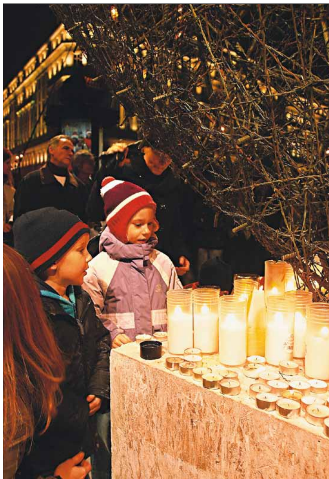
Drôtené Srdce Európy prilákalo zapáliť sviečku aj tých, ktorí o minulom režime počúvajú iba od svojich rodičov alebo z médií.