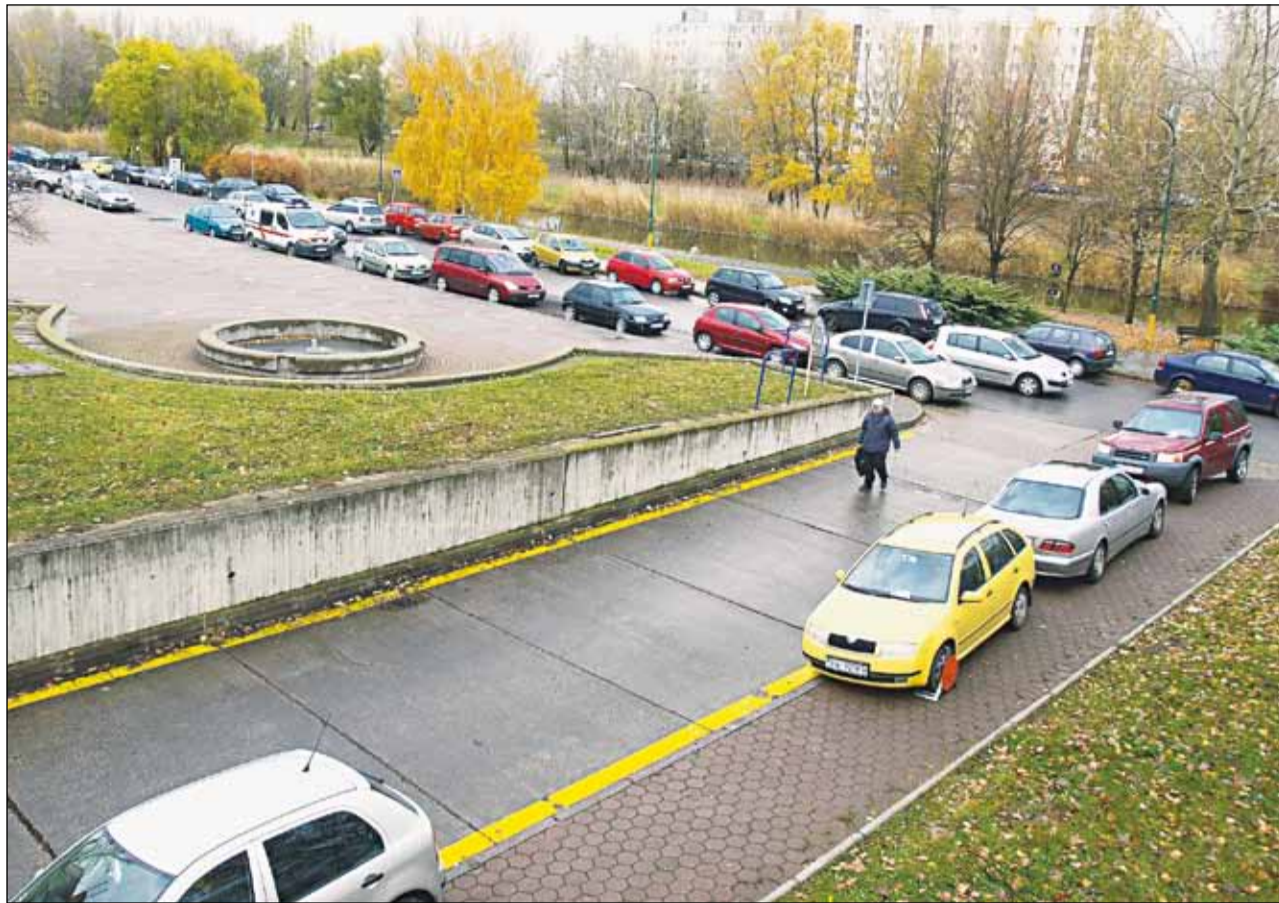
Nič iné ako riskovať papuču návštevníkom „Antolskej“ neostáva.

Ani mesto nemá príliš veľa možností. Parkovanie v okolí akejkoľvek budovy – teda aj nemoc-