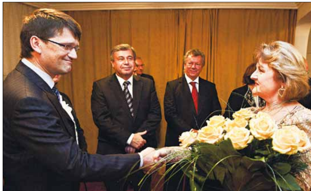
Obdiv a uznanie prišli opernej dive prejavit' osobne aj minister kultúry Marek Maďarič a minister školstva Ján Míkolaj.