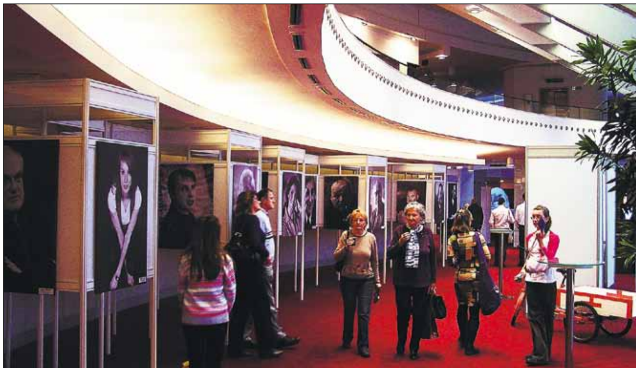
Deň otvorených dverí prilákal no novej budovy SND aj v sychravom počasí tisíce návštevníkov.

Minulý rok sa prišlo do novej budovy SND na Deň otvorených dverí pozrieť približne štyritisíc návštevníkov. I tento rok sa národné divadlo rozhodlo otvoriť svoje brány pre všetkých zvedavcov. Tohtoročné podujatie sa uskutočnilo v nedeľu