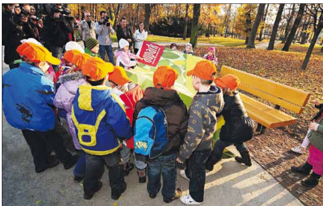
Na dvanásť nových lavičiek, tri nové smetné koše a štýlovú zámkovú dlažbu narazia tí, ktorí si vyrazia do Sadu Janka Kráľa. Minulý týždeň ich slávnostne odhalili tí najmenší.