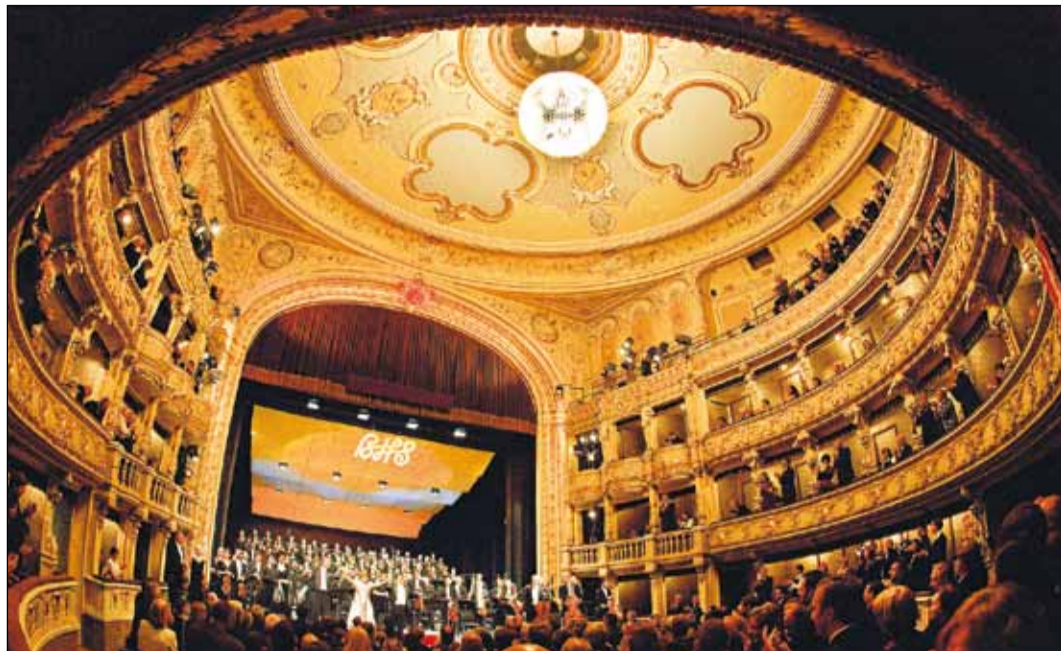
Hviezdou otváracieho koncertu tohtoročných Bratislavských hudobných slávností bola bratislavská rodáčka a svetoznáma sopranistka Edita Gruberová.