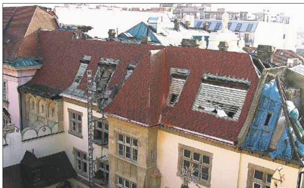
Rekonštrukcia Starej radnice je naplánovaná na viacero etáp. Minulý týždeň sme zachytili reštaurátorov na skutočne strmých strechách tejto budovy. Predpokladaný termín jej ukončenia je leto 2010.