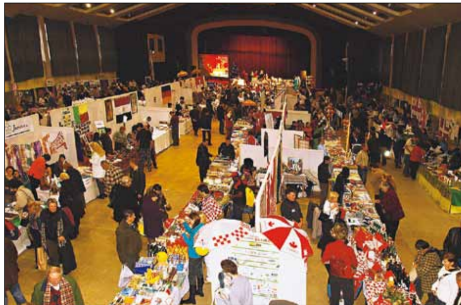
Viac záberov z tohtoročného Vianočného bazáru nájdete na strane 17.