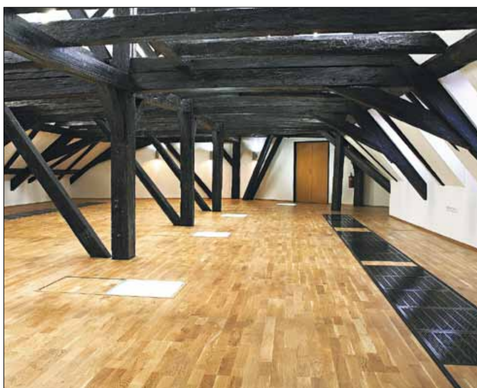
Výhľad na Bratislavu zo strešných okien odporúča aj sám primátor Bratislavy.