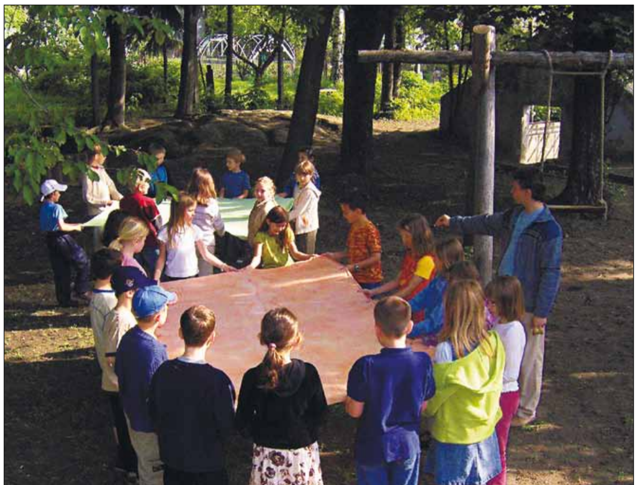
Prvá škola waldorfského typu na Slovensku vznikla v Bratislave v júli 2001.

Negatívne názory odborníkov výdatne podporené príbehmi niekoľkých mamičiek, ktoré svoje deti z waldorfskej školy odvieďli, však vyvolali sériu