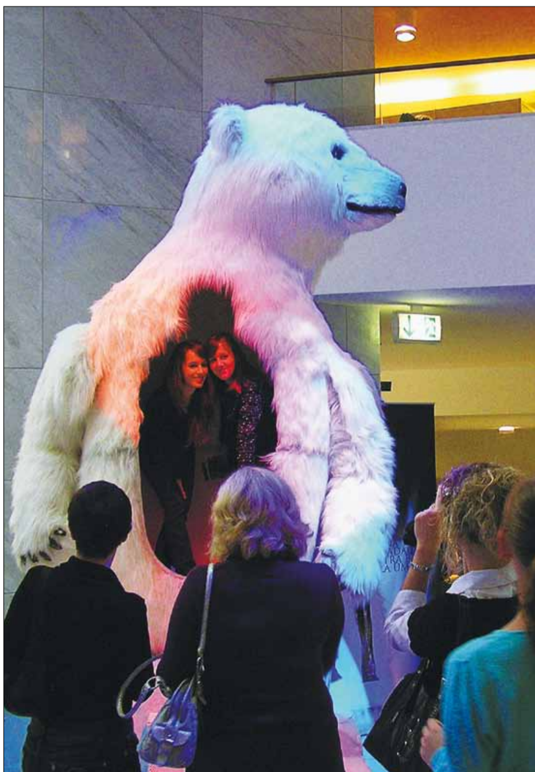
Návštevníci Dňa otvorených dverí v SND si prišli každý na svoje. Organizátori pripravili skutočne pestrý a kvalitný program.