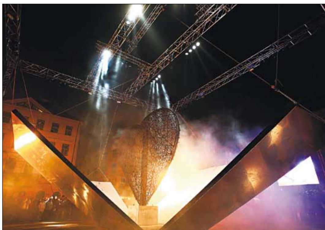
Veľkolepé odhalenie drôteného Srdca Európy nám počas 20. výročia Nežnej revolúcie pripomenulo na Hviezdoslavovom námestí aspoň na chvíľu časy, kedy sme bojovali o lepší zajtrajšok.