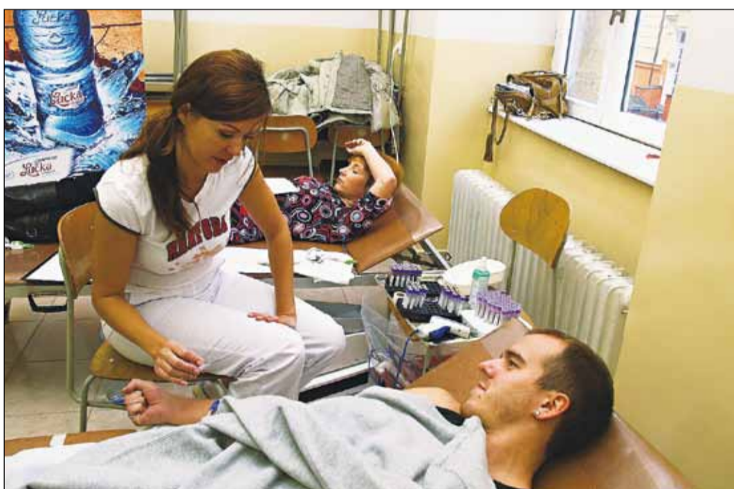
V uplynulých dňoch skončil 15. ročník Študentskej kvapky krvi, ktorá sa niesla pod sloganom „Daruj ju aj ty“.