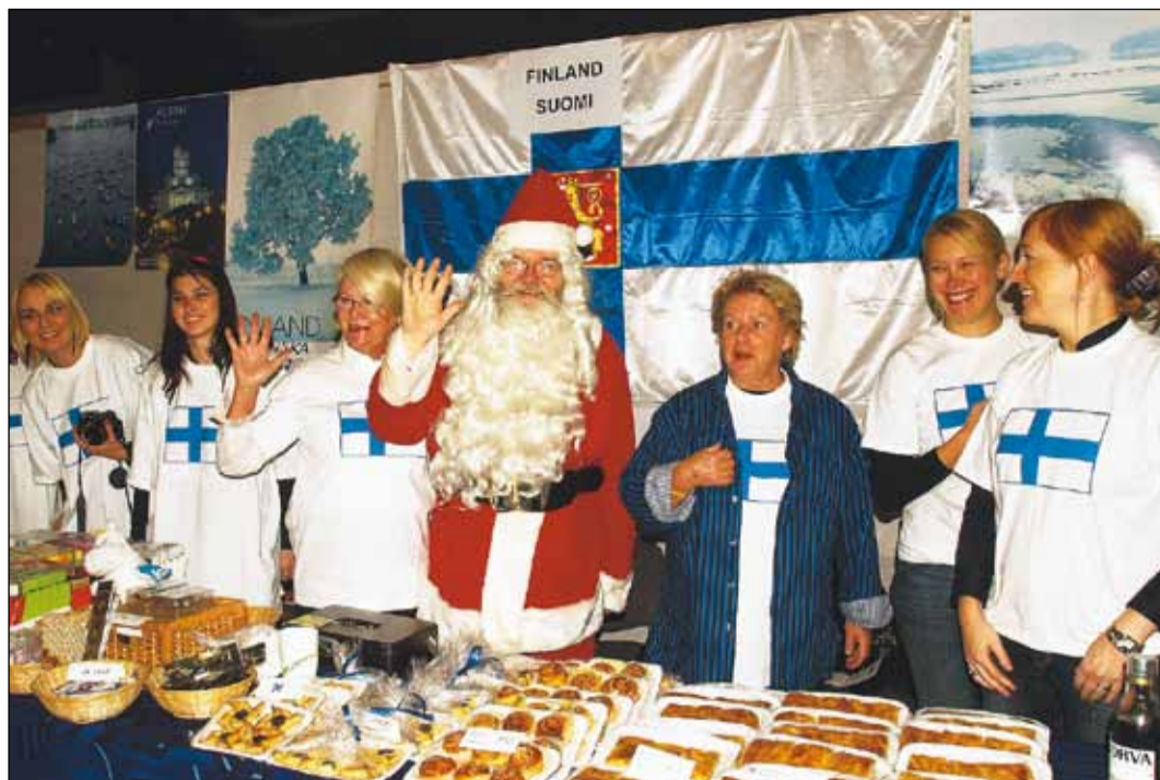
Fínsko pútal návštevníkov aj s pravým Santa Clausom.