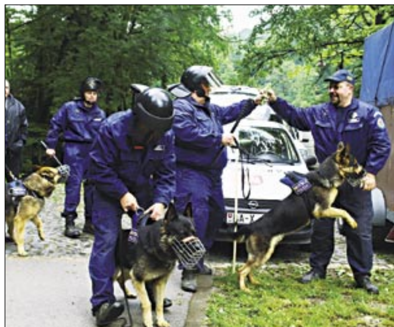
Hliadky služobnej kynológie sa v lete veľmi osvedčili