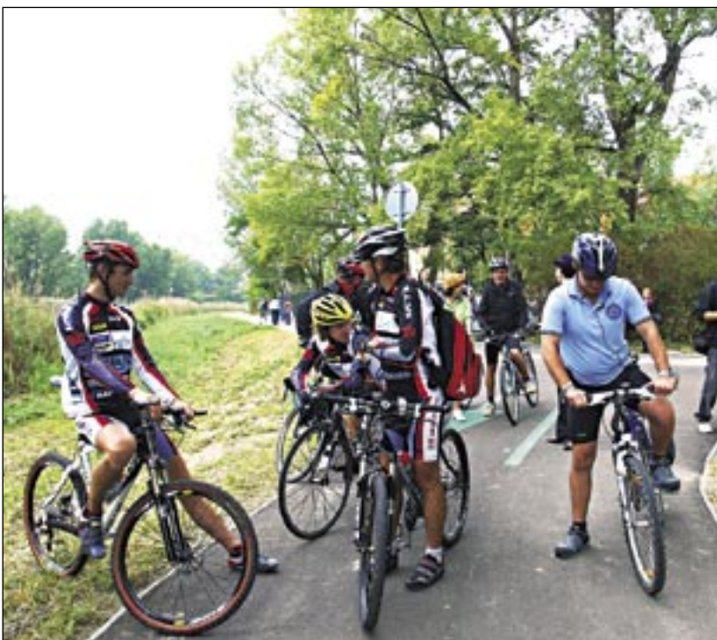
Cyklistický chodník Antolská - Chorvátske rameno počas jeho otvorenia

Veronika Ševčíková