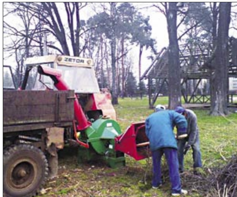
Mestská časť Staré Mesto ponúka obyvateľom štiepkovanie už tretí rok