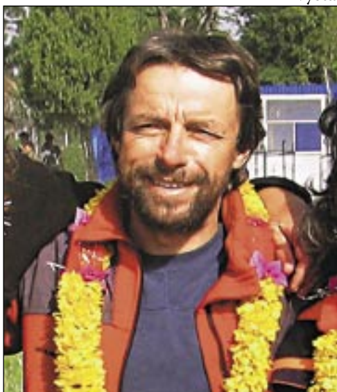
Pražský primátor Pavel Bém na jednej zo svojich expedícií

Pražský primátor Pavel Bém navštívil nedávno historické centrum Bratislavy, aby sa mohol osobne stretnúť s dalajlámom a byť pri otvorení výstavy Magické Himaláje. Priamo na