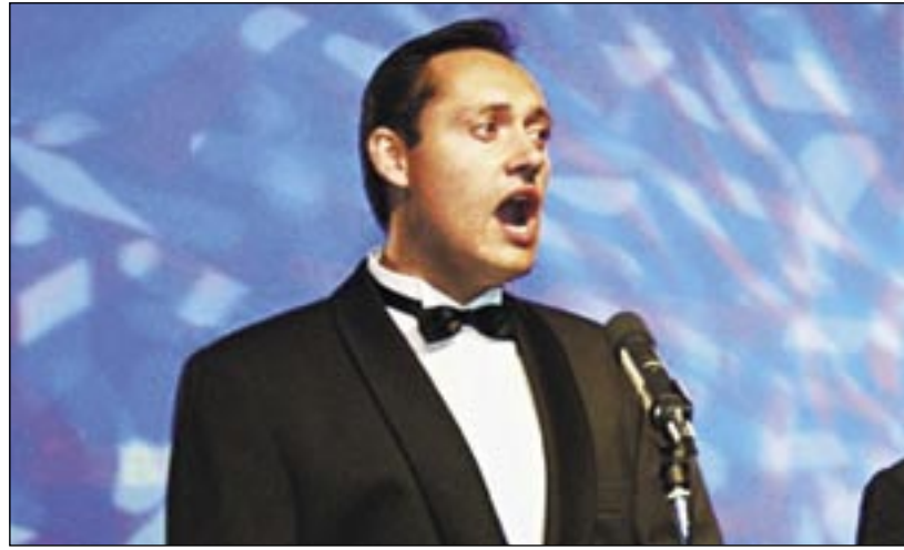
Domovom Otokara Kleina sú svetoznáme operné pódia