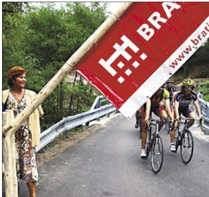
Cyklistický chodník v Krasňanoch spája Raču so Železnou studienkou

Mestské lesy si na zrealizovanie prác požičali peniaze od mesta. Po ukončení rekonštrukcie môžu náklady vyčíslit a následne im budú preplatené z Európskeho pôdohospodárskeho fondu pre rozvoj vidieka z programu na rozvoj vidieka. Tak budú môcť mestu vrátiť požičaných 382 027 €.