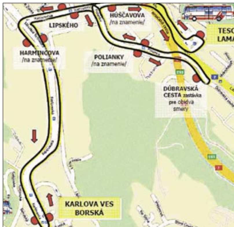
Trasa novej linky číslo 36