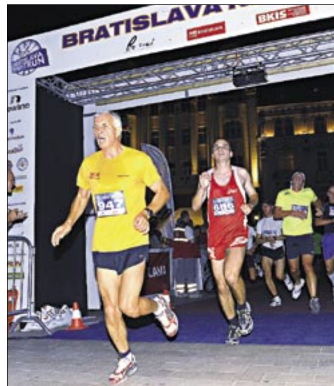
Na štart prvého ročníka sa postavilo vyše 850 bežcov