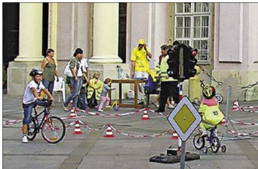
Nádvorie Starej radnice patrilo počas týždňa mobility malým šoférom