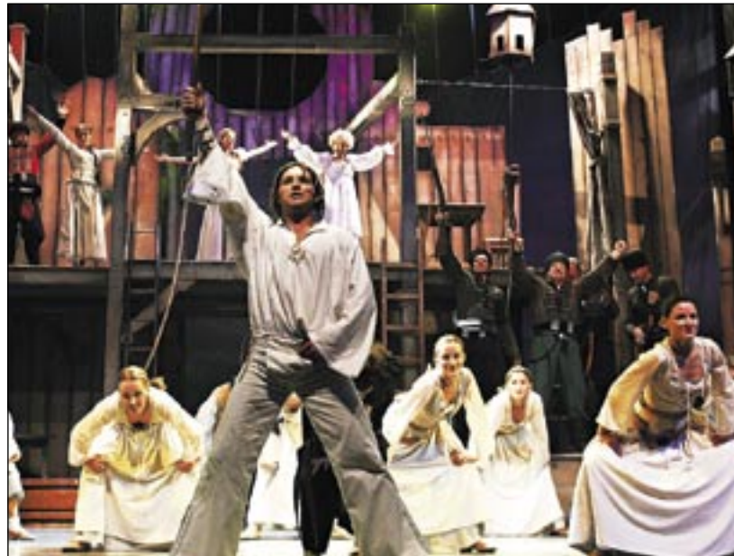
Derniéra Na skle maľované je naplánovaná na Silvestra