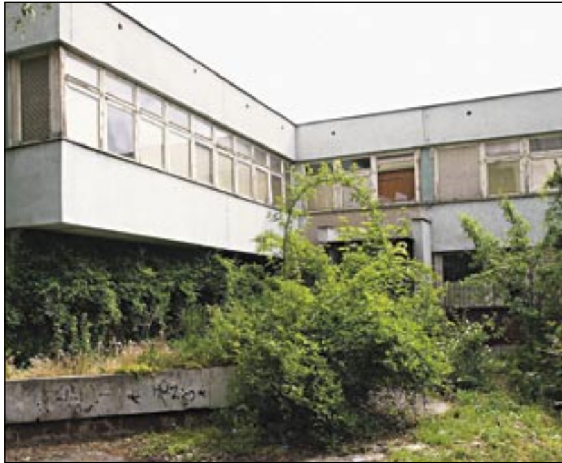
Chátrajúca budova bývalej MŠ na Budatínskej ulici

Hlasovanie - PRÍTOMNÝCH: 62 poslancov, ZA: 62, PROTI: 0, ZDRŽAL SA: 0.