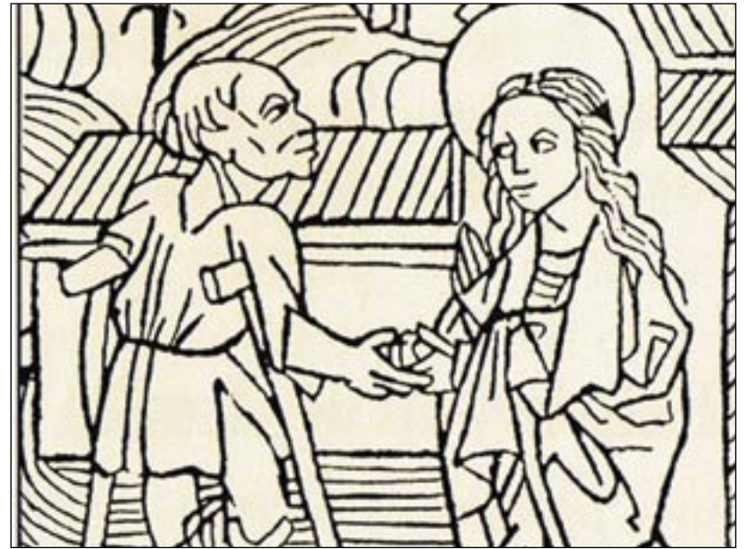
Mrzák s barlami na stredovekom obrázku nápadne pripomína jarmočného zlodeja Stutfaula z najstaršieho prešporského zatykača.