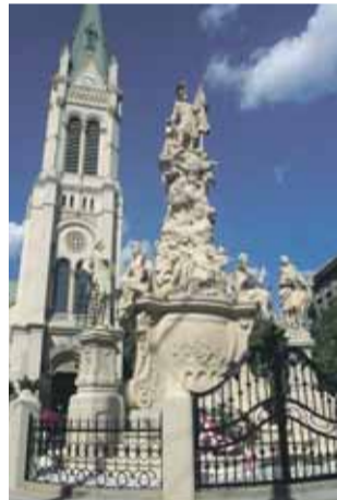
Ešte v novembri mesto predpokladalo dokončenie reštau-

V Bratislave odhalili zreštaurované Súsošie sv. Floriána. Barokový stĺp obeliskového typu z roku 1732 s prestávkami rekonštruovali od roku 2005. Vtedy boli na ňom boli vykonané mimoriadne záchranné opatrenia, ktoré mali injektážami dočasne stabilizovať hmotu súsošia. Práca však riešili len havarijný stav a tak sa v roku 2007 začalo s celkovou rekonštrukciou. Tá však v roku 2009 skončila pre nedostatok financií. Súsošie začali znovu rekonštruovať až na základe uznesenia mestského zastupiteľstva z júna minulého roka.