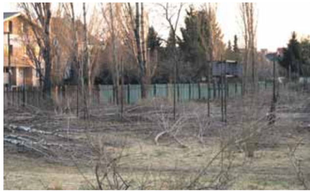
Situácia po výrube na ZŠ Vietnamská.

V poslednom období sme do redakcie dostali viacero podnetov od občanov, v ktorých sa sťažujú na to, že v meste miznú stromy na základe problémových výrubov. Dva prípady uvádzame v nasledujúcom článku.