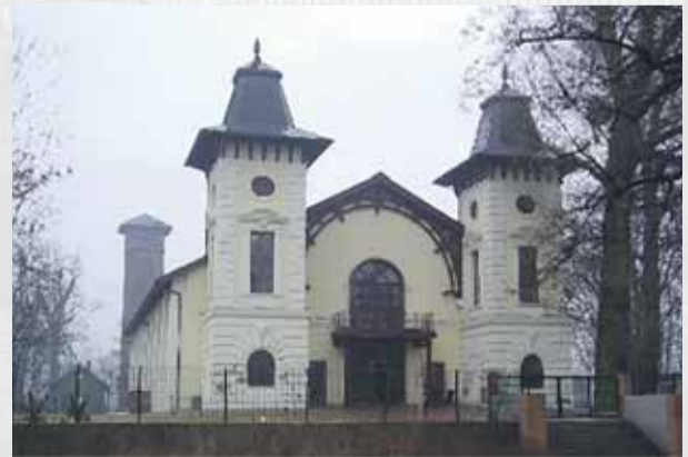
Divadlo Aréna v Petržalke.

tu účinkovalo viacero maďarských, rakúskych a nemeckých divadelných spoločností. Po druhej svetovej vojne a pripojení Petržalky k Bratislave roku 1946 bola budova divadla pre verejnosť zatvorená na takmer 50 rokov. Dlhý čas slúžila ako sklad Československej televízie. V roku 1994 bola na podnet renomovaného slovenského múma Milana Sládeka založená nadácia za obnovenie Divadla Aréna a v nasledujúcom roku sa začalo s rekonštrukciou. Prvou premiérou v zrekonštruovanom divadle bolo predstavenie Grand Pierot. V rokoch 1996 až 2002 sa v Aréne konal medzinárodný pantomimic-