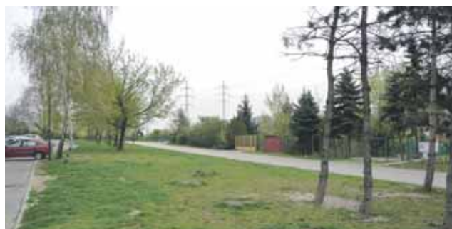
Prúky vyrúbaných stromov v Dúbravke ktosi zamaskoval.

súhlas, alebo nesúhlas s výrubom a s uloženou náhradnou výsadbou. „Ale samotné rozhodnutie vydáva mestská časť“, dodala Šimončíčová.