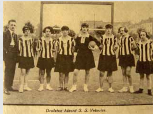
Česká hádzaná sa k nám dostala z Prahy.

V 20. rokoch 20. storočia sa tak česká hádzaná hrávala aj vtedajšej Juhoslávii, Poľsku, na Ukrajinu a postupne vo Francúzsku, Švajčiarsku, Nemecku, Rakúsku, ba záujem prejavili o niečo neskôr aj Angličania. Potvrďuje to aj účasť reprezentantiek ČSR,