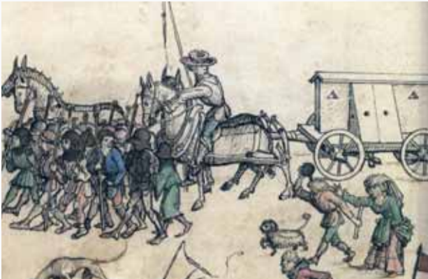
Stredovekí žoldnieri s povozom na vojnovnej výprave v súvekom rakúskom rukopise.