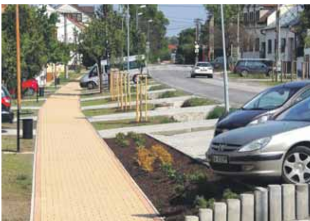
Súčasný stav je terčom protestov skupiny obyvateľov.

pertíznemu skúmaniu,“ dodal hovorca KR PZ.