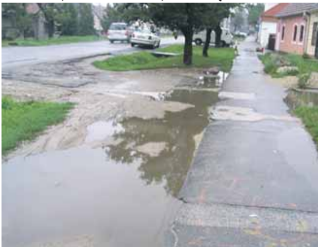
Niekdajšia podoba Istrijskej ulice.

„Na základe výzvy vyšetrovateľa PZ došlo k dobrovoľnému vydaniu viacerých kusov strelných zbraní, ktoré boli následne podrobené ex-