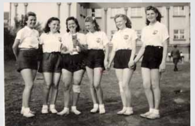
Družstvo volejbalistiek dievčenského gymnázia na dvore reálneho gymnázia na Dunajskej ulici v roku 1943.

V zmenených spoločensko-politických pomeroch po roku 1938 a v dôsledku rozpustenia všetkých telovýchovných organizácií na Slovensku sa ani volejbalové dianie nevyhlo zmenám. Organizačne ho riadil Slovenský basketbalový a volejbalový zväz so sídlom v Bratislave, ktorý vydal v roku 1940 prvé volejbalové pravidlá v slovenčine. Účinným a pragmatickým riešením sa stala „zväzová odluka“ basketbalu od volejbalu a ich osamostatnenie sa v roku 1942, čo nesporne obom športom prospelo. Novovytvorený Slovenský volejbalový zväz evidoval šestnásť mužských