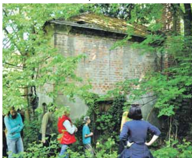
V zozname osobitého majetku je aj Prúgerka-Staromestská záhrada.

Nariadenie definuje tzv. „rodinné striebro“ Starého Mesta, respektíve osobitý majetok - nehnuteľnosti, ktoré majú svoj historický význam, dôležitosť a sú úzko späté s mestskou časťou Staré Mesto, so Staromešťanmi, mali by ostať zachované aj pre budúce generácie a zaslúžia si zvýšenú ochranu. V niektorých prípadoch sú priam symbolom mestskej časti, ako napríklad