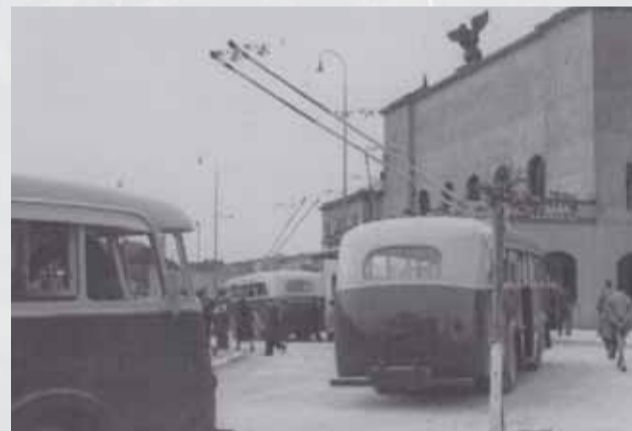
Trolejbus linky M pred Hlavnou stanicou v lete 1941.

v Bratislave dve etapy. Prvá etapa tejto v danej dobe modernej dopravy trvala v rokoch 1909 – 1915, keď trolejbusy premávali z centra mesta na Železnú studničku. Trvalo viac než štvrtstoročie, keď sa trolejbusy opäť vrátili do bratislavských ulíc. Prvá linka s označením M, vedúca z Hlavnej stanice cez Vály a Račianske mýto, Legionársku, Karadžičovu a Grösslingovu ulicu k Redute, začala pravidelnú premávku 1. augusta 1941.