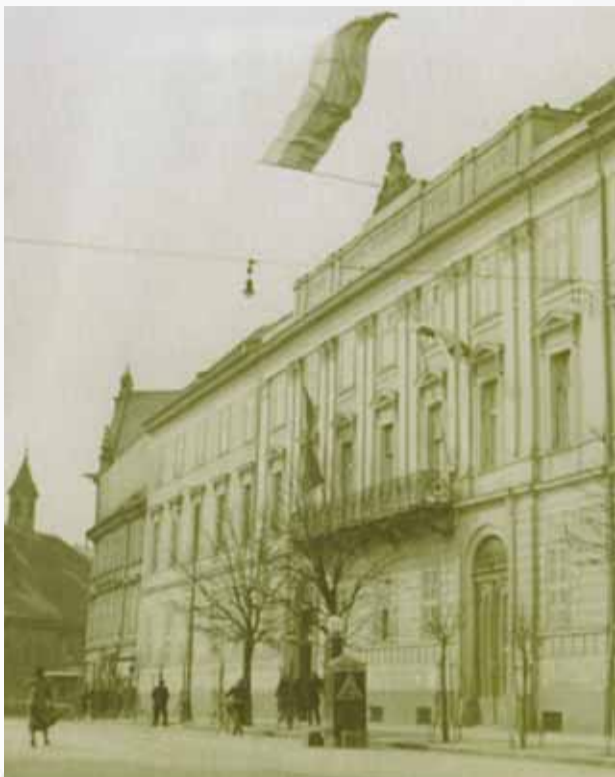
Sídlo Snemu Slovenskej krajiny na Župnom námestí, kde bol 14. marca 1939, tesne po 12 hodine vyhlásený nezávislý Slovenský štát.