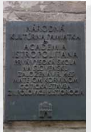
Pamätná tabuľa na dome, kde sídlila Univerzita Istropolitana.