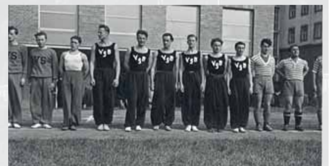
Volejbalisti VŠ Bratislava na Lafranconi roku 1938.

Škoda, že nezičlivý žreb postavil proti sebe práve oboch bratislavských zástupcov a skomplikoval im tak šance na lepšie umiestnenie. Štvrté miesto YMCA Brati-