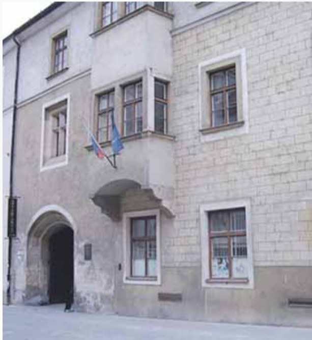
Budova na dnešnej Ventúrskej ulici, kde sídlila Univerzita Istropolitana.