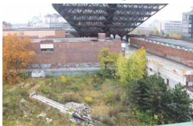
Súčasný stav parku Belopotockého by mal byť čoskoro minulosťou.

„Boj za záchranu parku Belopotockého trval neuveriteľných 18 rokov a za záchranu parku sa postavilo v petícii vyše 7000 občanov. Vďaka zámene pozemkov sa podarilo napraviť chyby bývalého vede-