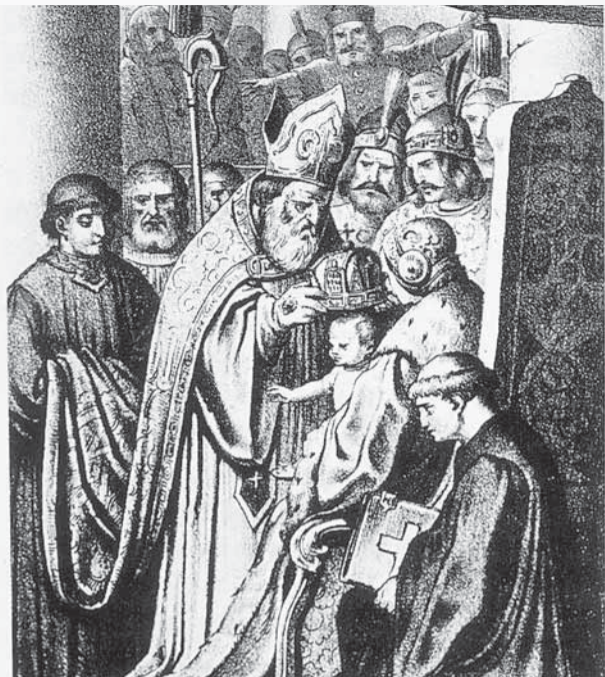
Koronácia Ladislava V. Pohrobka na romantizujúcej kresbe.