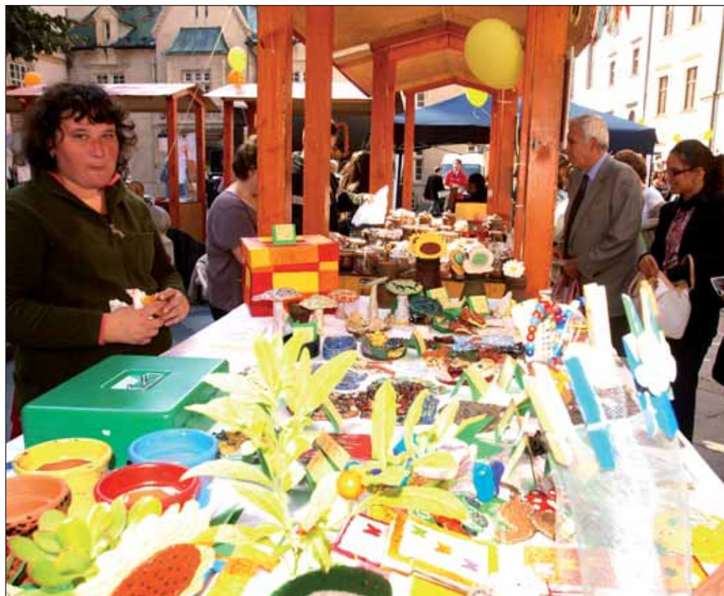
Radničkine trhy na ponúkali minulý týždeň na Primaciálnom námestí rôzne drobnosti a doplnky. V rámci už 10. ročníka ponúkali originálne a ručne vyrobené diela šikovných remeselníkov.