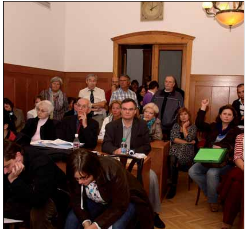
Medzi nespokojnými obyvateľmi sa objavila aj exministerka Viera Tomanová.