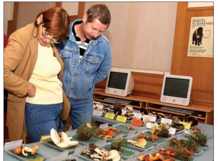
Viac ako tristo druhov húb si pozreli tí, ktorí sa zastavili na tohtoročnej výstave Huby v Prírodovednom múzeu na Vajanského nábreží. Dosť veľa z nich sa zastavilo pri muchotrávkach, tá zelená totiž na Slovensku spôsobuje najviac smrteľných otráv.

„Otravy, keď je niekomu zle od žalúdka, sa objavujú každý deň, najčastejšou príčinou tých smrteľných je muchotrávka zelená,“ informuje Kautmanová. Asi preto, že býva pekná, vyzerá lákavo a svojím vzrastom a tvarom pripomína bedľu, šampiňón, ale aj pečiariku. Spôsob, akým odhaliť jedovatú hubu, NEEXISTUJE. Neplatí, že