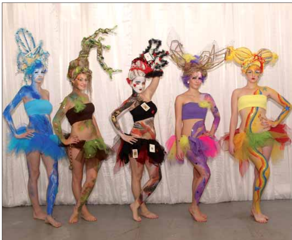
Počas troch dní jesenného veľtrhu Interbeauty sa v Inchebe predstavili prevratné kozmetické novinky i súťaže a rôzne exhibície. Jednu z cien za avantgardu si odniesla Stredná umelecká škola scénického výtvarníctva na Sklenárovej ulici.