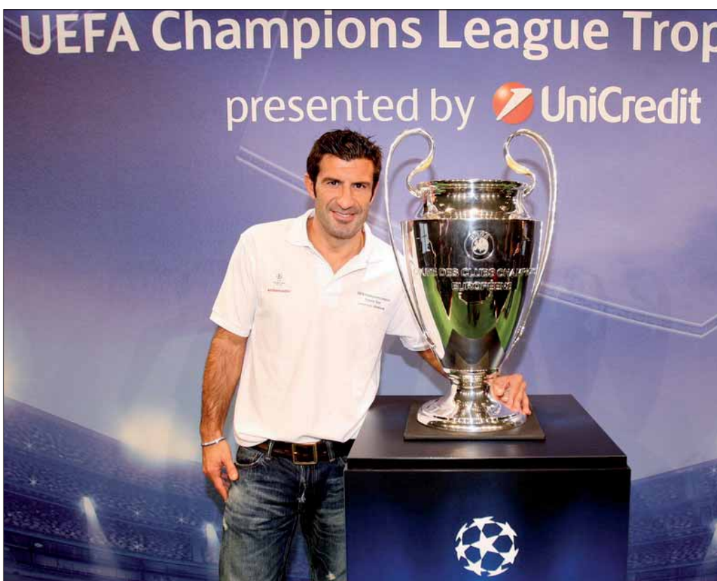
Aj Bratislavčania budú mať to šťastie pozrieť si zblízka legendárny pohár UEFA Champions League, ktorý získavajú víťazi Ligy majstrov - na námestí v areáli Eurovea Galleria sa zdrží od 8. do 10. októbra. Okrem pohára, po ktorom túžia pravdepodobne všetci futbalisti na svete, smeruje do Bratislavy aj portugalská hviezda Luis Figo.