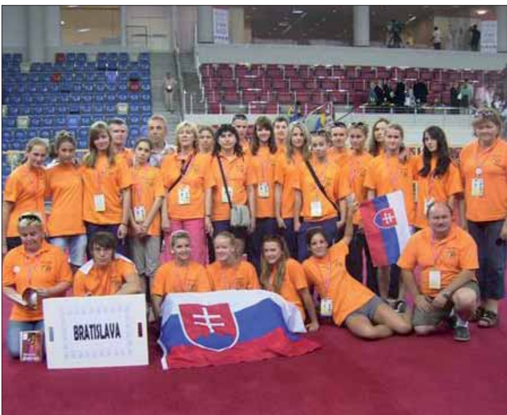
Slovenská výprava bratislavských žiakov sa na Medzinárodných hrách žiakov Bahrajne prezentovala aj napriek miestnym teplotám nad 45 stupňov skvelými výkonmi.