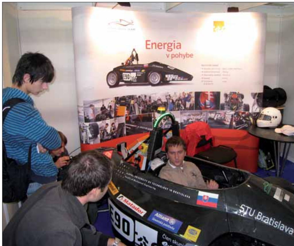
Súbežnou výstavou bolo minulý týždeň v Inchebe aj Elektro Expo, kde sa návštevníci mohli dozvedieť o novinkách v elektrotechnike, energetike, osvetlení a pod. Oživením bola aj prezentácia elektroformuly skonštruovanej študentami STU.