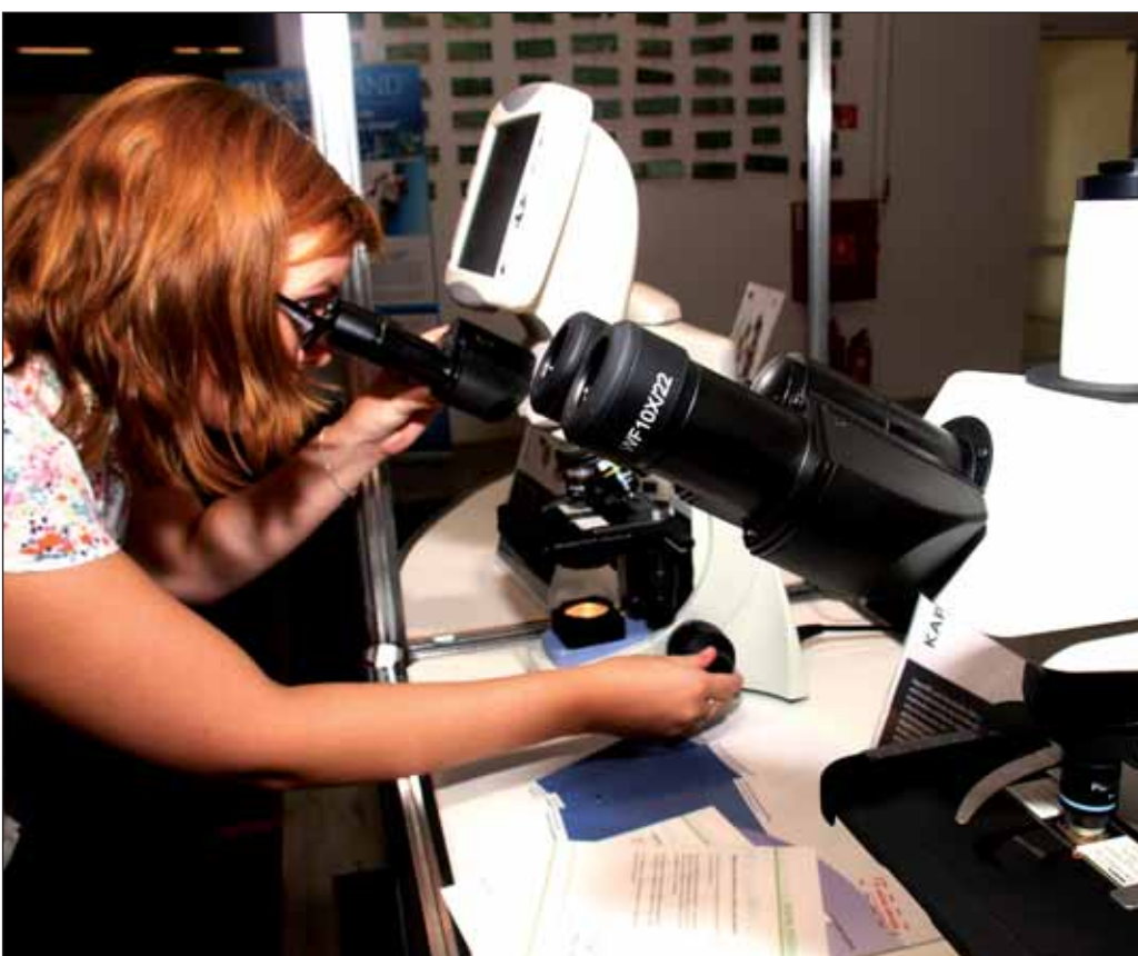
Vedci, výskumníci a zvedavci zažili dlhú septembrovú noc plnú bádania v Slovenskom národnom múzeu. Uskutočnila sa tam od rána až do polnoci celoslovenská Noc výskumníkov.