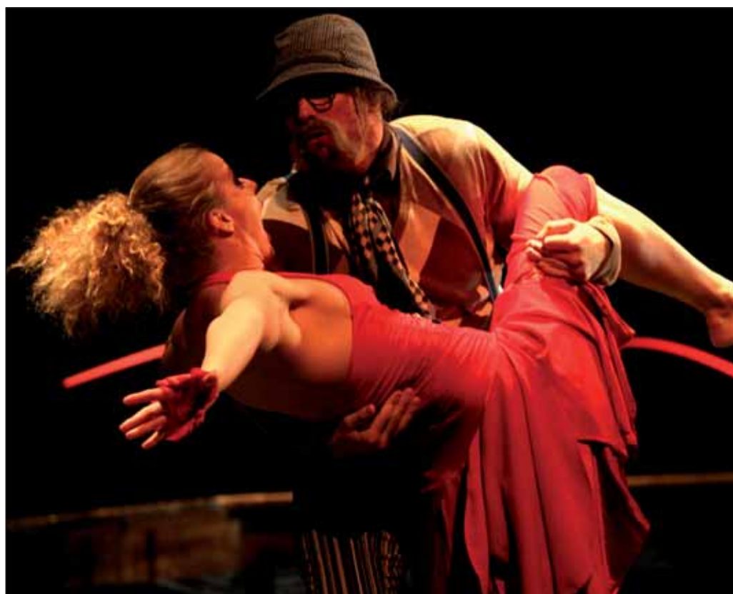
La Putyka mala obrovský úspech, diváci jej protagonistov nechceli pustiť z javiska. Neutíchajúcim potleskom odmenili nadšení diváci v Mestskom divadle Pavla Országha Hviezdoslava protagonistov predstavenia La Putyka, ktoré sa vlani v Česku stalo inscenáciou roku.