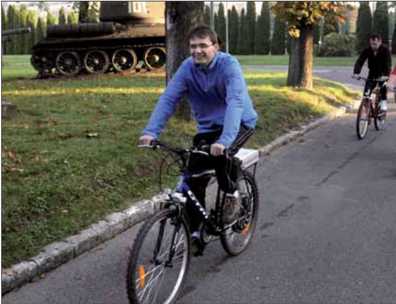
Minister obrany Lubomír Galko „osedlal“ zapožičaný elektrobicykel.

účastníci zaujímavých aktivít kritizovali organizátorov, že sa príliš sústredili na ponuku rôznych športových aktivít a opomenuli to podstatné – riešenie kritickéj dopravnej situácie, zaznamenali sme skôr priaznivé ohlasy.