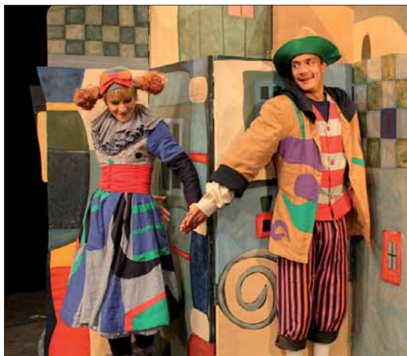
Kocúr v čižmách, prvé predstavenie sezóny 2010/2011 v Bratislavskom bábkovom divadle, rozosmeje podľa tvorcov nielen deti, ale aj ich dospelých sprievodcov. Je totiž plné rôznych slovných hračiek.

5. októbra o 9. a 11. h 9. októbra o 14.30 h 10. októbra o 10. a 14.30 h 12. októbra o 10. h