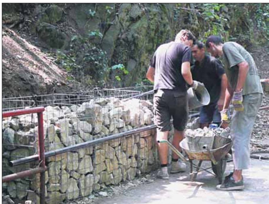
Po studničke sa opravy na Hlbokej ceste dočkal aj svah

Začiatkom roka 2008 na nej nezisková organizácia Národný trust obnovila studničku. Tá mala takmer rozpadnutú striešku, bola