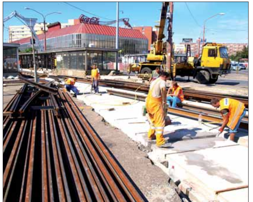
Križovatka na Trnavskom mýte prechádza zásadnou opravou.