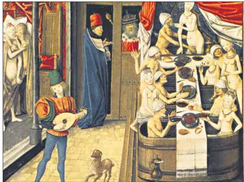
Kúpele boli miestom očisty i rozkoše ako vidno na knižnej malbe Antona Burgundského (okolo 1470).