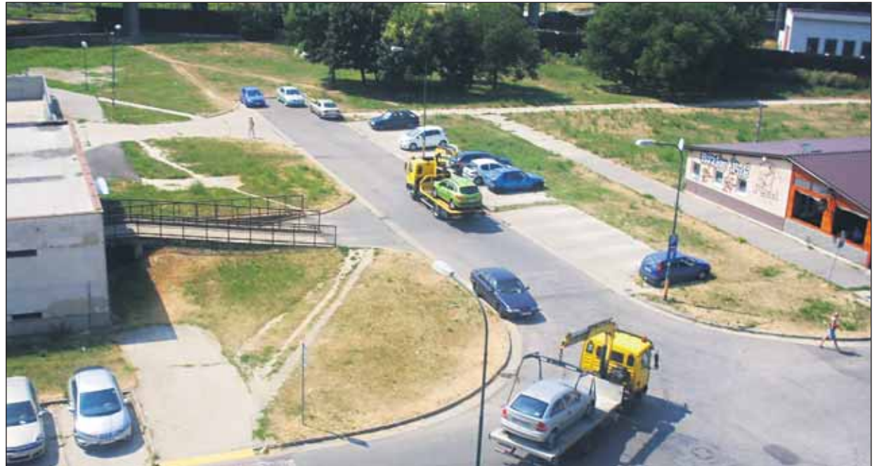
Proti odťahovaniu zle zaparkovaných áut na Macharovu ulicu v Petržalke, s ktorým spoločnosť Car Towing začala ešte koncom júla, sa miestni obyvatelia búria. Vytáča ich natoľko, že požadujú okamžité a definitívne vypovedanie nájomnej zmluvy a namiesto „odťahovky“ vybudovanie verejného parkoviska s osvetlením.

Napriek tomu, že na svojom poslednom stretnutí – začiatkom júla – sa petržalskí poslanci postavili proti spusteniu odťahovej služby na Macharovej ulici (nezískala potrebnú dvojtretinovú väčšinu ich hlasov), začala spoločnosť Car Towing ešte 19. v tom istom mesiaci s odťahovaním. Členov tamojšieho petičného výboru proti „odťahovke“ to vytočilo natoľko, že si už medzičasom verejne zaprotestovali a starostovi Petržalky Milanovi Ftáčnikovi poslali