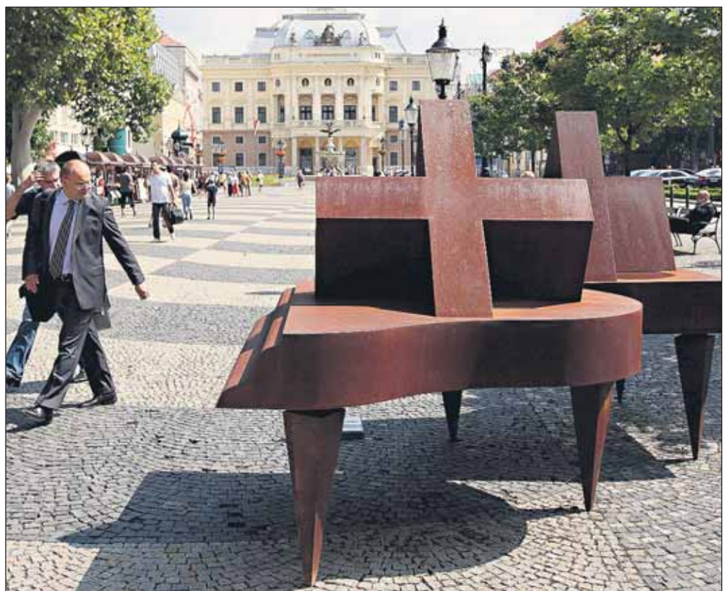
Aj na Hviezdoslavovom námestí narazíte na originálne umelecké diela, rozmiestnené po meste do 29. augusta v rámci projektu Socha a objekt XV . Tí, čo sú za ním, chcú dostať umenie bližšie k ľuďom. Aby si k nemu vytvorili vzťah, tento rok cez práce renomovaných tvorcov, ale aj úplných začiatočníkov z rôznych krajín.