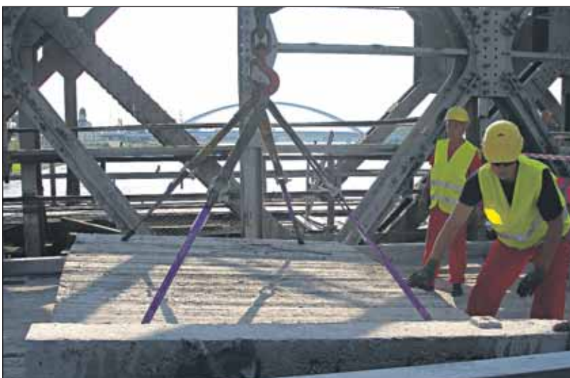
Tri tony váži jeden takýto panel, do odstránenia ktorých sa pred vyše týždňom na cestnej časti Starého mosta pustila spoločnosť METRO Bratislava.