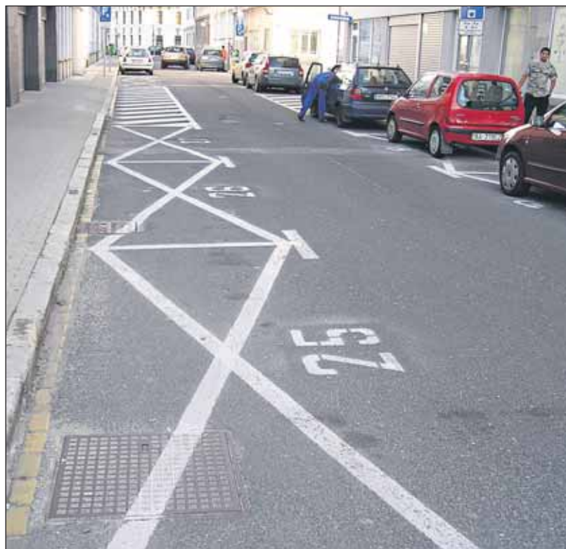
Obyvatelia Bratislavy budú hľadať miesto na parkovanie oveľa ťažšie.