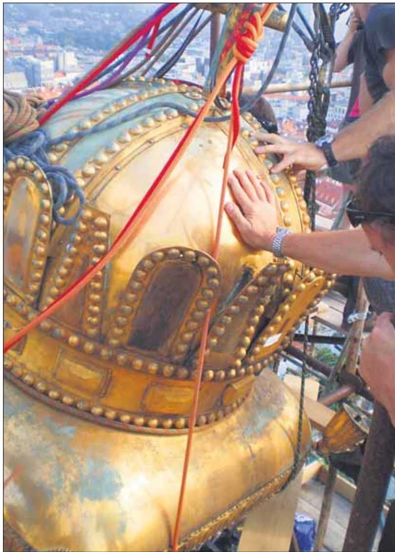
Hmotnosť podušky aj s korunou je 150 kg.

Aj cena za toto dielo je dlhá – má totiž sedem cifier - 1 001 500 €