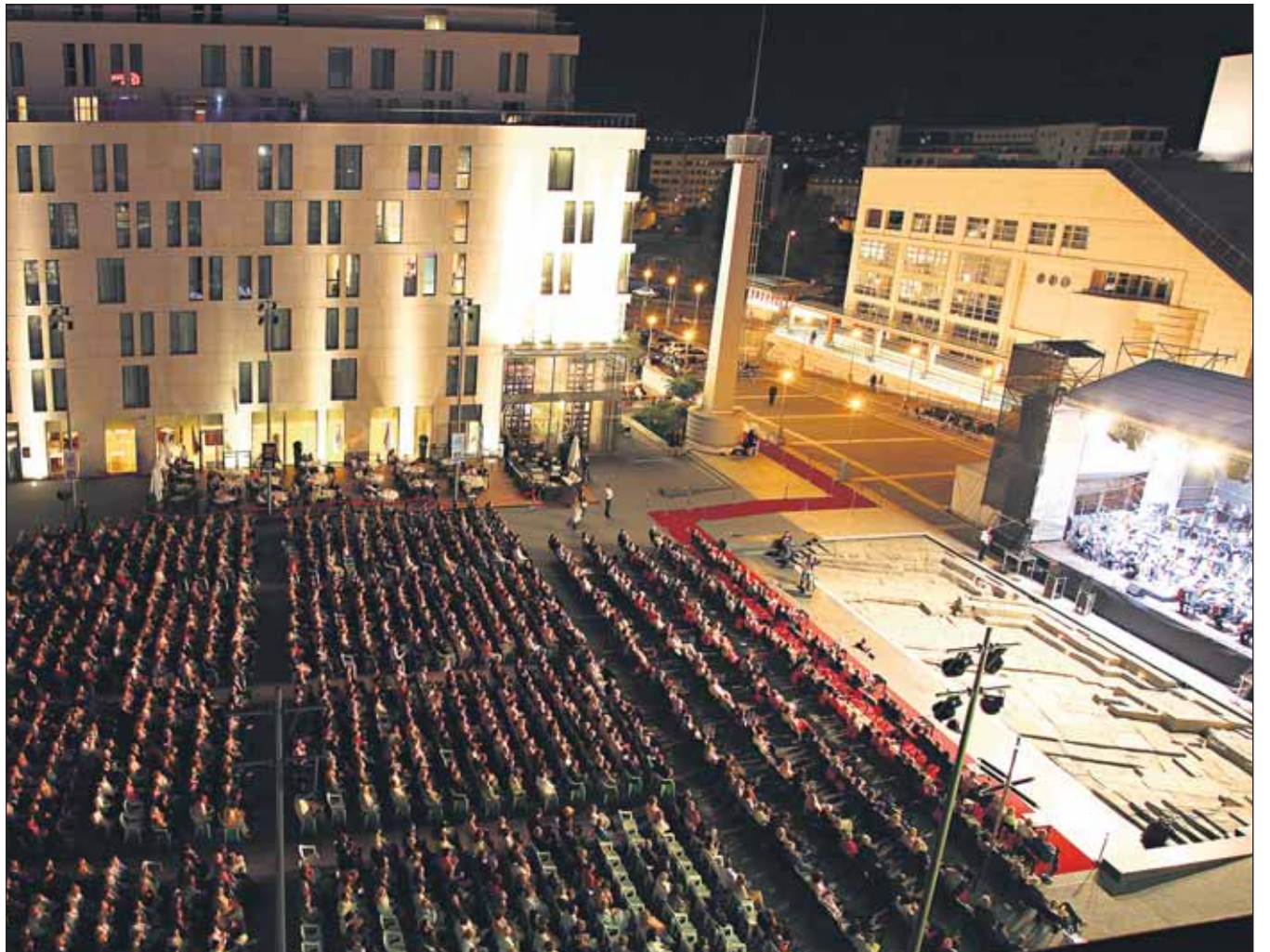
Záverečný koncert festivalu Viva Musica pod holým nebom si nenechali ujsť tisíce návštevníkov.