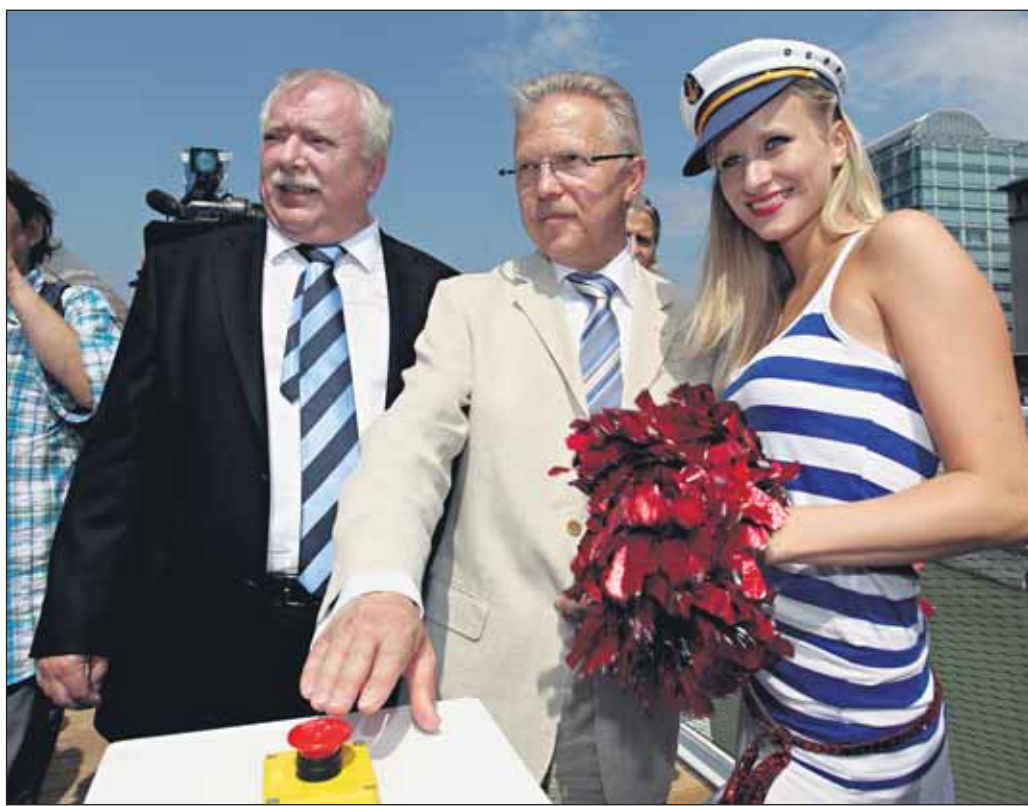
Priamo v centre Viedne vybudovali v priebehu posledných dvoch rokov riečny prístav, ktorého súčasťou je aj multifunkčné centrum. V tom sa okoloplávajúci okrem iného dozvedia o Bratislave. V „Gate to Bratislava“ im poskytnú bezplatné propagačné materiály o nej, predajú im vstupenky na tunajšie kultúrne podujatia, dajú pred cestou na Slovensko užitočné tipy. Vybudovanie prístavu vyšlo na 6,25 miliónov eur, ročne by ním malo „preplávať“ 200-tisíc ľudí.