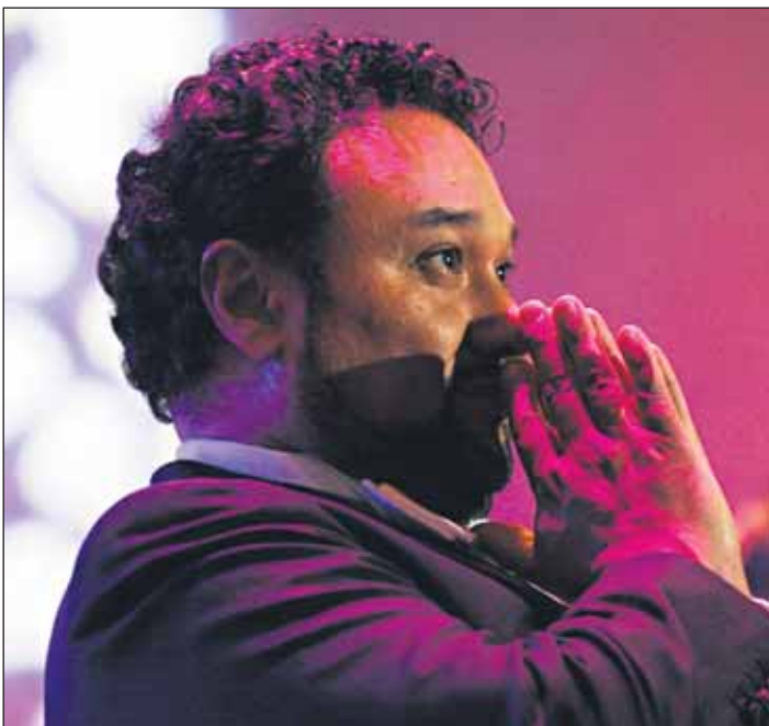
Svetoznámy mexický tenor Ramon Vargas.