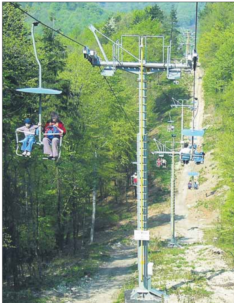
K najväčším atrakciám Nového Mesta patrí okrem Kuchajdy aj lanovka na Kamzík.

To centrálné je na Vajnorskej 21, uskutočňujú sa v ňom podujatia miestneho aj regionálneho významu, celoslovenské aj medzinárodné – koncerty (objavili sa tam už Marie Rottrová, Jaromír Nohavica, Wabi Daněk, Karel Plíhal alebo Kamelot), výchovné koncerty pre základné a stredné školy (rôzne hudobné žánre, besedy s odborník-