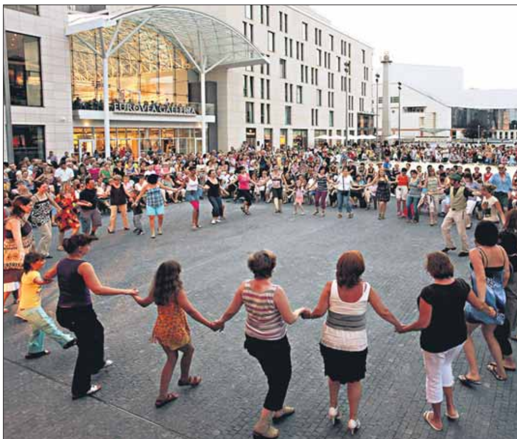
Odkedy v marci sprístupnili časť Bratislavy okolo Eurovey obyvateľom, je tam živo. Raz kvôli futbalu, inokedy kvôli tancu. Ešte živšie je tam odo dňa, keď sa lokalita stala súčasťou tohtoročného Kultúrneho leta . Ktoré sa potiahne do 10. septembra.