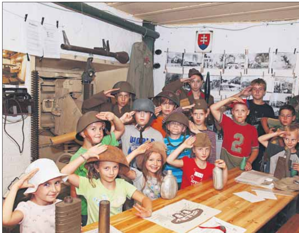
Aj špekáčiky opekali detskí účastníci letných táborov v Petržalke a okolí Bratislavy pri vojenskom bunkri BS-8 Hřbitov (neďaleko sídliska Kopčany), kam vyrážali predovšetkým za novou výstavou Nebezpečné hračky . V rámci tej spoznali a naučili sa rozoznávať nebezpečnú muníciu, ukázali im bomby a granáty, hrali sa na vojakov.