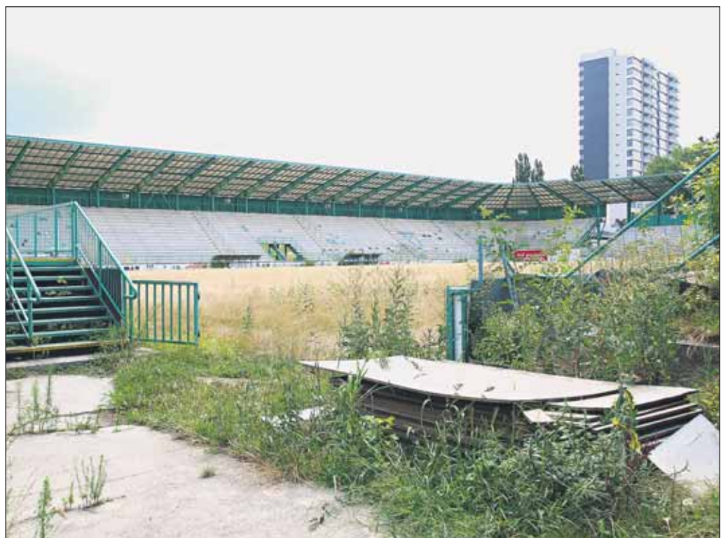
Až k ihrisku sa dá dostať hneď niekoľkými dierami v plote, oddelujúcom od okolia opustený futbalový štadión v Petržalke, na ktorom v minulosti hrávala Artmedia. Búracie povolenie, vztahujúce sa na tamojšiu stavbu, je podľa informácií z petržalského miestneho úradu platné do konca tohto roku. Ak zainteresovaní štadión dovtedy nezbúrajú alebo nepožiadajú o zmenu rozhodnutia o jeho odstránení, povolenie prepadne.