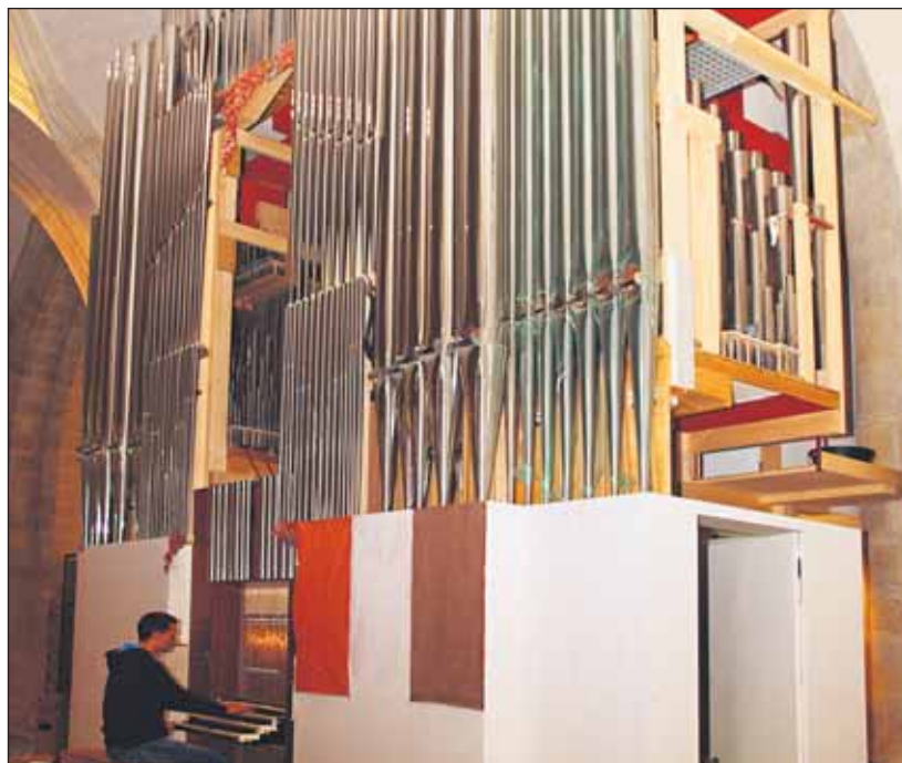
Nový organ sa rozozvučal už v júni.

Dohady o budúcnosti Starej tržnice počujeme takmer každý deň. Názorov je niekoľko, taktiež zámerov, o ktorých sa už aj rokovalo v mestskom parlamente. Zatiaľ však bez výsledku a 100-ročná budova ani zďaleka neposkytuje občanom to, na čo má potenciál. Vyjadrite preto svoj názor a napíšte nám na poštovú adresu redakcie alebo email redakcia@bakurier.sk , ako si predstavujete budúcnosť tohto objektu. Možno inšpirujete poslancov, ktorí majú o nej opäť rokovať.