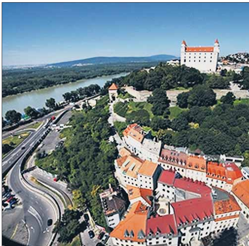
Unikátny pohľad na panorámu Podhradia z vrcholu veže.

Jedným zo symbolov katedrály je aj replika Svätostefanskej koruny, ktorá zdobí vrchol kostola namiesto kríža. 16. augusta 2010 sa opäť po 105 rokoch do-