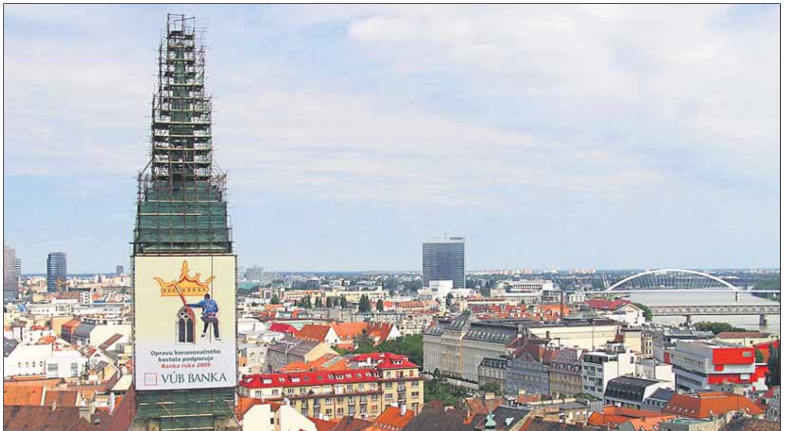
Rekonštrukcia Dómu sv. Martina by mala trvať do budúcej jari.