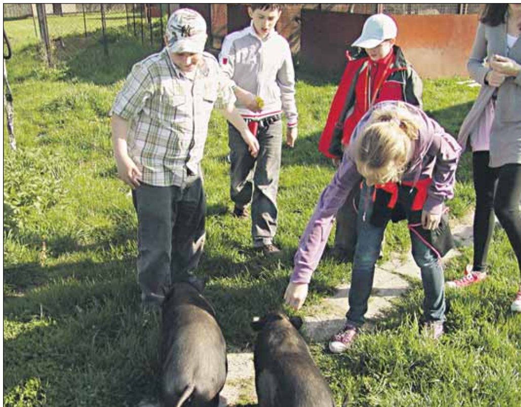
V bratislavskej zoo čoskoro odštartujú dva prírodovedné krúžky pre deti, ktoré sa chcú dozvedieť zaujímavosti zo sveta zvierat a rastlín. A vidieť ich tak zblízka a do detailov, ako sa len dá.