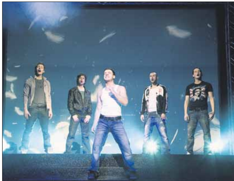
Muzikál Boyband sa hral už v 24 krajinách.