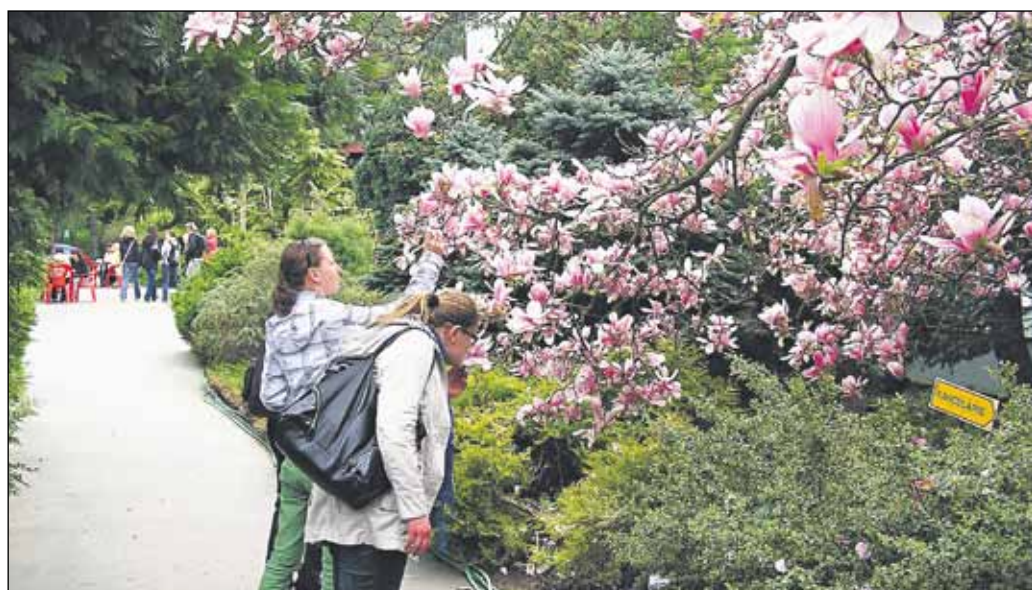
Botanická záhrada poskytovala ako jedno z mála miest počas nabitého vikendu oázu pokoja a oddychu.