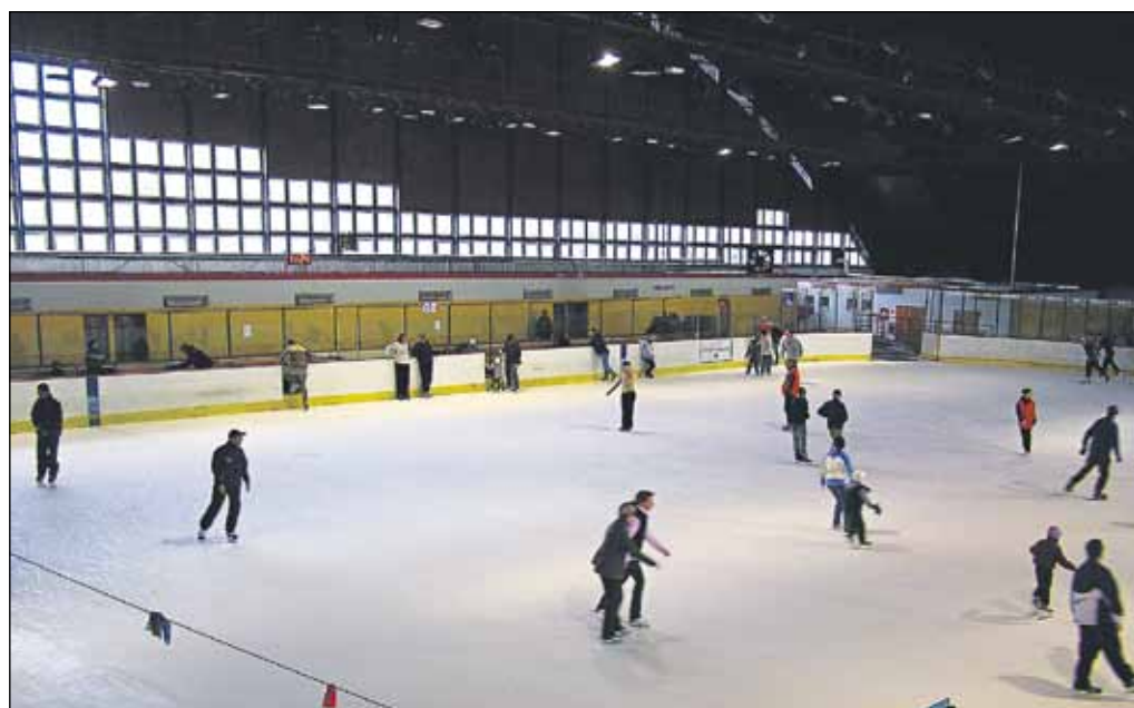
Po náročných vikendových tlačeniach sa mohli športuchtiví ochladiť na ladovej ploche, ktorá bola k dispozícii opäť každému.