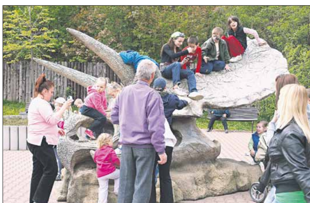
Bratislavská ZOO patrila už tradične počas Bratislavy pre všetkých k hlavným trhákom vikendu.