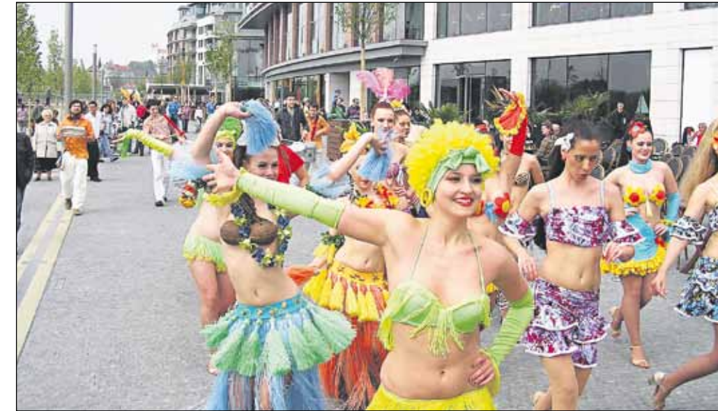
Slávnostnému otvoreniu Eurovei predchádzali desiatky atrakcií a bohatý kultúrny program od skorého rána až do neskorého večera.