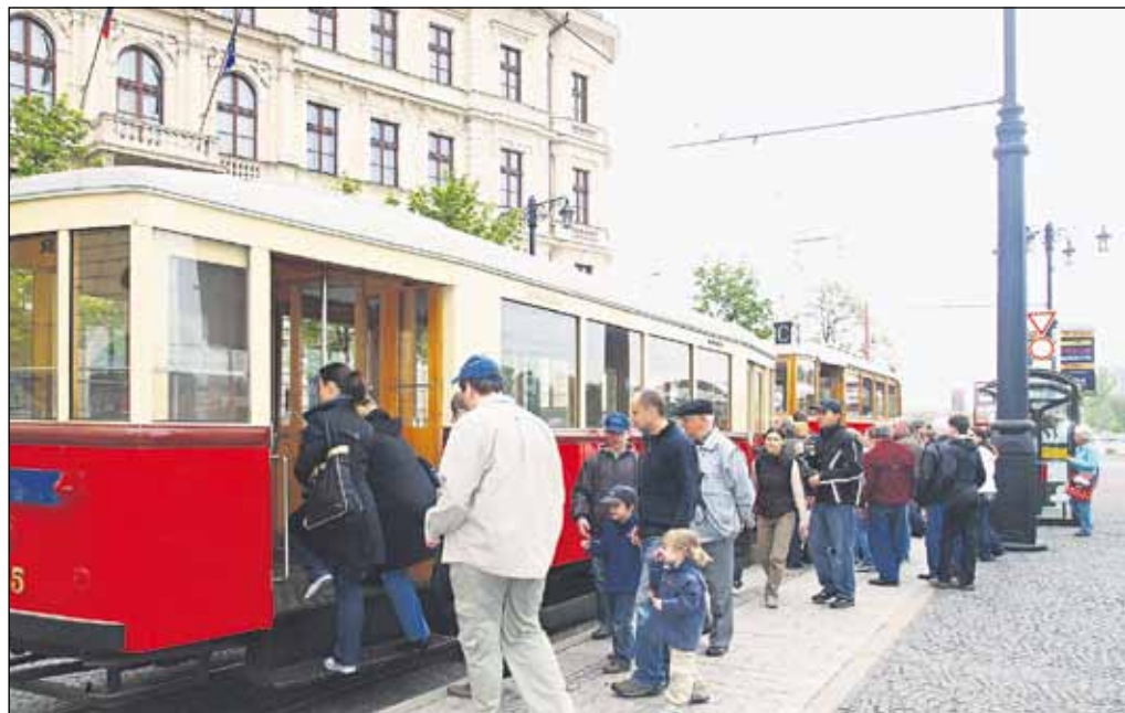
Pre všetkých neboli počas vikendu iba múzeá, parky a záhrady, ale aj vláčik Prešporáčik a historická električka, ktorá nás vrátila na začiatok minulého storočia.