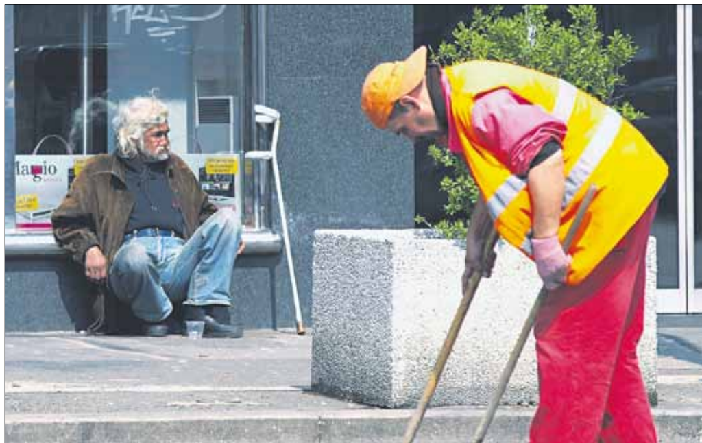
Zarábať sa dá všelijako, v pohybe i po sedačky.