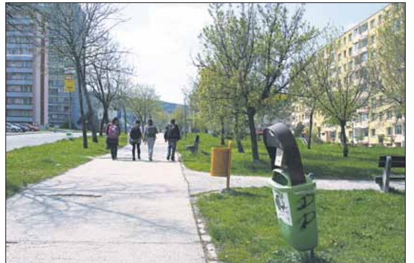
Po Dúbravke je momentálne porozmiestňovaných 35 košov na psie exkrementy (tento v blízkosti Domu kultúry). Objavovať sa budú ďalšie, investíciu si však žiadajú aj tie existujúce, vandalmi poohýbané do rôznych strán a smerov.