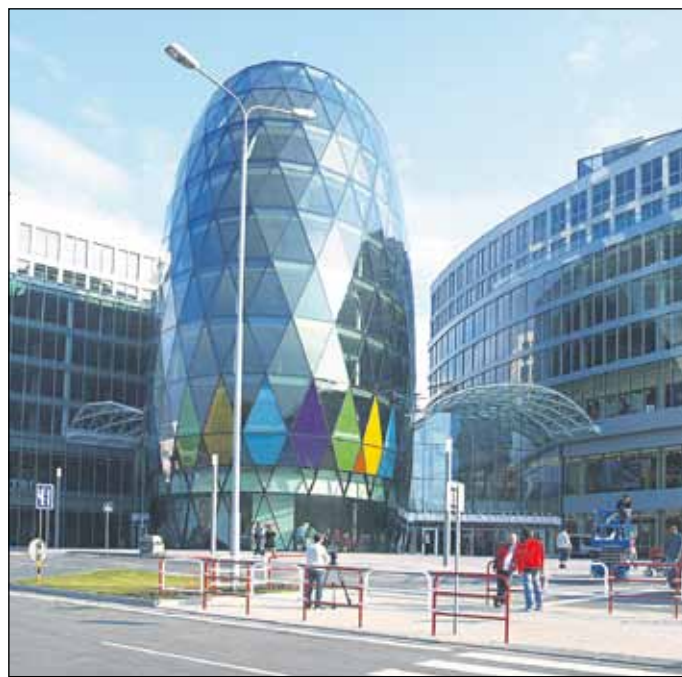
Čas ukáže, či sa Eurovea stane naozaj novým centrom Bratislavy.