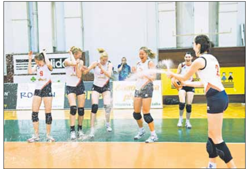
Po zisku titulu tieklo šampanské prúdom.