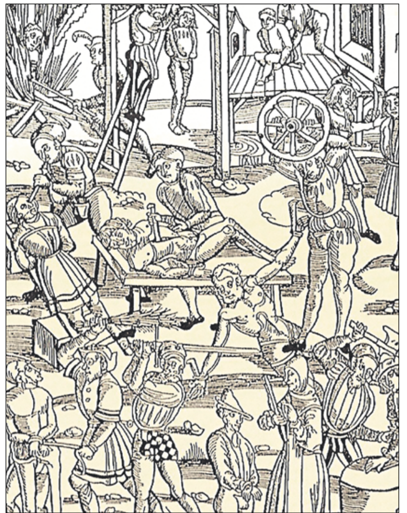
Zločin nevykorenili ani kruté hrdelné tresty a verejné výstražné exekúcie. Rytina z diela Laienspiegel z roku 1508.