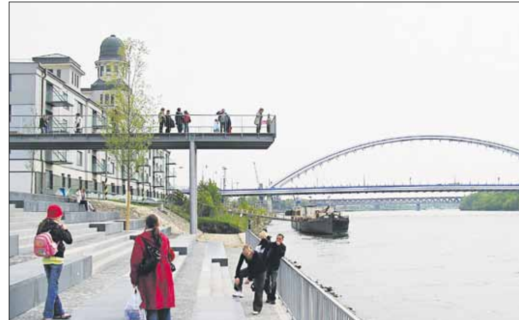
K atrakciám novej Eurovei patrí aj vyhliadková plošina nad Dunajom.