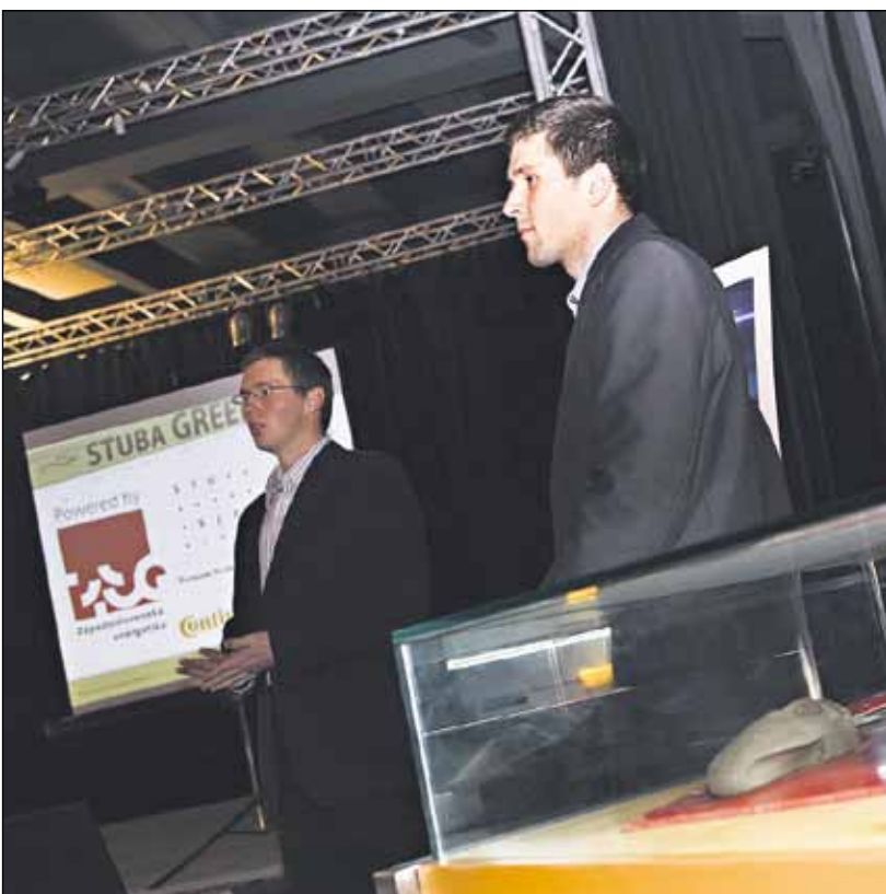
Študenti STU predstavili vlastný elektromobil.