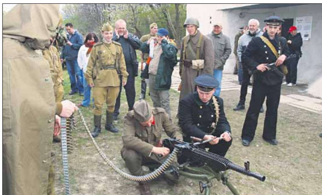
65. výročie oslobodenia Bratislavy a Petržalky si pripomenuli aj v bunkri BZ - 8 Hřbitov, kde v gulometnej veži otvorili aj knižnicu.