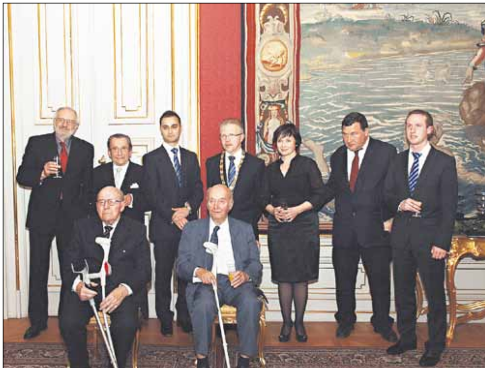
Osem ocenených laureátov s primátorom Andrejom Ďurkovským.