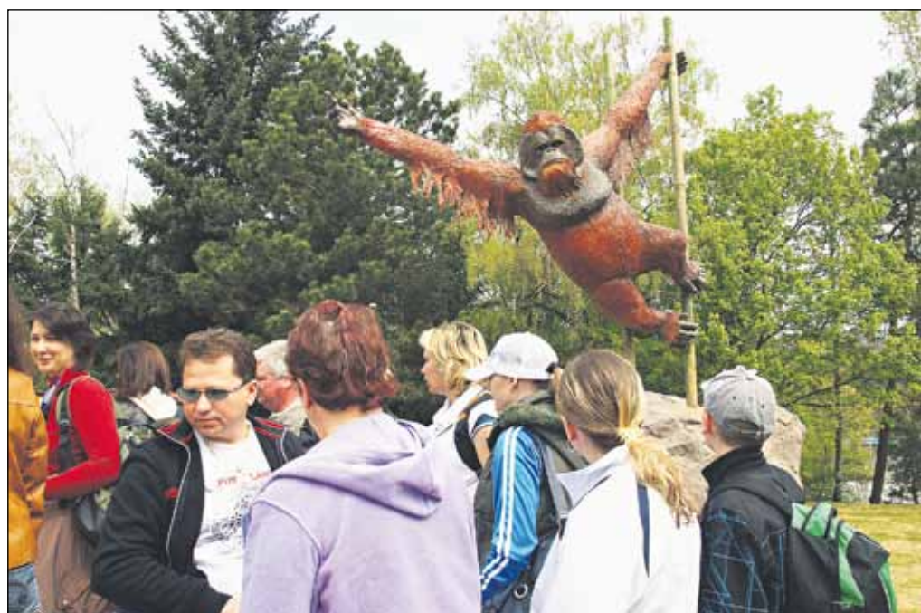
Najväčším prekvapením pre desiatitisíce návštevníkov ZOO bol novootvorený pavilón primátov.