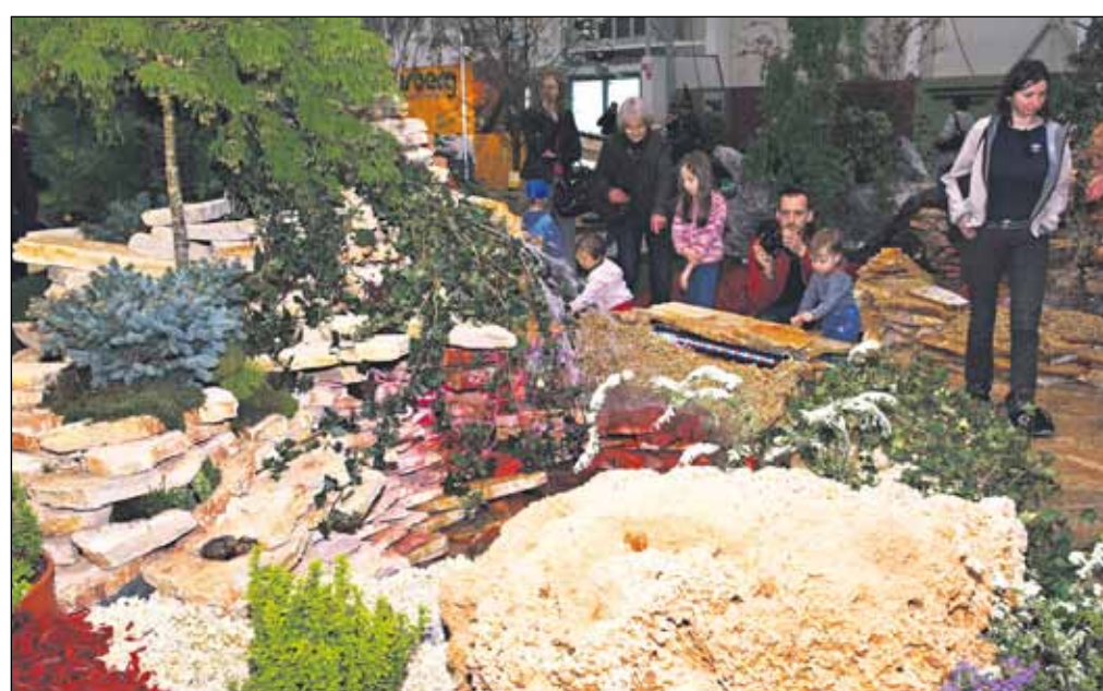
Medzinárodný veľtrh kvetín a záhradníctva Flóra 2010 privítal návštevníkov už po 31. raz.