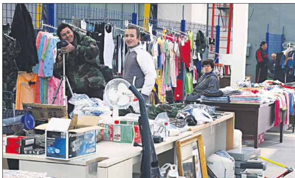
Už niekoľko týždňov funguje v krytej hale na Kopčianskej ulici č. 82 burza, ktorá je otvorená od piatku do nedele.