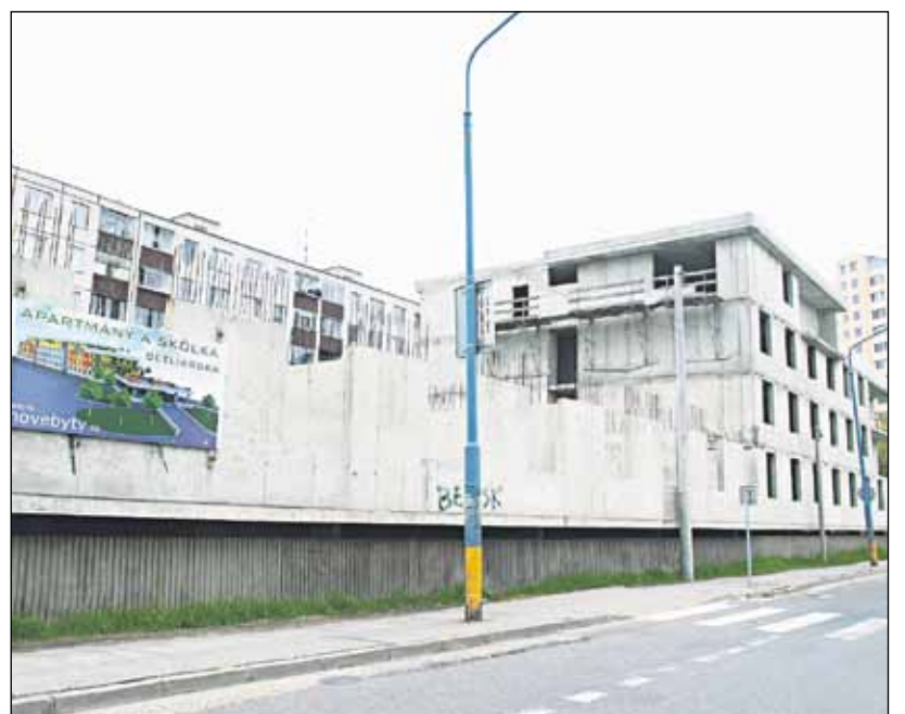
Proti ďalšej výstavbe na Betliarskej ulici už vznikla aj petícia. foto mk