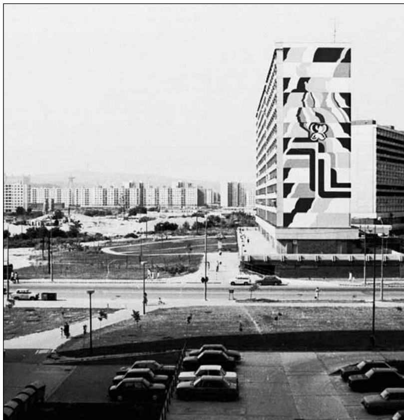
Veľkorozmerná malba na Osuského 1, okolo 1980, foto: Karol Kleibl.