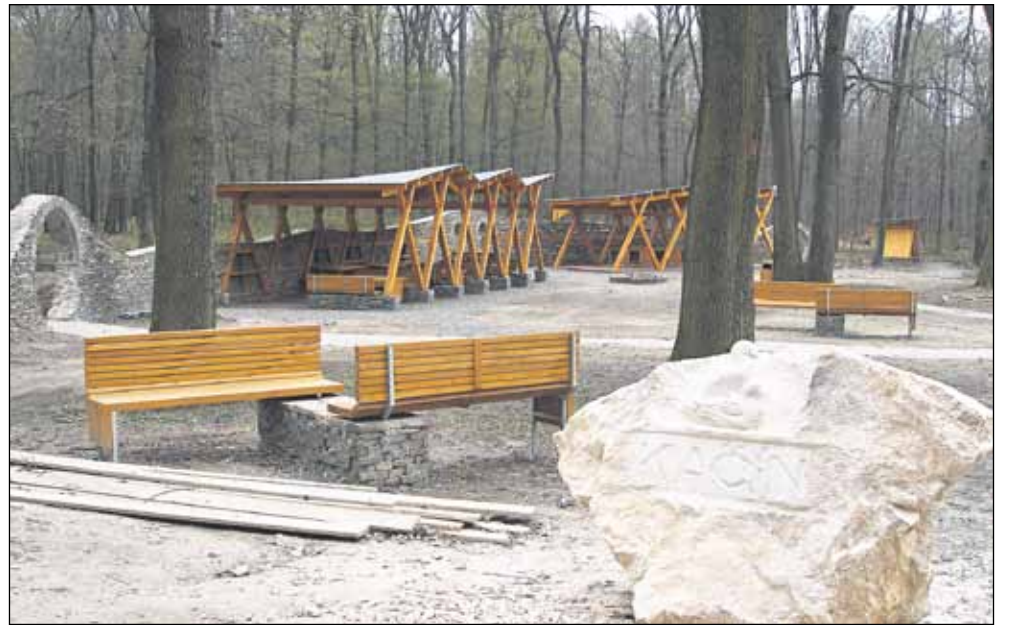
Zrekonštruovaný areál na Kačine mohli počas posledných dvoch víkendov obdivovať už aj tí, ktorým sa nechce šliapať po vlastných. Niektorým turistom sa predĺženie autobusovej linky č. 43 nepozdáva.