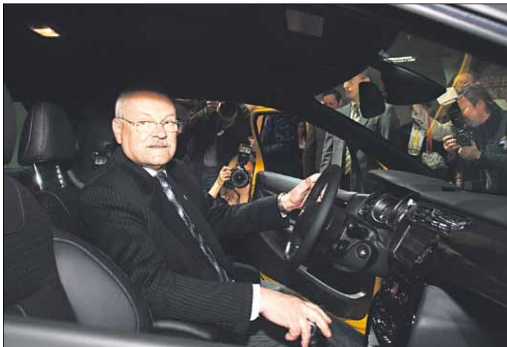
Prezident Ivan Gašparovič patrí k pravidelným hosťom autosalónu.