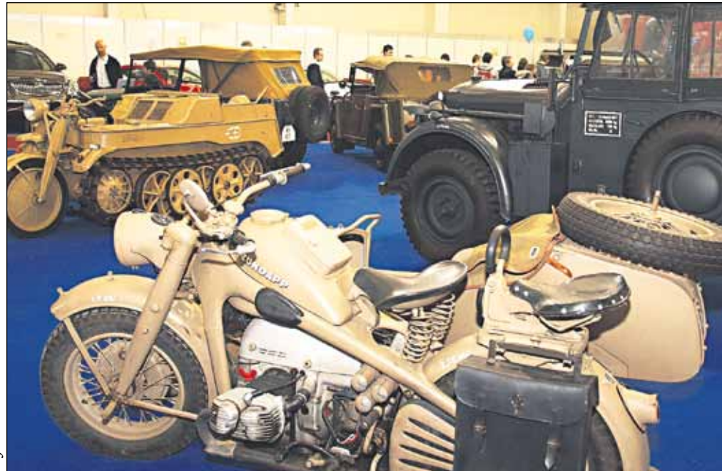
Tohtoročný jubilejný 20. ročník autosalónu obohatili aj vojenské veterány.