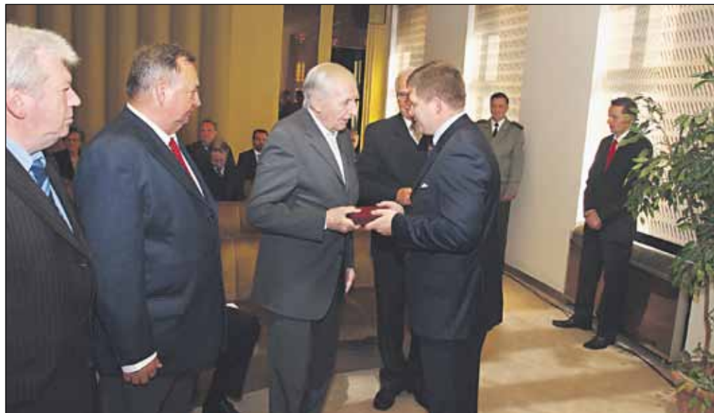
V Zichyho paláci Slovenský zväz protifašistických bojovníkov odovzdal pamätné medaily pri príležitosti 65. výročia ukončenia druhej svetovej vojny. Okrem iných ocenil premiér Robert Fico aj umelcov Tibora Bartfaya či Ladislava Chudíka.