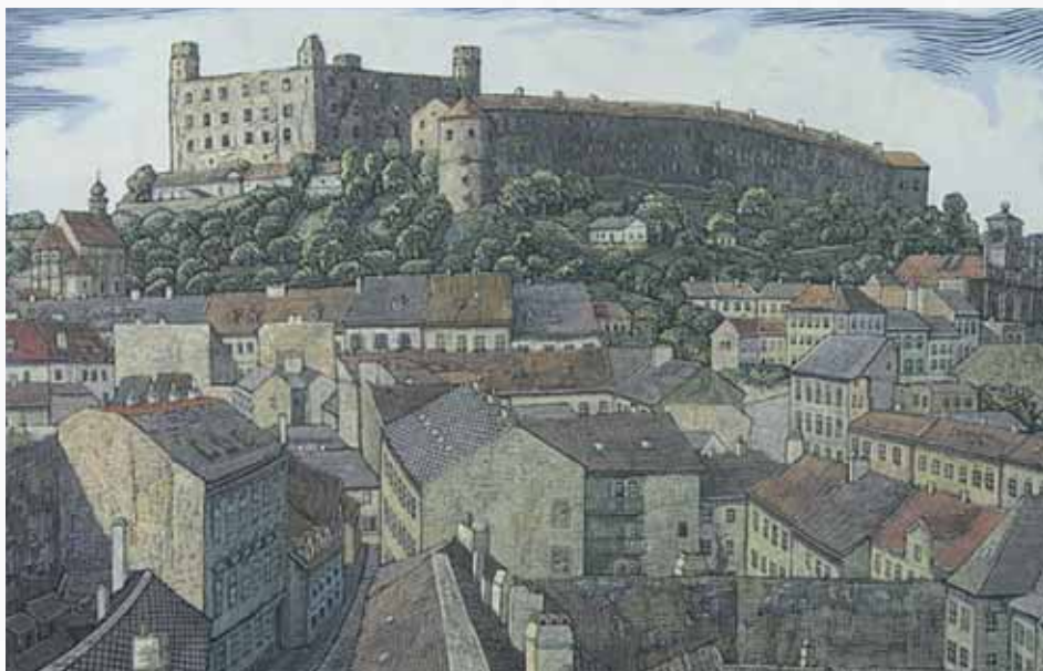
Pohľad na mesto a Bratislavský hrad, kolorovaný linorez Karla Frecha.