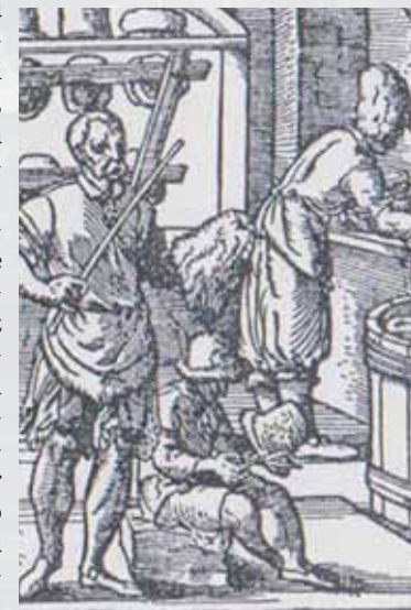
Pohľad do klobočnickej dielne. Bratislavskí novoprijatí majstri museli vystrojiť nákladnú hostinu pozostávajúcu až z 8 chodov.