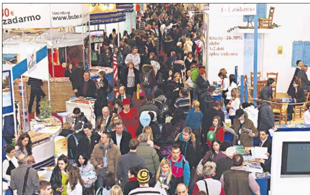
Tohtoročná výstava prilákala rekordný počet návštevníkov - takmer 70-tisíc.