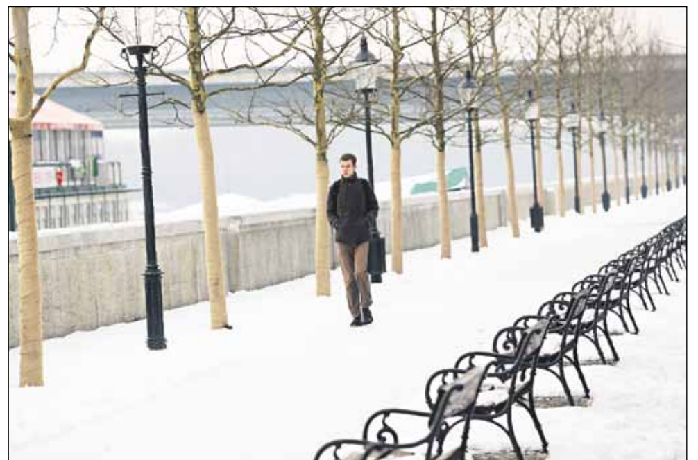
Nábřeží sa zazelená 34 novými platanmi.