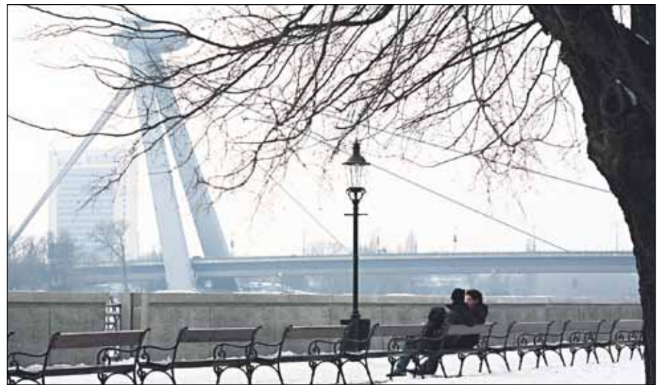
Sto lavičiek sa v poslednom období objavilo na postupne sa obnovujúcej promenáde medzi Starým a Novým mostom.