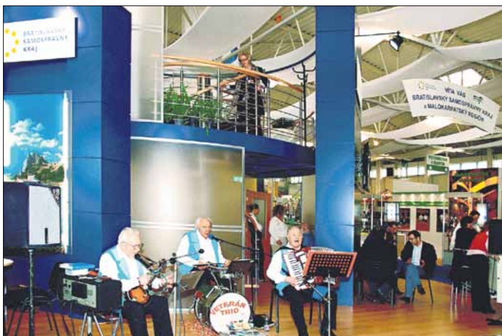
Bratislavský samosprávny kraj vyhrával počas výstavy na ľudovú nôtu.