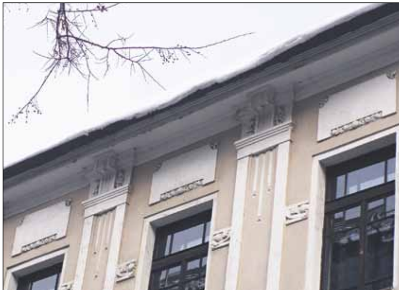
Strecha domu na Lazaretskej ulici. Zatiaľ je sneh primrznutý, no príde odmäk.