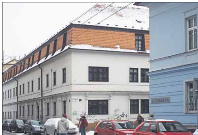
Šikmých striech, momentálne plných namrznutého snehu, je v Starom Meste neúrekom.