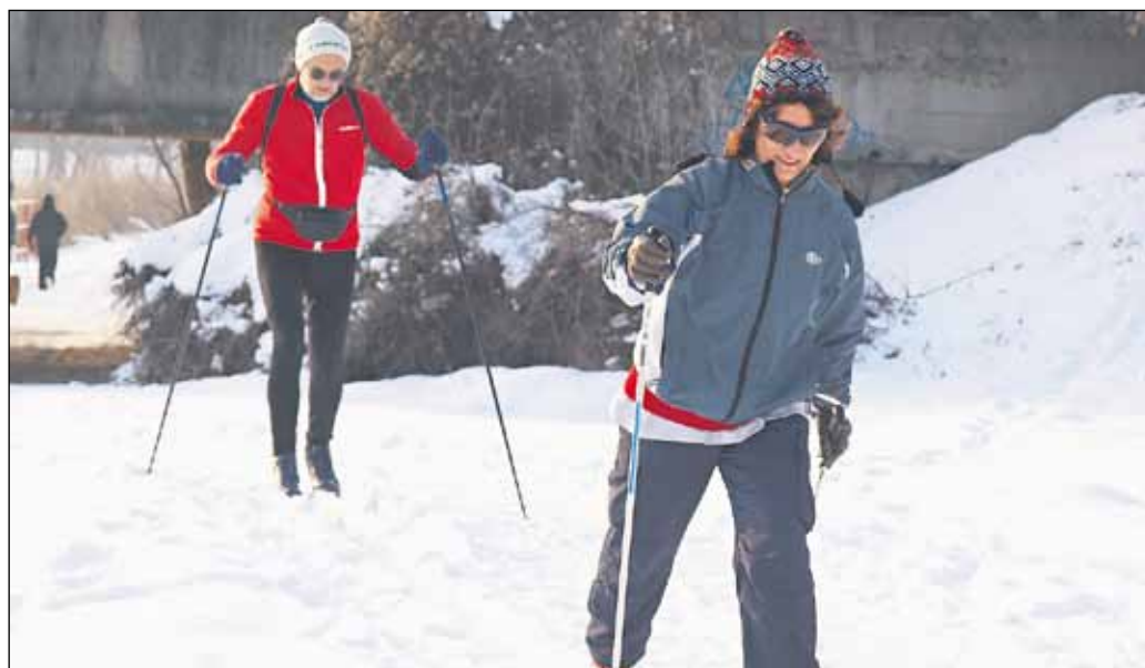
Motoristom sneh narobil nemalé problémy. Niektorí preto vytiahli bežky a v práci boli raz-dva.