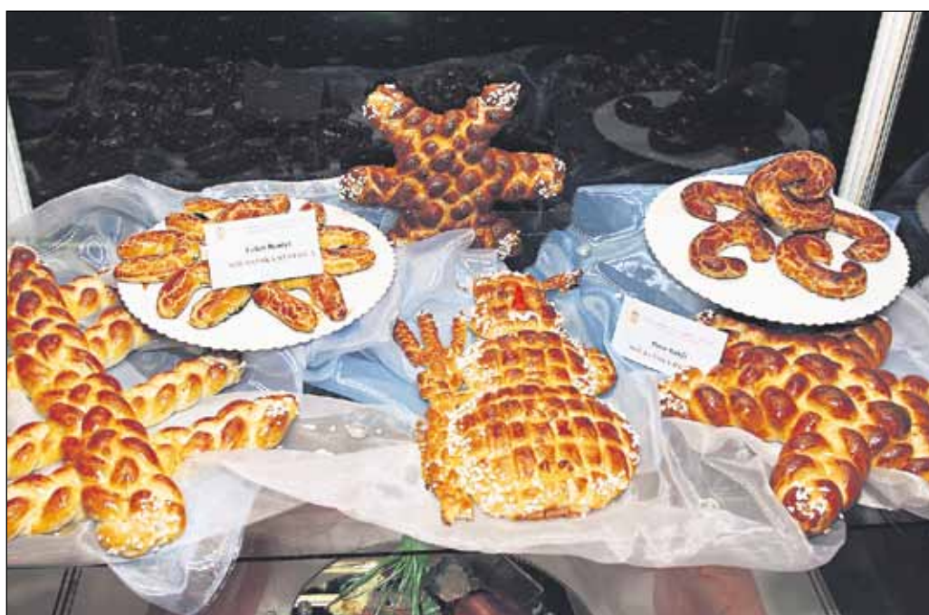
Porota nehodnotila iba chuť, ale aj umelecké stvárnenie.