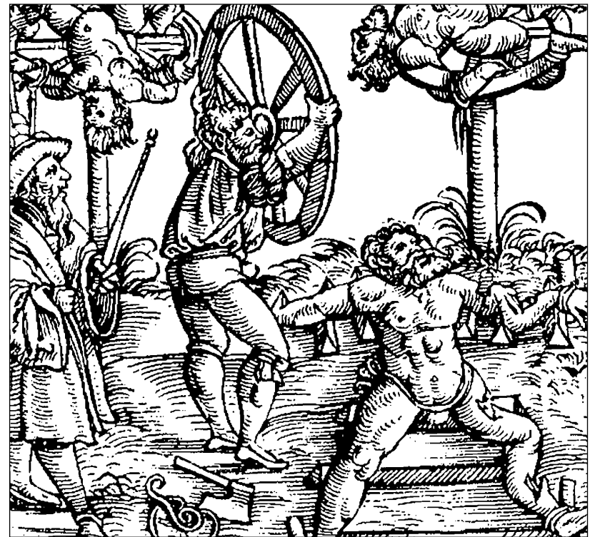
Lámanie kolesom bolo prísny trestom pre obzvlášť zvrhnutiahodných vrahov, akým bol aj prešporský kat Juraj Tolpl.