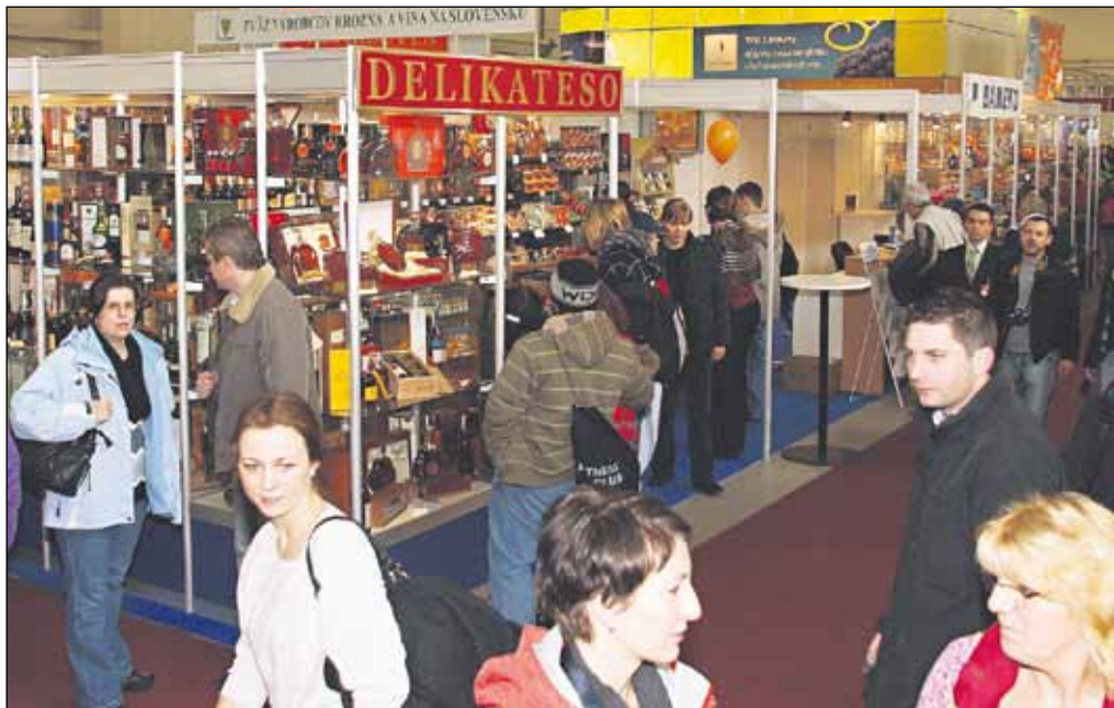
Z toľkých dobrôt pokope sa mohla niekomu na výstave Danubius Gastro aj hlava zakrútiť.