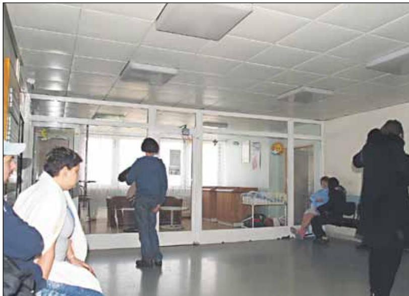
V Ružinove majú mamičky aj ich návštevy oveľa väčší komfort.

Podstatne lepšia je situácia na Kramároch a v Ružinove. „Ako ma informovala primárka novorodeneckej kliniky, stavebné dispozície kliniky na Antolskej neumož-