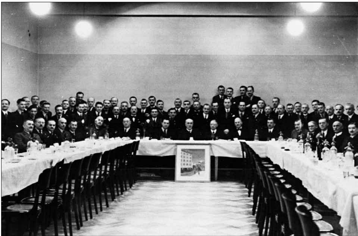
Bratislavskí obchodníci koncom 30. rokov 20. storočia

Zaujímavý pohľad na verejnú činnosť obchodníkov a na obchodné dianie v Bratislave poskytujú údaje o činnosti grémia po vzniku 1.ČSR. Organizačnú úroveň a pracovnú náplň grémia ako samosprávnej organizácie dokladá zoznam pracovných komisií. V grémiu pracovali komisie daňová, pre zahraničné veci, dopravná, obchodno-politická, pre kontrolu živnostenských listov, pre učňovské záležitosti, pre inkorporačné poplatky, skúšobná a finančný rozpočtový výbor. Organizácia reprezentovala pomerne veľkú, v povojnovom období prudko sa rozrastajúcu profesionálnu skupinu. V roku 1927 malo grémium 3254 členov, pričom v roku 1935 združovalo už 4823 obchodníkov. V predstavenstve a v prezídiu Grémia bratislavských obchod-