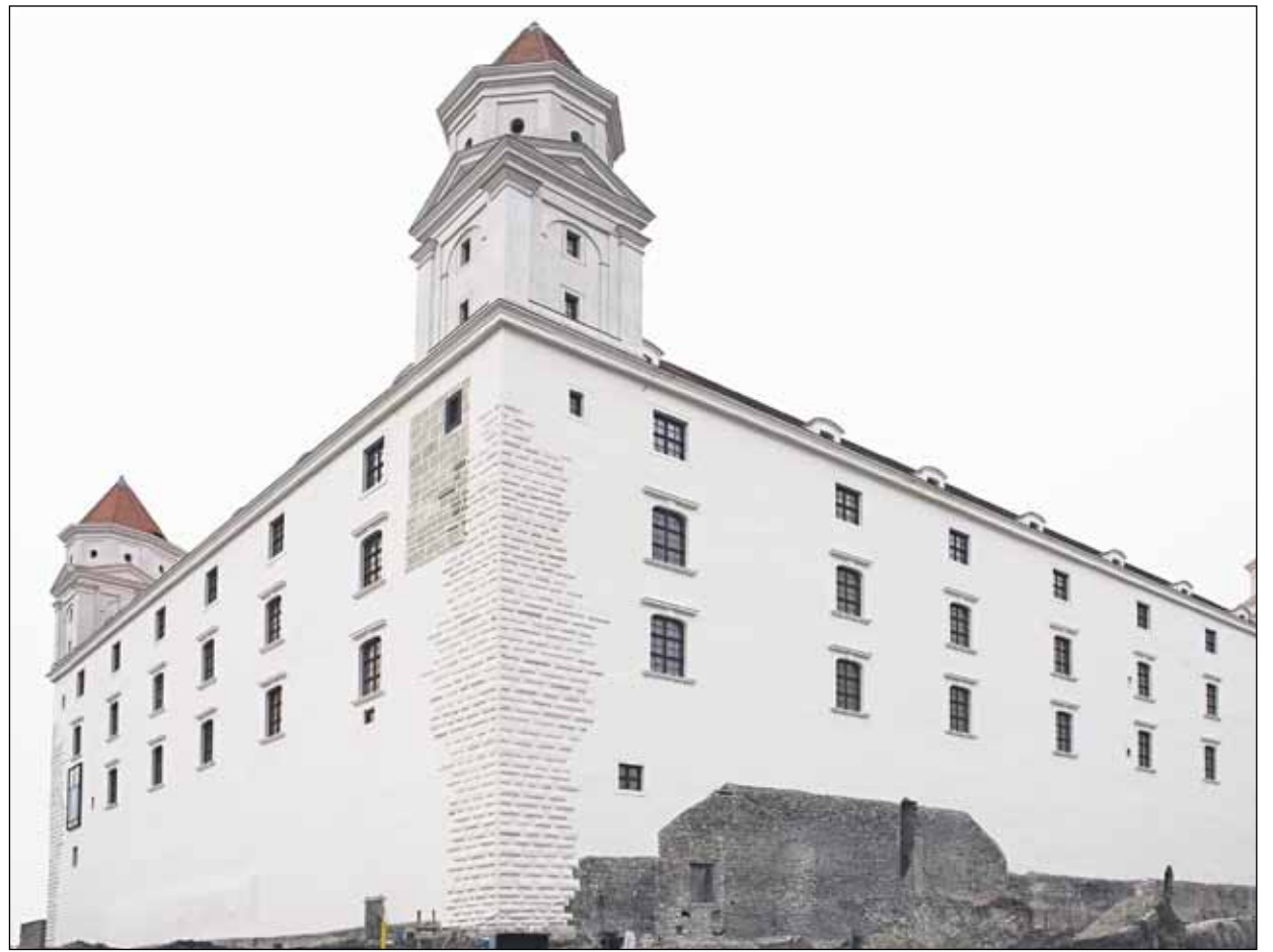
Lomená biela fasáda hradu pristane.

S novým kalendárnym rokom prišla aj nová suma, ktorá bude počas týchto 365 dní čerpaná. Hovorkyňa NR SR hovorí o takmer 15 miliónoch eur: „V rámci štát-