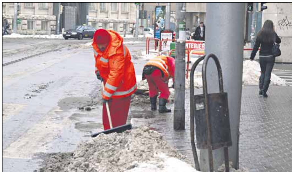
Kde to nešlo strojmi, tam sa museli chlapi chopiť lopaty.