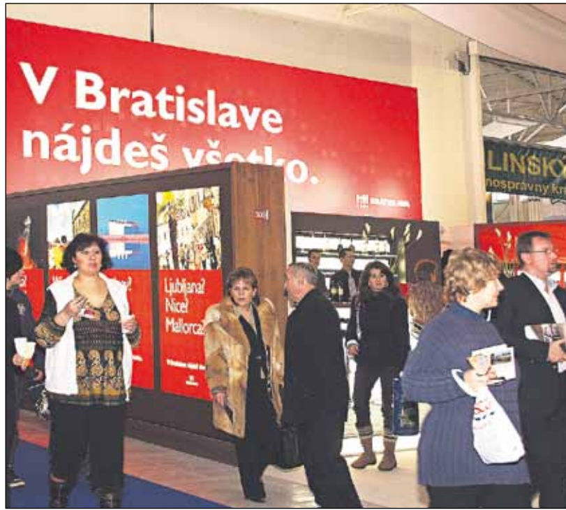
Stánok Bratislavy patril už tradične k jedným z najmodernejších.