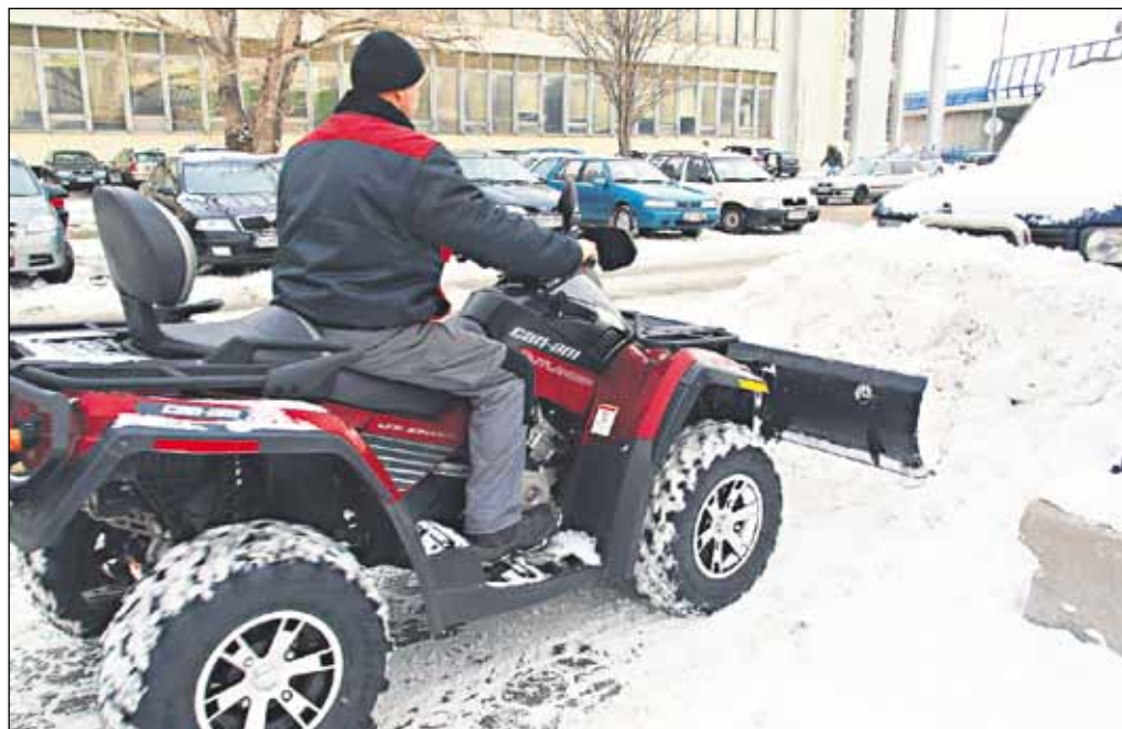
Zrejme najmodernejšie odhrňacie vozidlo v Bratislave - terénna štvorkolka s radlicou.