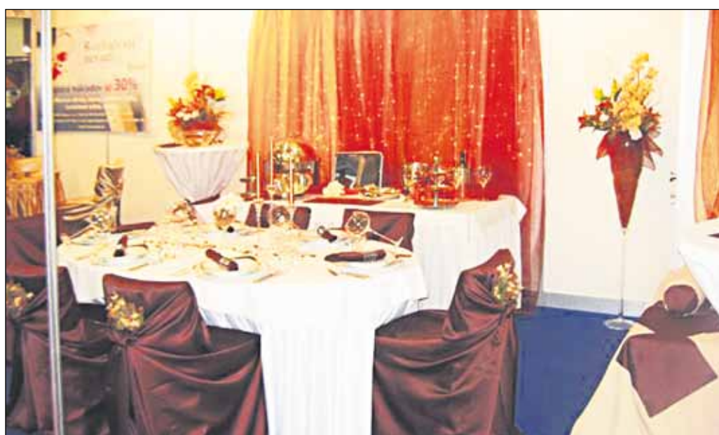
Jedlo nemusí byť iba chutné a dobre vyzerať. Treba ho vedieť aj naservírovať.