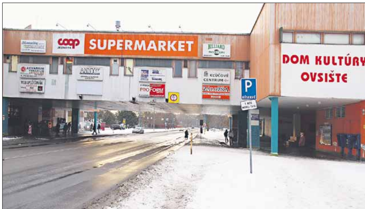
Námestie chcú prebudovať za približne 150 000 eur.