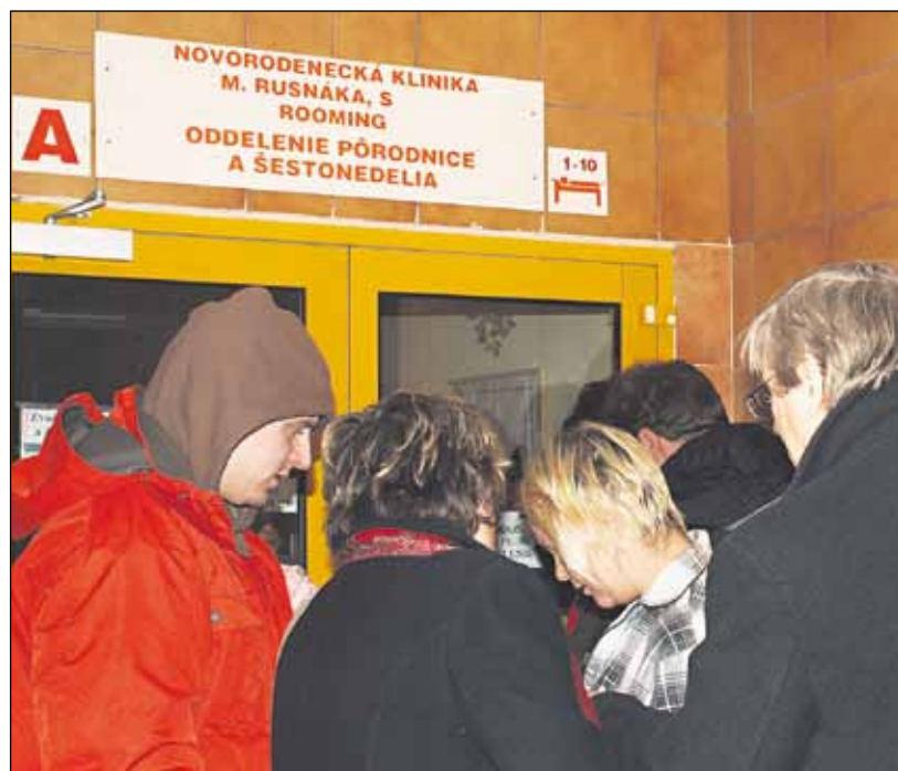
Ak sa počas návštevných hodín na Antolskej zide viacero rodín, boj o kúsok dveri sa stane realitou.

ňujú iné riešenie ako kontakt rodiny s novorodencom cez sklenené dvere (nie okienko). V Ružinove bolo možné „odkrojiť“ z verejného priestoru pred výťahmi. Na jednom konci tohto vestibulu sa vytvoril dostatočne veľký presklený priestor, kde mamičky môžu doviezť dieťaťko a ukázať ho rodine. Podobne to bolo možné vytvoriť aj na Kramároch, kde sú priestory veľkorysejšie,“ povedala nám Rút Geržová, hovorkyňa FNŠP Bratislava.