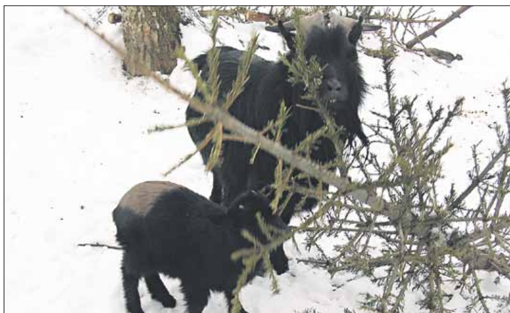
Vianočné stromčeky nechutia iba slonom. V ZOO nimi krmia aj malé kozliatka.