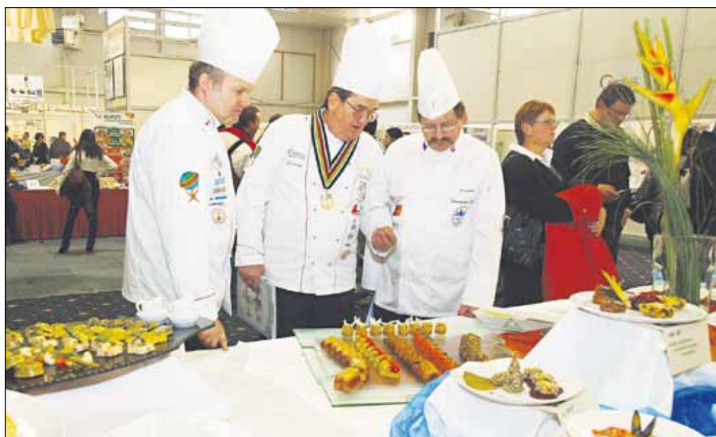
Tí najzručnejší si z Incheby odniesli na hrudi aj cenné kovy.