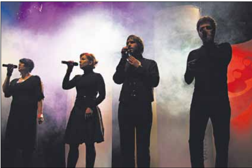
Skupina Fragile svojimi skladbami dokonale navodila atmosféru blížiacej sa olympiády.