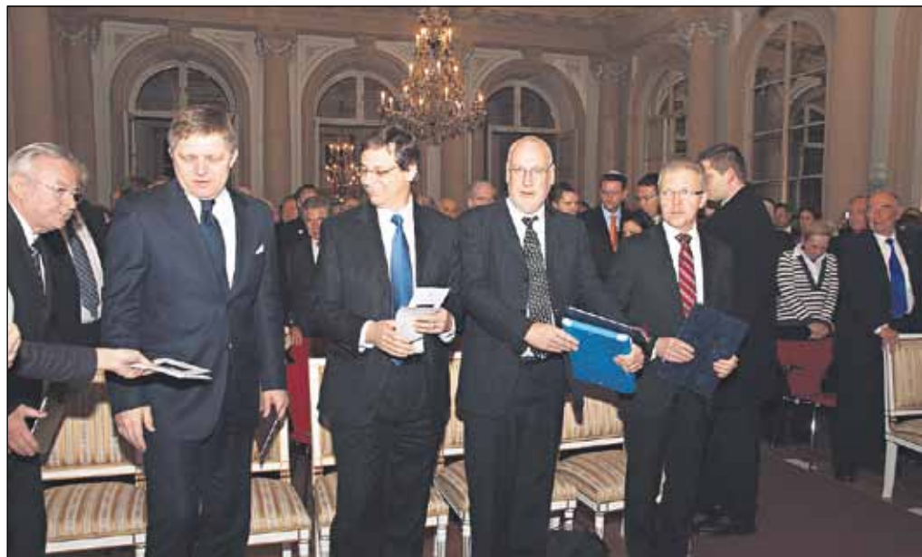
Ďalších 14 Slovákov si v Bratislave prevzalo titul in memoriam „Spravodliví medzi národmi“. Ocenenie každoročne udeľuje Štát Izrael a Múzeum Jad Vašem v Jeruzaleme pre ľudí nežidovského pôvodu, ktorí riskovali svoj život, aby zachránili Židov počas druhej svetovej vojny. Poctu oceneným prišiel dať i premiér Robert Fico a primátor Bratislavy Andrej Ďurkovič.