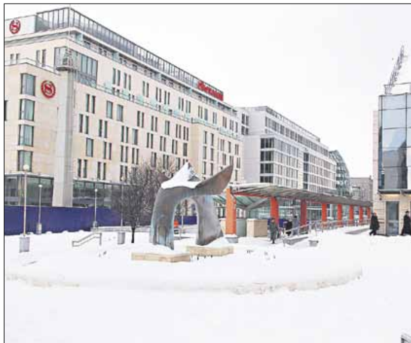
Ružinovskí poslanci chcú pred novou budovou SND námestie pomenované po M. R. Štefánikovi.