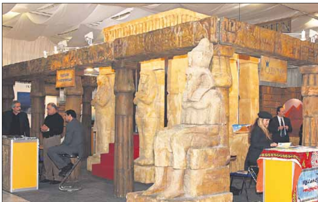
Cestovné kancelárie sa v rámci výstavy ITF Slovakiatour predbiehali v originalite s cieľom zaujať dovolenkárov.