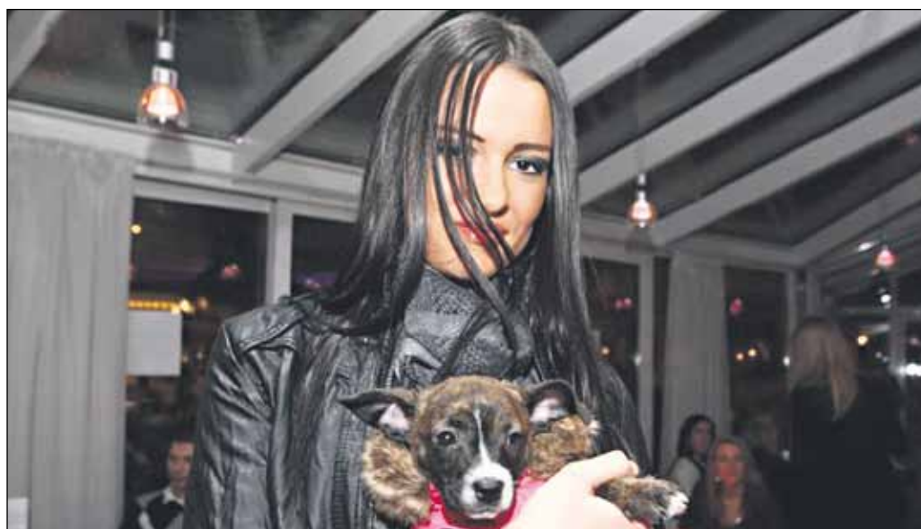
Pred prehliadkou sa konala prezentácia salónu BARBARI PIKALI-prepojenie výživy, kozmetiky a psychológie.