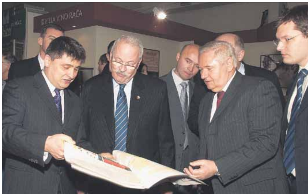
Bratislavský kuriér v rukách prezidenta Ivana Gašparoviča. Zdá sa, že zaujal nielen jeho, ale aj celý prezidentský sprievod.