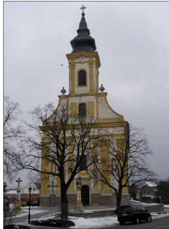
Kostol sv. Petra a Pavla

V lete 1866 sa v Záhorskej Bystrici pred rozhodujúcou bitkou prusko – rakúskej vojny zhromaždili pruské vojská. O dva roky neskôr sa stala súčasťou majetku grófskeho rodu Károlyocov. V roku 1900 žilo v Záhorskej Bystrici 2 195 ľudí v 331 domoch, takmer všetci boli slovenskej národnosti. Okrem roľníkov pribúdalo robotníkov v priemysle a na železnici. Pred prvou svetovou vojnou sa vo veľkom modernizovalo a mechanizovalo poľ-