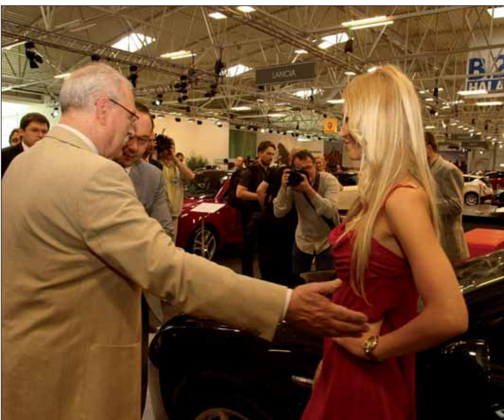
Nezáleží na postavení. Autosalón vie očariť každého fanúšika motorizmu, aj prezidenta Ivana Gašparoviča – a to nielen autami...