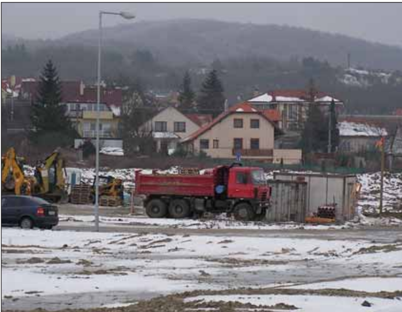
Výstavbu nových obytných zón niekto víta, niekto odsudzuje.