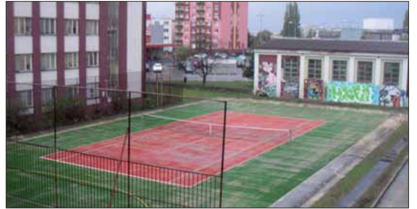
Mesto Šaľa. Projekt „Či je teplo, či je mráz – vonku športujem ja rád“ – výška grantu 6638 €.