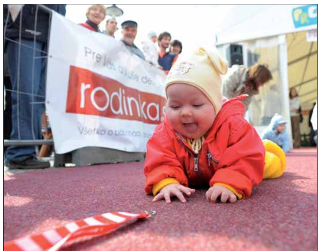
Bratislavský mestský maratón zaviedol vlani unikátnu kategóriu „Beh lezúňov“.