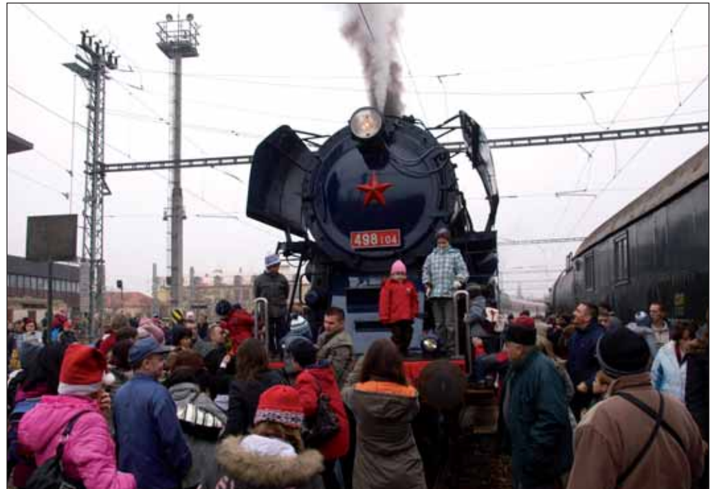
Tohtoročný Mikuláš nedoletel na saniach ani z oblakov. Prišiel na historickom rušni, kde ho čakali stovky Bratislavčanov.