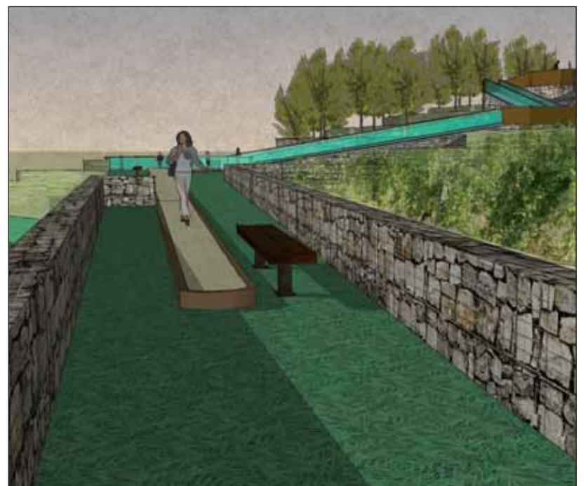
vizualizácia: Magistrát Bratislavy.