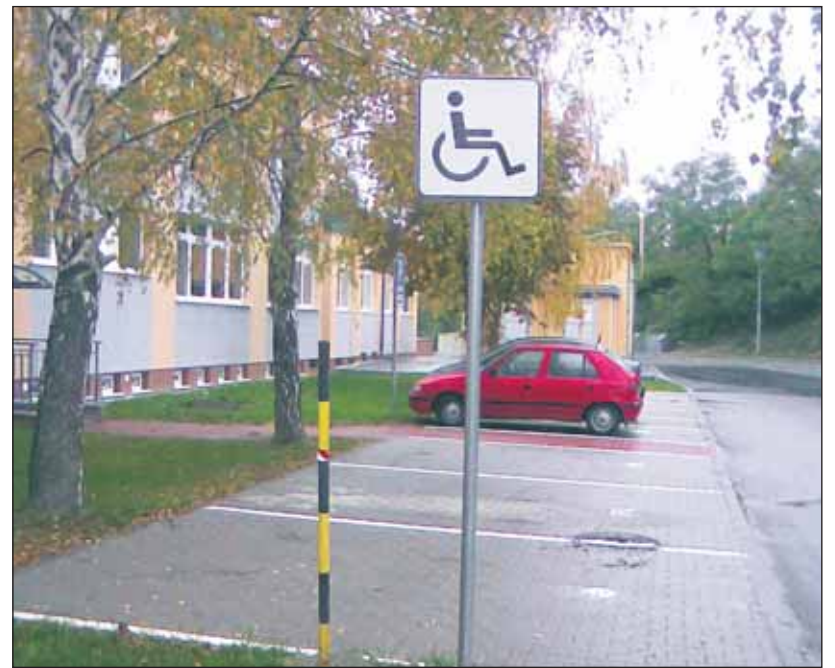
Neoprávnené státie na vyhradených boxoch pre invalidov vás môže od júna vyjsť až na 300 €.

„Vodič vozidla s parkovacím preukazom môže stáť na mieste vyhradenom pre vozidlá prepravujúce osoby s ťažkým zdravotným postihnutím. Vodič osobitne označeného vozidla podľa odseku 1 písm. b) a vodič vozidla s parkovacím preukazom nemusí po nevyhnutne potrebný čas dodržiavať zákaz stáť. Ak je to nevyhnutné, môže vodič takéhoto vozidla vchádzať aj tam, kde je dopravnou značkou vjazd povolený len vymedzenému okruhu vozidiel, a do pešej zóny; pritom nesmie ohroziť bezpečnosť cestnej premávky. Týmto oprávnením nie je dotknutá povinnosť vodiča uposlúchnuť pokyn, výzvu alebo príkaz policajta súvisiaci s výkonom jeho oprávnení podľa tohto zákona.“