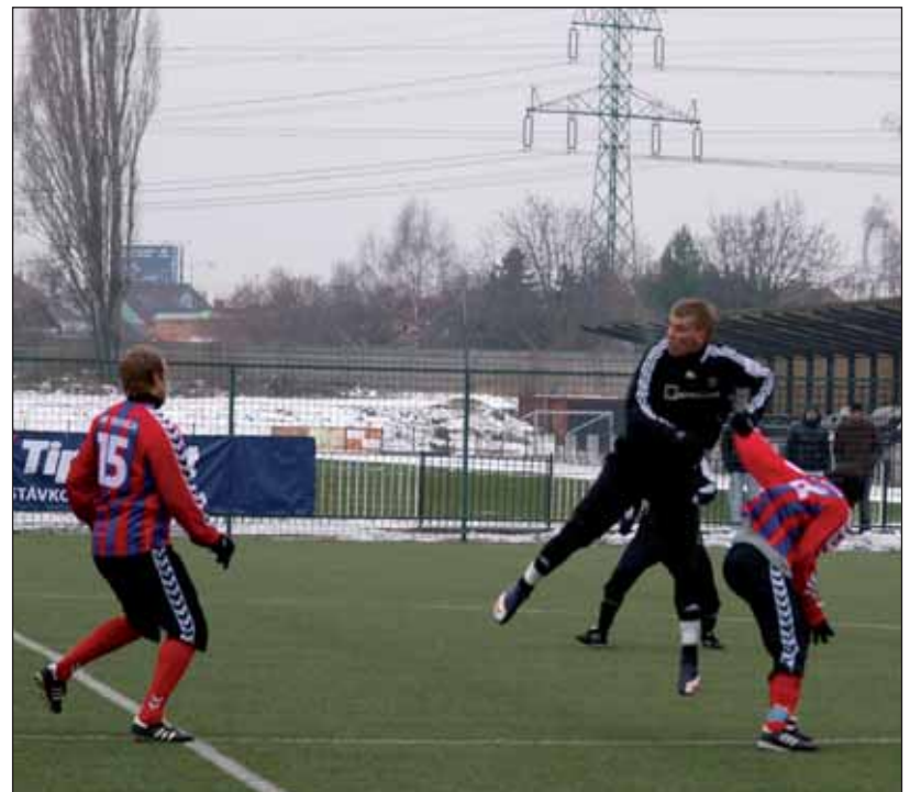
MFK Petržalka odohrala sériu prípravných zápasov aj na bratislavskom štadióne Rapidu.