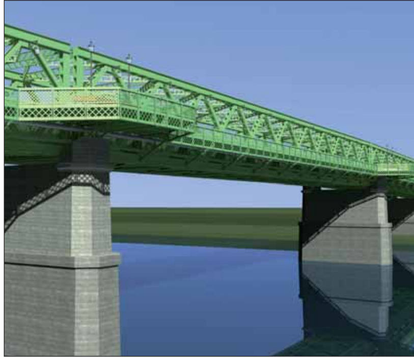
vizualizácia: Magistrát Bratislavy.