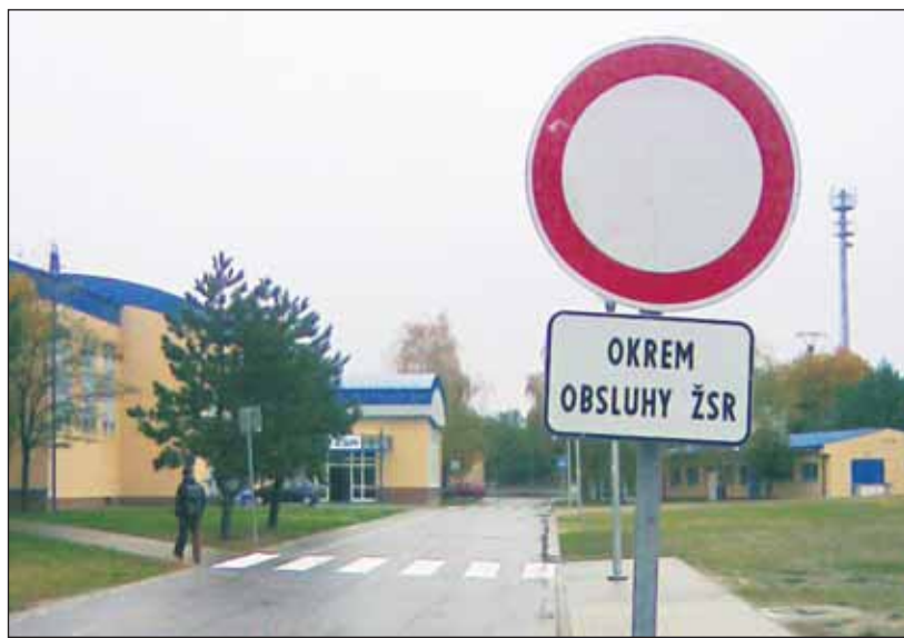
Nezmyselný zákaz vjazdu obmedzuje ZTP vodičov.