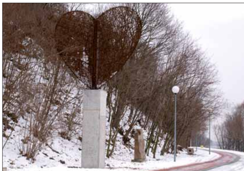
Drôtené srdce dlhé týždne ležalo na brehu Dunaja ako kopa šrotu.