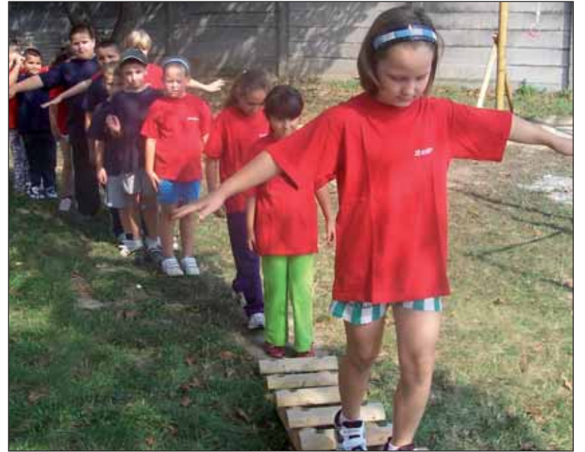
Obec Košúty. Projekt „Exteriérová telocvičňa“ – výška grantu 2440 €.