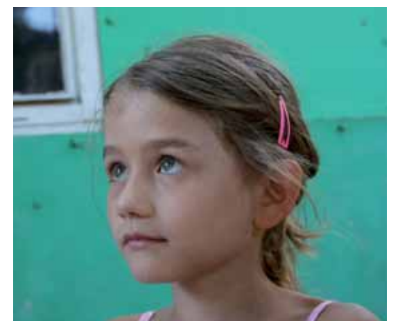
Ktorú školu si tak vybrať?