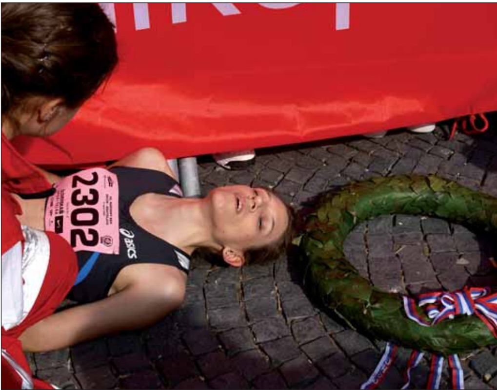
Beh Devín - Bratislava chceli mať niektorí bežci tak rýchlo za sebou, že ich v cieľi 62. ročníka museli pokropiť „živou vodou“.