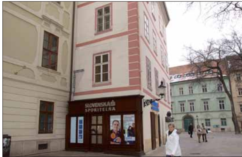
Nová pobočka v priestoroch bývalej reštaurácie Woch.