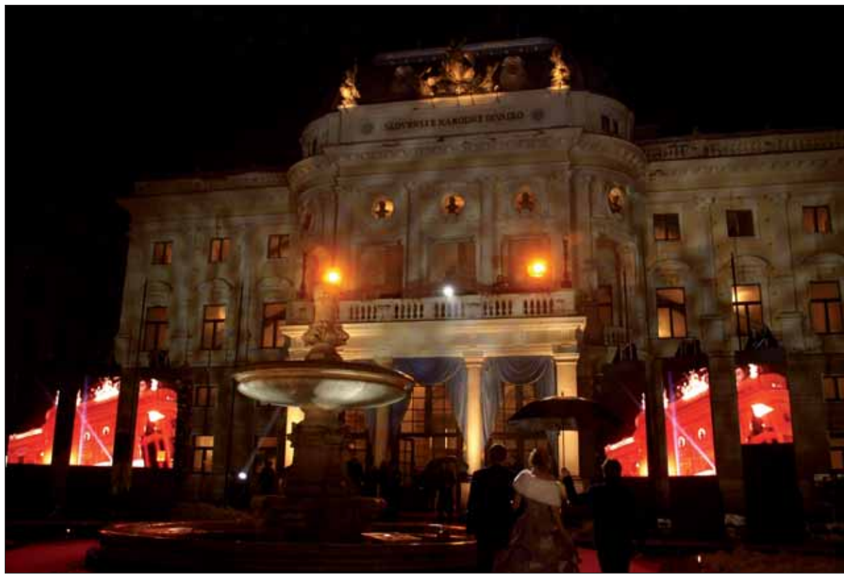
Ples v opere sluboval noblesu už pri vstupe do historickej budovy SND.