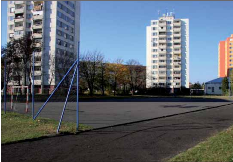
Mesto Nové Zámky. Projekt „Športové centrum novej generácie“ – výška grantu 6638 €.