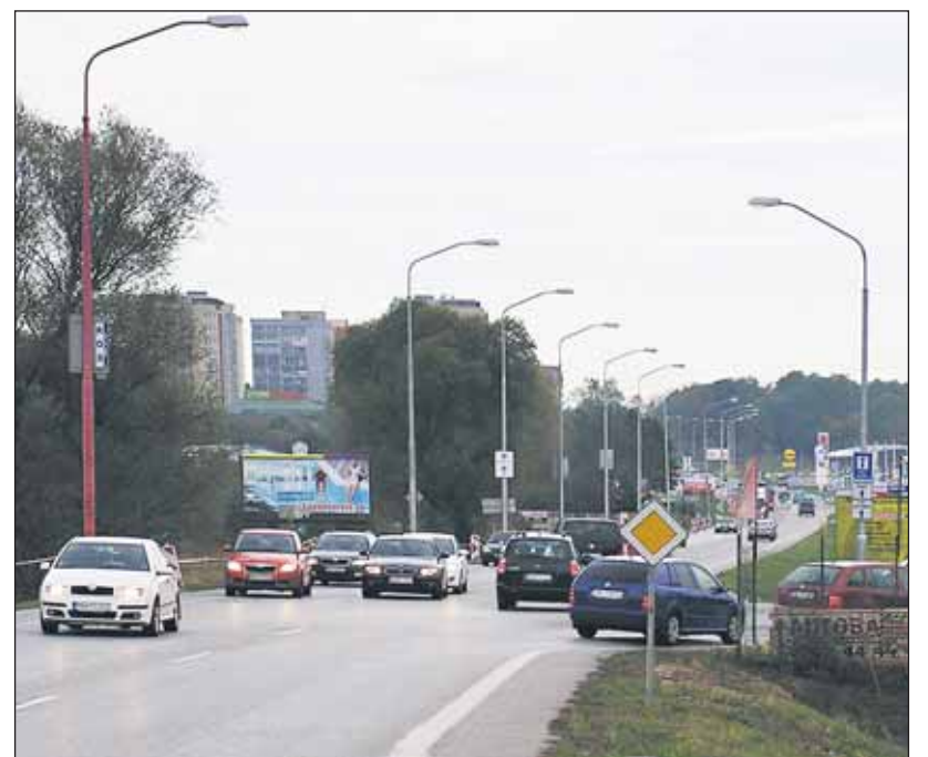
Križovatku medzi Lamačom a Záhorskou Bystricou odľahčí až plánované pripojenie na diaľnicu.