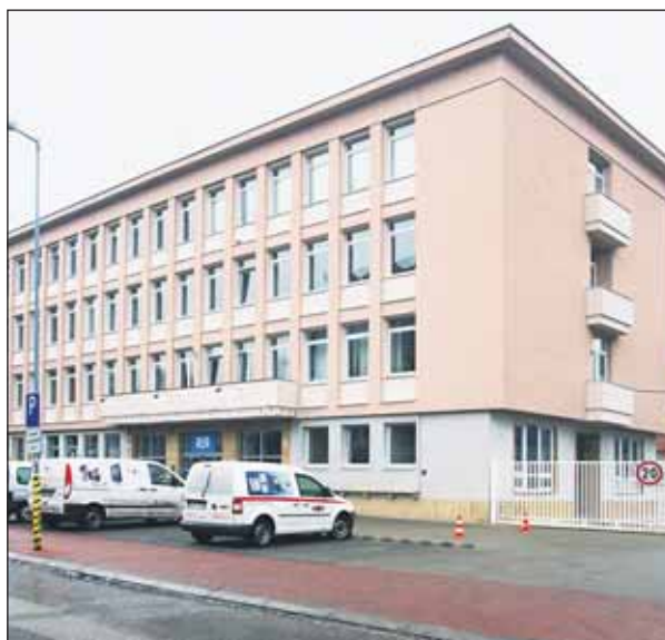
Sídlo BVS na Prešovskej ulici.