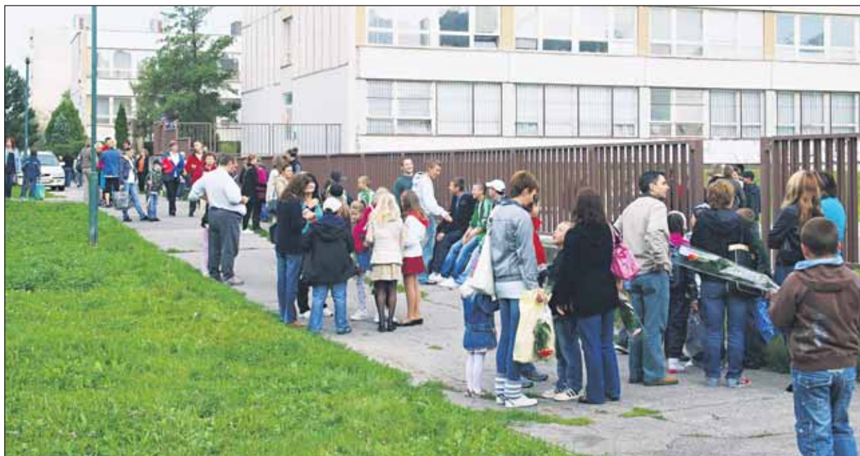
Do bratislavských škôl sa vo februári zapísalo 4391 prvákov.