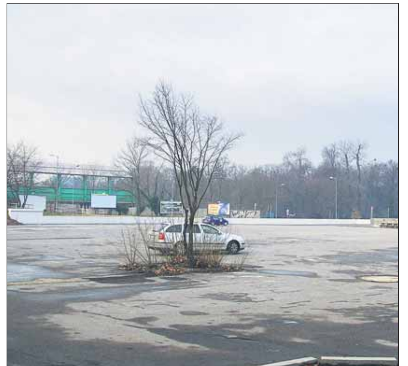
Pod Starým mostom bude záchytné parkovisko najmä pre účastníkov River Fan Zone.