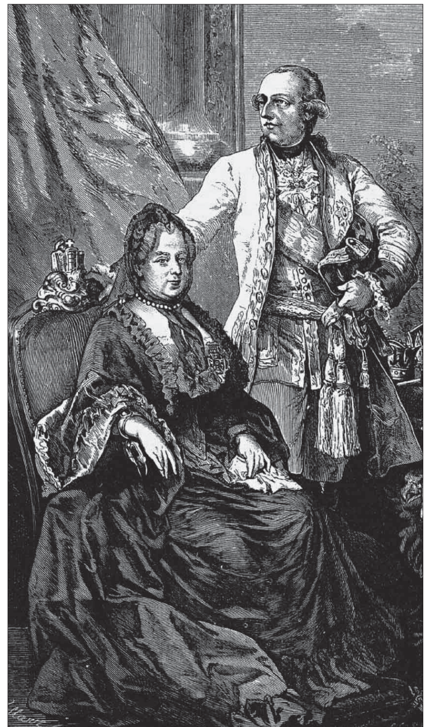
Mária Terézia a Jozef II. patrili k rozhodným odporcom fajčenia.