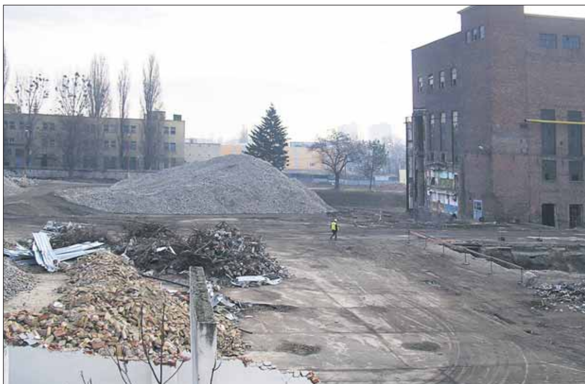
Investičná skupina Penta Investments plánuje výstavbu developerského projektu Čulenova v prvom štvrtroku 2012, ukončená by mala byť v 2018. Projekt vyjde na 267 miliónov eur, jeho súčasťou je aj rekonštrukcia historickej pamiatky Jurkovičova tepláreň.