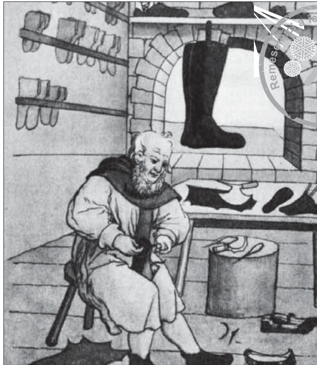
Čižmárstvo sa ako samostatné remeslo konštituovalo koncom 16. storočia, dovtedy čižmy, topánky či bačkory vyrábali ševci.

cechovej pokladnice 16 uhorských zlatých. Ak chcel niekto z iného mesta alebo dediny vstúpiť do cechu, musel si predtým vyrovať všetky podlžnosti v mieste svojho dovtedajšieho bydliska. Ten, kto si zobral za manželku vdovu po majstrovi, platil pri prijatí do cechu 8 zlatých, sy-