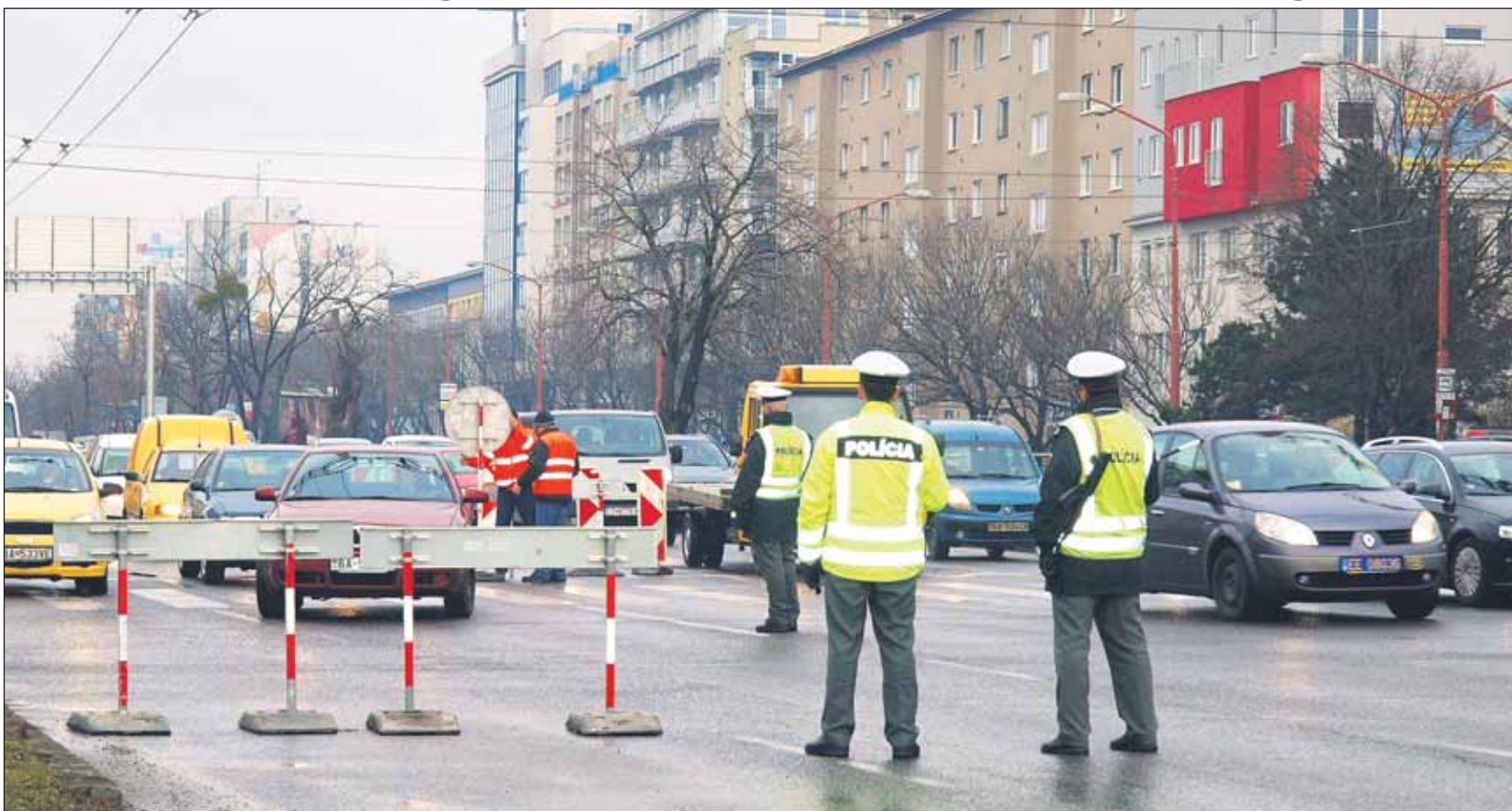
Na bezpečnosť chcú Bratislava aj Košice klásť počas šampionátu veľký dôraz.