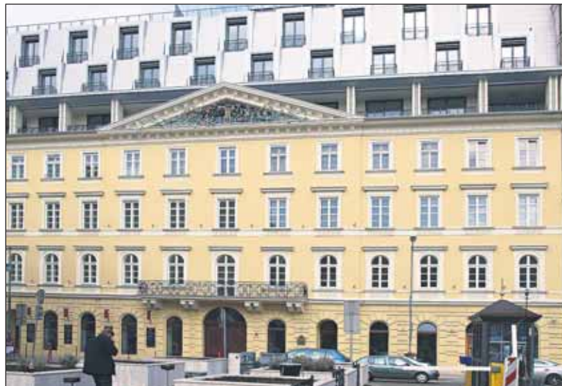
Z nevhodných zmlúv sa točí súčasnému vedeniu hlava.