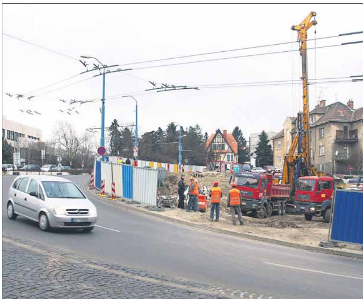
Nová hromadná garáž by mala do konca roka vyrásť pri NR SR. Garáž bude mať štyri podzemné podlažia a parkovať v nej bude môcť 276 áut. Nad zemou vybudujú park. Motorizovaní návštevníci neďalekého hradu a parlamentu by mali za hodinu v garáži zaplatiť od 2 do 2,50 eura, plánuje sa aj nočné parkovanie pre rezidentov za euro.