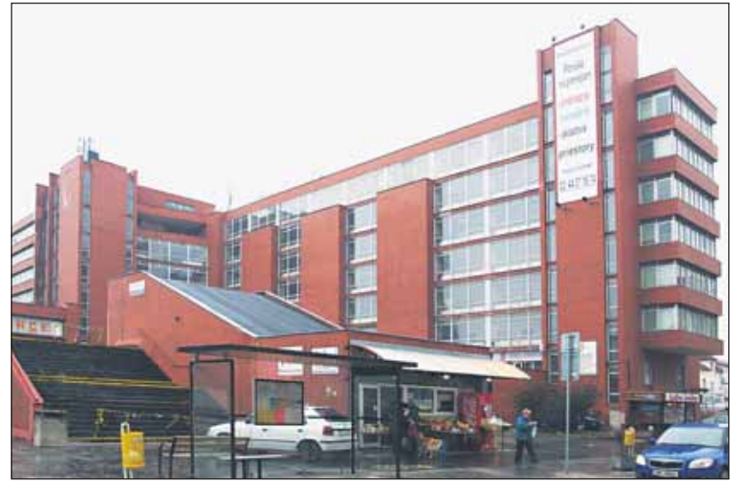
Starosta Nového Mesta chce v poliklinike stopercentný podiel.