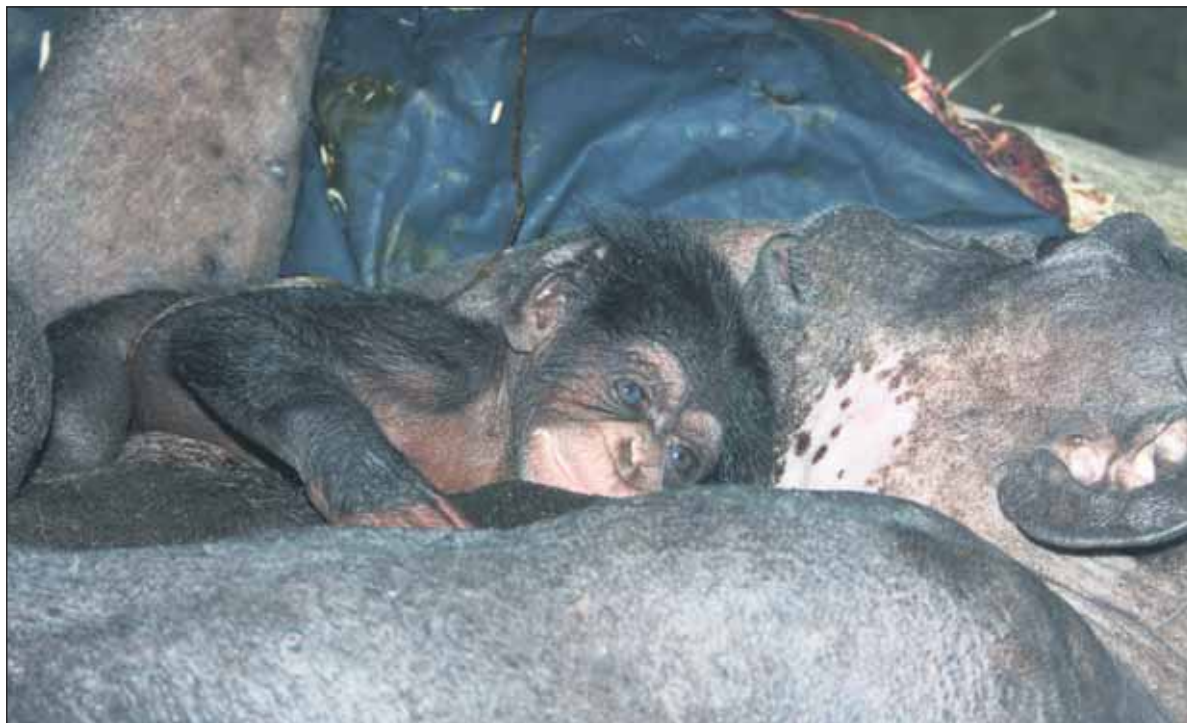
Samička šimpanza učenlivého sa narodila koncom minulého týždňa v ZOO Bratislava. Je prvým mláďaťom ludoopa, narodeným v ich novom pavilóne a zároveň prvým mláďaťom šimpanza, narodeným po roku 1990. Jeho otcom je 45-ročný Kongo, matkou 30-ročná Uschi. Keďže prvé dni života mláďaťa sú najdôležitejšie kvôli jeho samotnému prežitiu, rozhodlo sa vedenie ZOO Pavilón ludoopov na niekoľko dní zatvoriť.