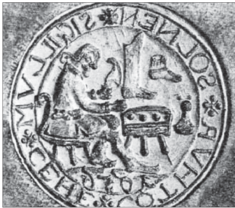
Pečatidlo cechu prešporských čižmárov z roku 1656.

ktorí podošvy prešivali pomocou šidla dratvou, čižmári pripevňovali podošvy kovovými klincami alebo drevenými cvočkami.