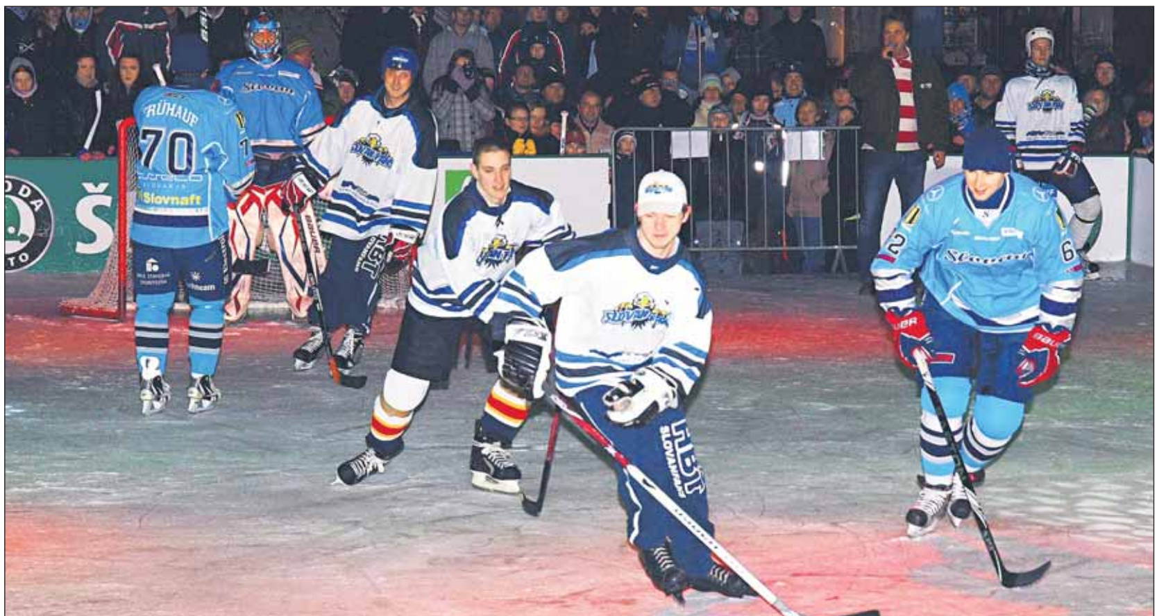
Hokejisti Slovana ladili formu pred play off hokejovej extraligy na Hlavnom námestí so svojimi fanúšikmi.