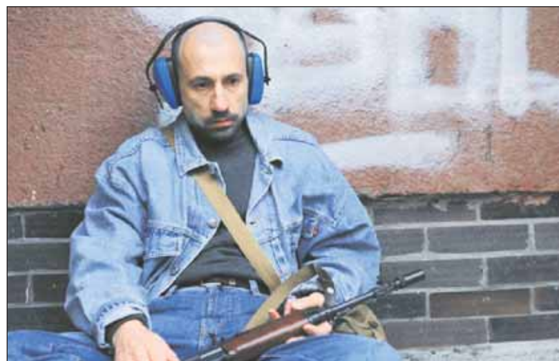
Záverečná scéna dokumentu