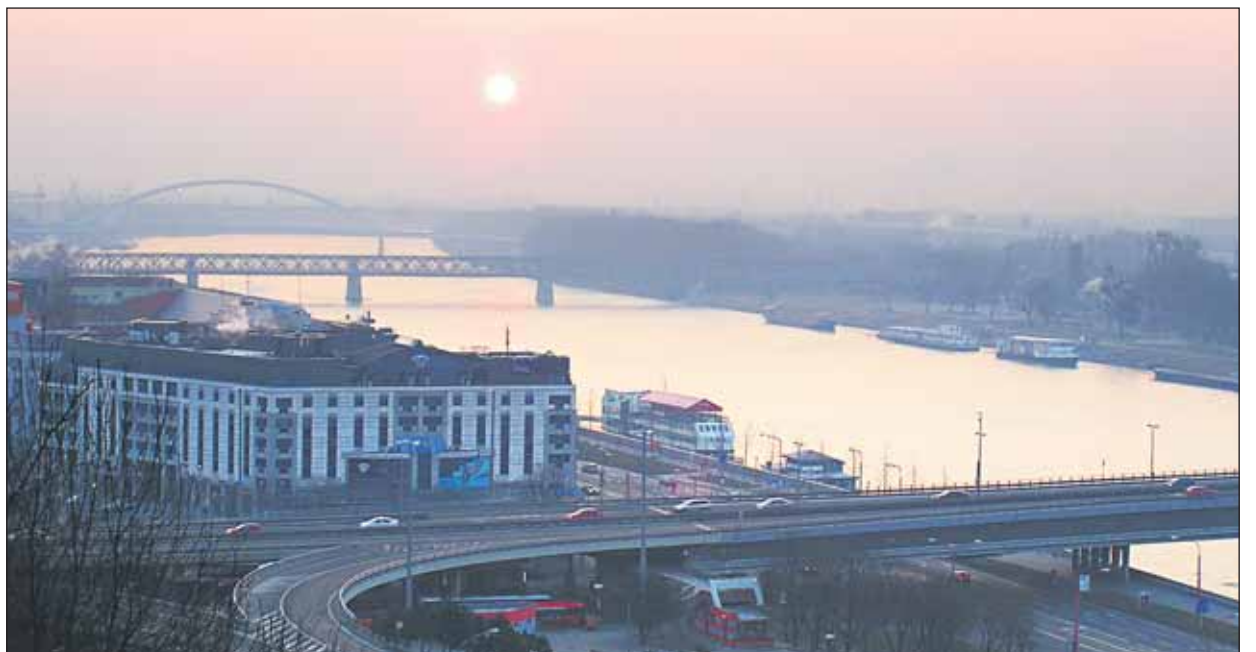
Mrazivé ráno nad bratislavskými mostami.