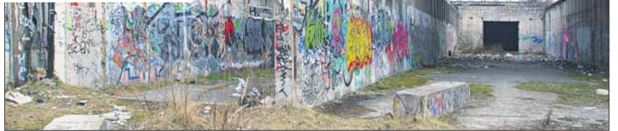
Pozostatky pokusu o riešenie dopravy z Petržalky spred vyše 20 rokov.

Po vlnajších komunálnych voľbách oslovili Ftáčnika z ministerstva dopravy, pretože Brusel zapochyboval o možnosti zmysluplnej realizácie spomínaného projektu. „Zaujímalo ich, či má Bratislava iný, zaujímalo ich, čo vie ponúknuť ako mesto,“ prezradil prítomným. Vypočítalo sa, že za ponúkané peniaze (časť z 550 miliónov eur pôjde na výstavbu diaľnic) by mohli v prvej etape (do roku 2013) postaviť