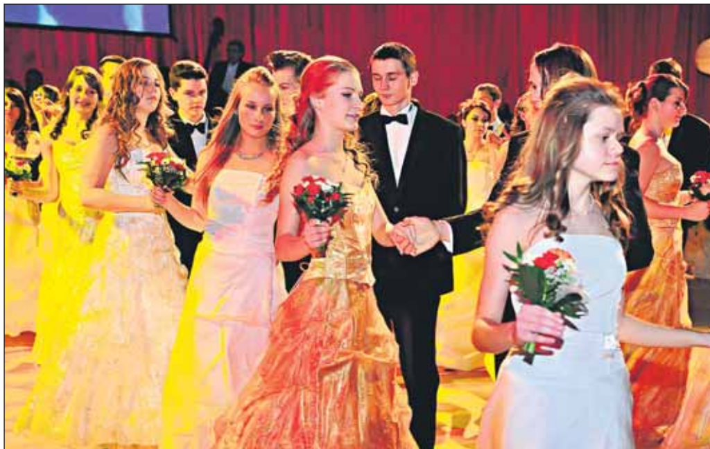
Vo víre hudby sa točia biele šaty mladých slečien počas Tanca novicov. Čarovný okamih pre publikum i mladých tanečníkov...