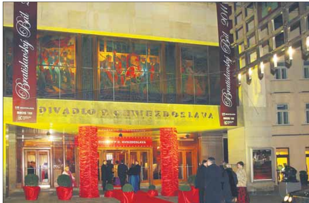
Mestské divadlo Pavla Országha Hviezdoslava hostilo bál po druhýkrát.