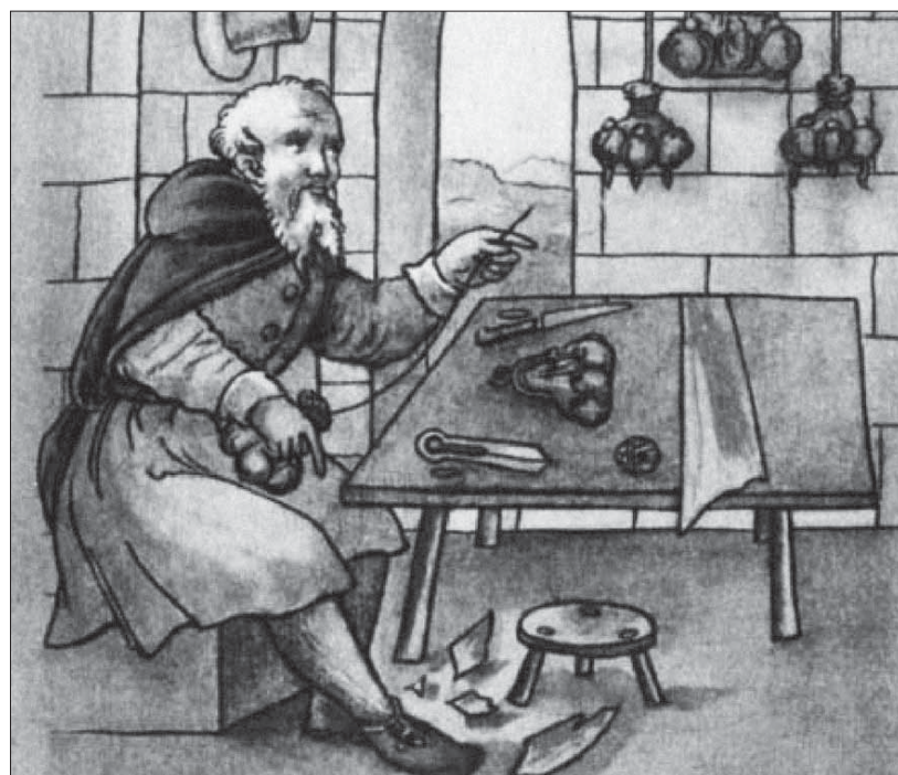
Stredoveký výrobca mieškov a tašiek.

Cech baretárov a ponožkárov na rozdiel od väčšiny ostatných cechov mal až dvoch cechmajstrov, a to staršieho a mladšieho. Na výročnej schôdzi starší odstupoval, mladší postúpil na jeho miesto a volil sa nový mladší cechmajster. Cechovú skrinku opatroval starší cechmajster, kľúče od nej mal však aj mladší. Keď na schôdzi cechu skrinku otvorili, nikto nesmel mať pri sebe dýku, nôž či inú zbraň ani sedieť s pokrytou hlavou, a to pod pokutou 2 šilingy fenigov. Ak pred skrinkou niektorý majster iného urazil, mal byť potrestaný pokutou 4 šilingy fenigov. Obdobné ustanovenia obsahujú mnohé šta-