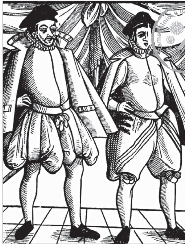
Baret bol obľúbenou pokrývkou hlavy remeselníkov, ako vidno na rytine zo 16. storočia znázorňujúcej majstra a tovariša.

Brašnári či taškári zhotovovali z kože brašny, tašky, kapsy, tanis-