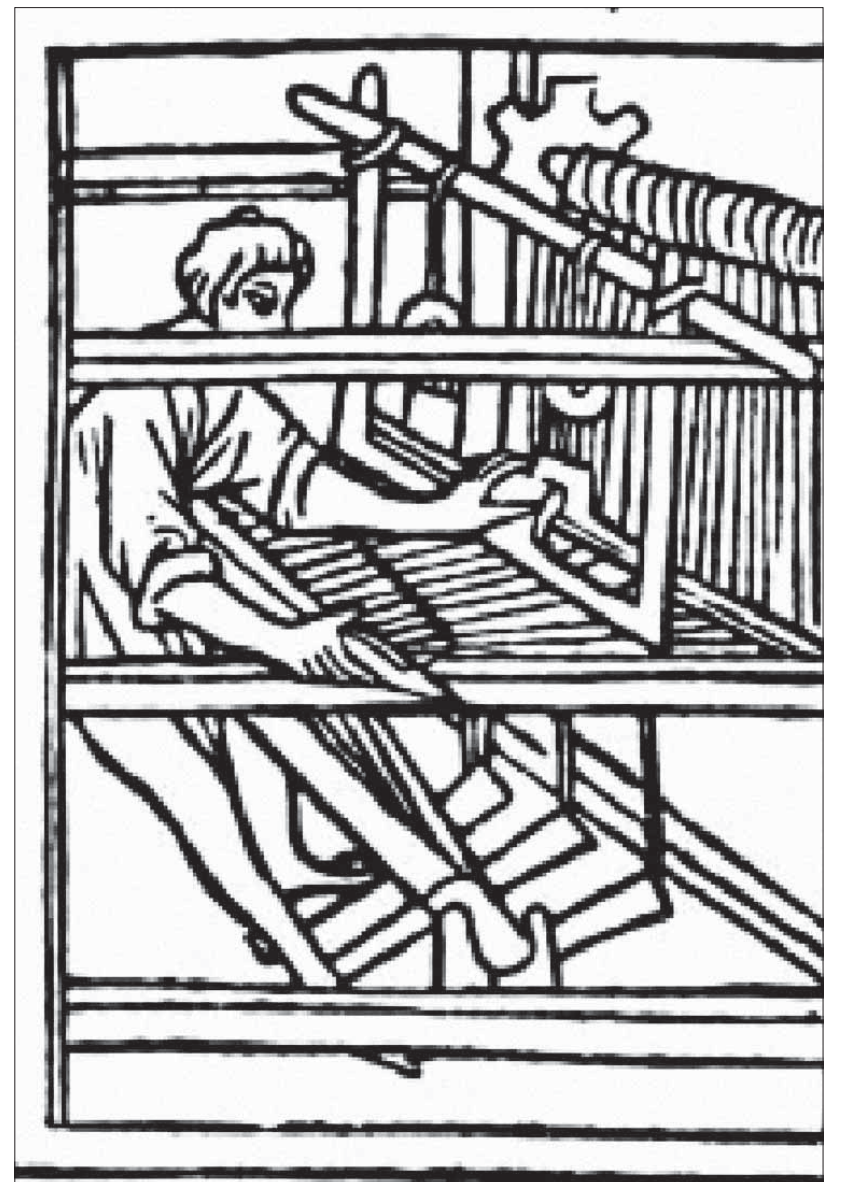
Výroba cajgov sa uskutočňovala klasickou tkáčskou technológiou.