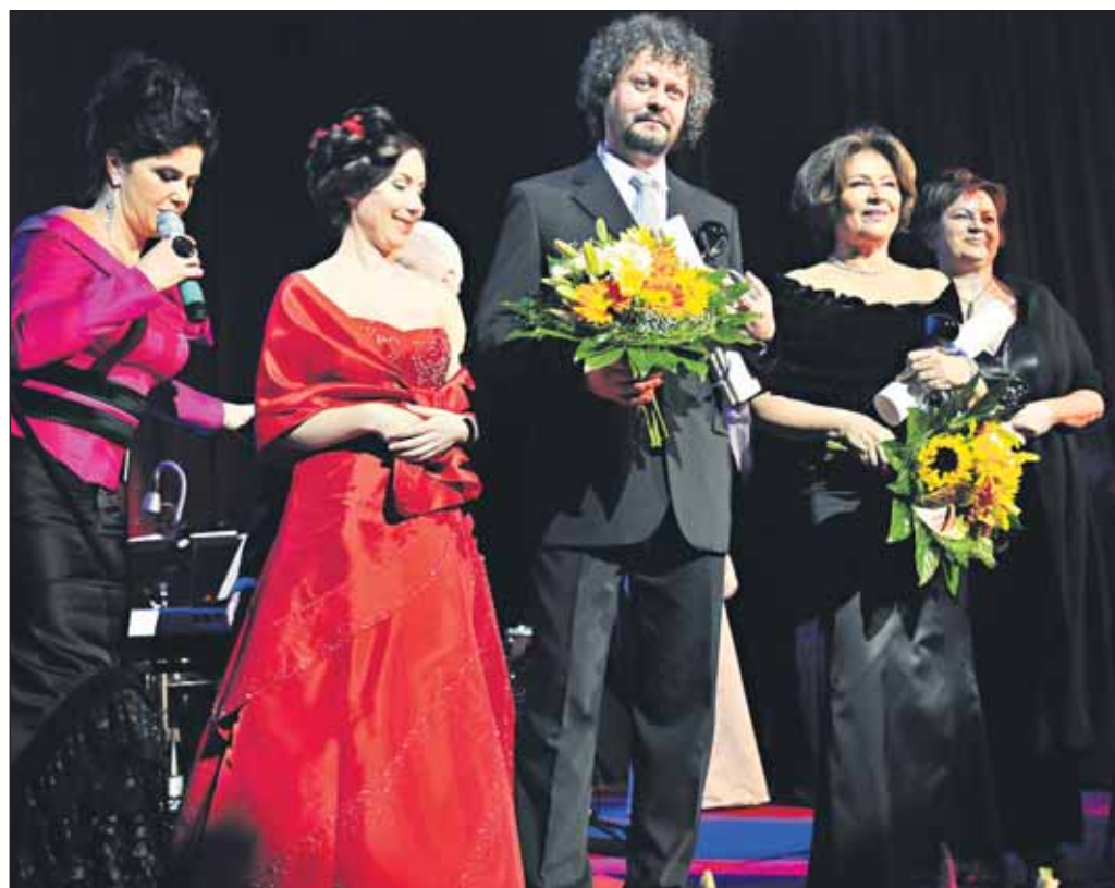
Toto sú osobnosti kultúrneho života, ktoré si Bratislava ctí a váži.