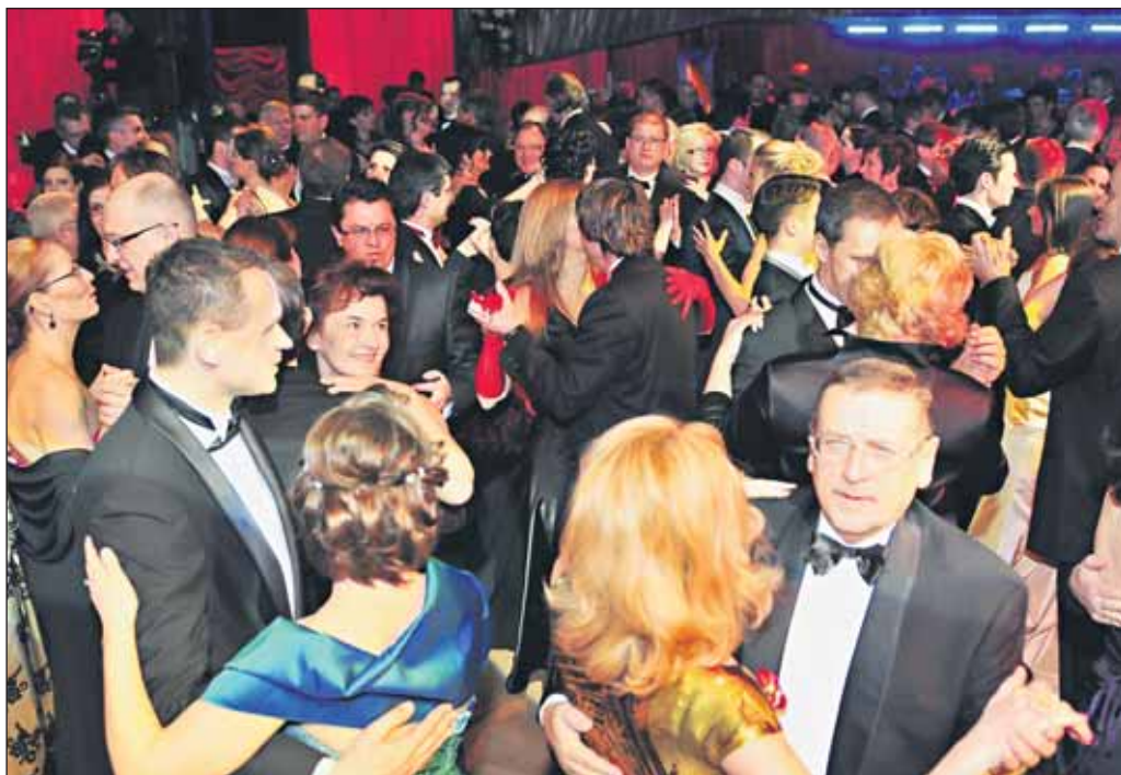
Plný a plesajúci parket. Prešporok môže byť na dnešnú Bratislavu hrdý.