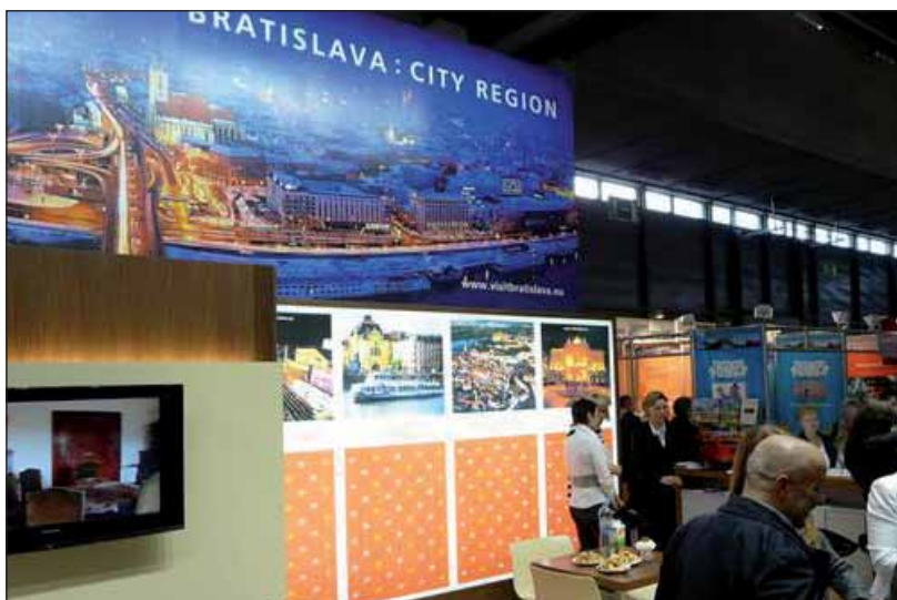
Bratislava na veľtrhu Ferien Messe vo Viedni.