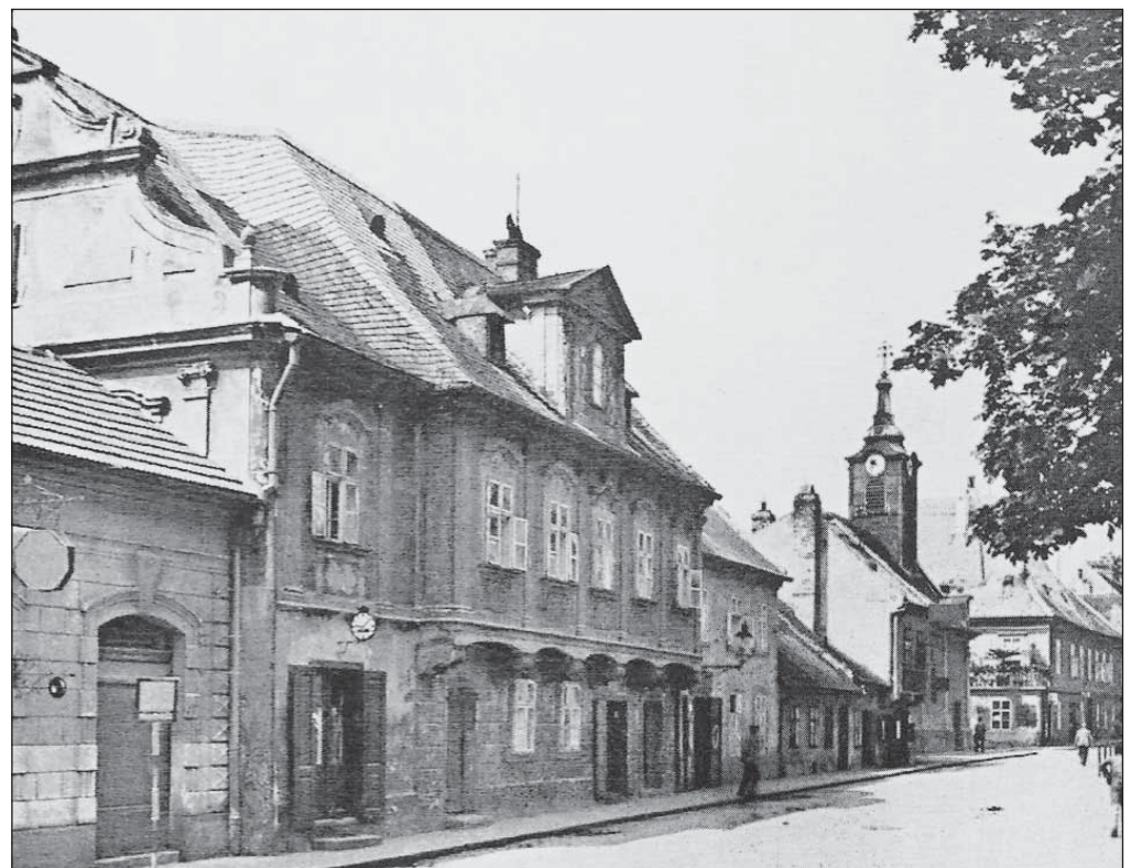
Dom cechu rybárov a lodníkov sa nachádza na dnešnej Žižkovej ulici č. 1.

bode sa stanovuje, že rybári môžu ryby aj kupovať; v treťom a štvrtom bode sa upravujú podmienky predaja rýb pre potrebu ľudí, ktorí ich do mesta dovážajú, v piatom bode sa určuje, že ryby z mesta možno vyvážať len so súhlasom mešťanostu; v šiestom bode sa požaduje, aby si každý člen cechu nadobudol mešťianske práva; v siedmom bode, že obchodníci majú ryby predávať na Rybnom námestí; ôsmy bod sa zaoberá rôznymi spormi medzi rybármi a predajcami rýb; deviaty bod určuje, že predajcovia nesmú držať živé ryby do zásoby; desiaty bod stanovuje, že ryby možno predávať iba celé a na váhu, nie po jednej alebo dokonca po kúskoch; v jedenástom bode sa píše, že tovariši nesmú sami od seba kupovať ryby; v dvanástom bode sa zakazuje mešťanom predávať ryby ľuďom prichádzajúcim do mesta; trinásty bod určuje, že právo prezeŕať ryby dovážané do mesta majú iba rybári, najmä ich cechmajster, a nie predajcovia ani mäsiari; štrnásty bod zaka-