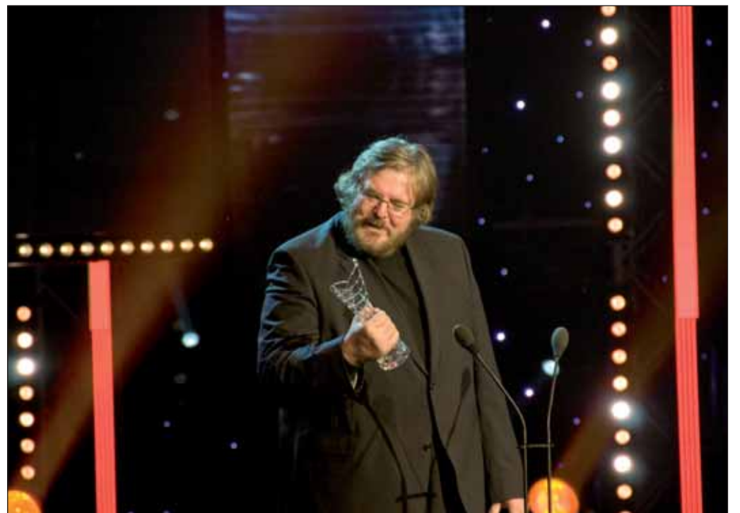
Tamtamov od Borisa Filana sa predalo viac ako 200 000 kusov.