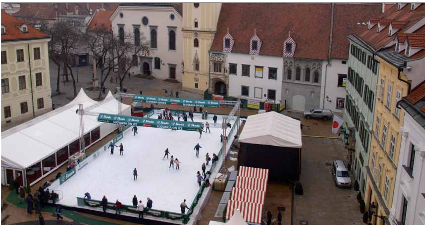
Ľad na klzsisku by mal odolať teplotám až do 15 stupňov nad nulou.