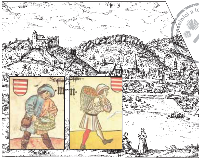
Jedna z najstarších redút Prešporoka zo 16. storočia vcelku výstižne zachytáva stredoveký stav mesta a jeho okolia.

V prvom bode sa určuje počet a druh rybárskych lodí, ktoré môže vlastniť každý majster; v druhom