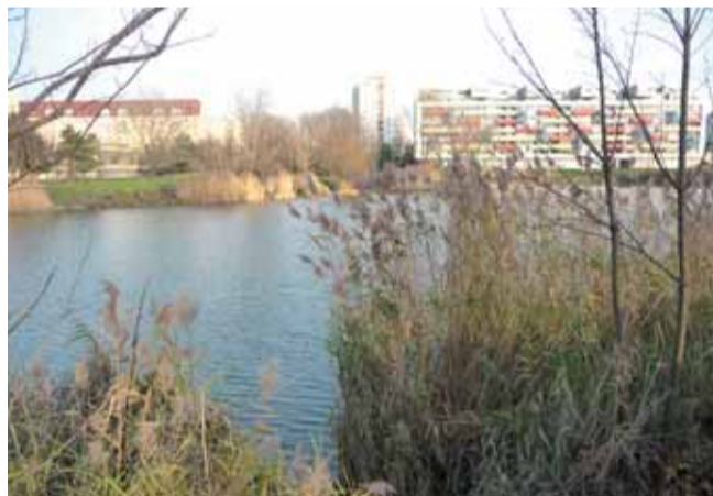
Okolie Rohlíka je na mnohých miestach zanedbané.

Neupravené a takmer neudržiavané okolie Rohlíka hnevá už mnohé roky najmä obyvatelov, ktorí bývajú v jeho bezprostrednej blízkosti. Mnohí hovoria že by stačilo málo na skultúrnenie prostredia a jeho udržiavanie. Samotní občania sa už v minulosti zapojili do dobrovoľných brigád a čistili okolie i hladinu jazera.