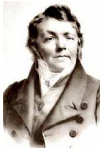
Johann Nepomuk Antonius von Padua Hummel

bezplatne. Pôsobil určitý čas ako nástupca J. Haydna v Eisenstadte, potom v Stuttgarte a vo Weimare. Hummel sa preslávil brilantnou hrou a improvizáciou. Okrem početných skladieb pre klavír (sonáty, variácie, rondá, fantázie a klavírne koncerty), písal aj komorné skladby, opery, kantáty a