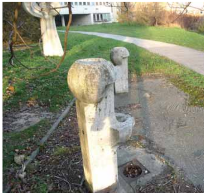
Kedysi funkčné pitné fontánky pri jazere Rohlík.