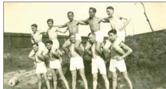
Volejbalisti RTJ Bratislava v roku 1934

V roku 1931 sa bratislavská YMCA zúčastnila aj na majstrovstvách ČSR v Pardubicích s jedným víťazstvom nad Zlínom a dvoma prehrami – so Strakovou akadémiou II a Sokolom Orlo-