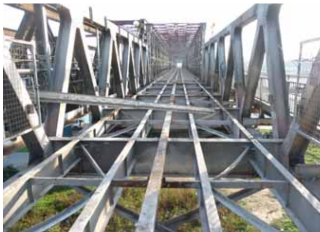
Súčasný stav Starého mosta.

Starý most zrekonštruuje Združenie MHD - STARÝ MOST, ktoré mesto vybralo vo verejnom obstarávaní a je zložené z firiem Eurovia SK, Eurovia CS a SMP CZ. V roku 2008 mali obyvatelia hlavného mesta možnosť elektronicky hlasovať za jeden z predložených návrhov novej podoby Starého mosta. Víťazný návrh mal tvar perforovaného rebra. Neskôr sa objavili aj ďalšie mož-