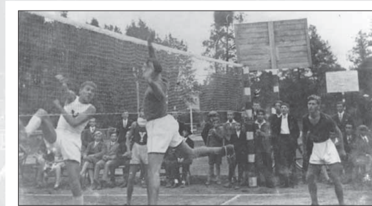
Víťazom prvých majstrovstiev Slovenska v Banskej Bystrici v septembri 1928 sa stala YMCA Bratislava (s písmenom Y na tričku).

Terminológia používaná pri opise pravidiel hry dnes vyvoláva úsmev, v začiatkoch volejbalu malo však oboznamovanie verejnosti so základnými pravidlami čo najprí-