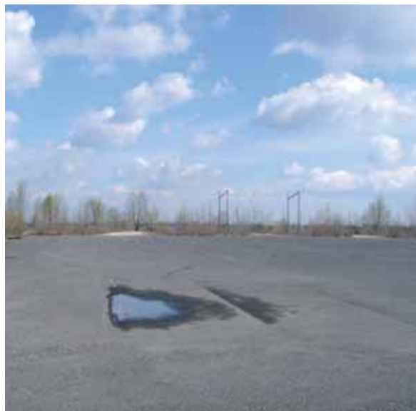
Aktuálna podoba v mieste plánovanej výstavby.