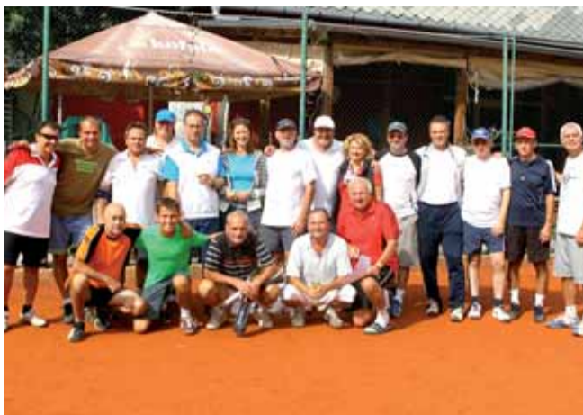
Účastníci turnaja GA-GA OPEN 2013.