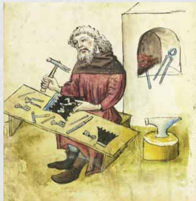
Stredoveký zámočník v norimberskom kódexe