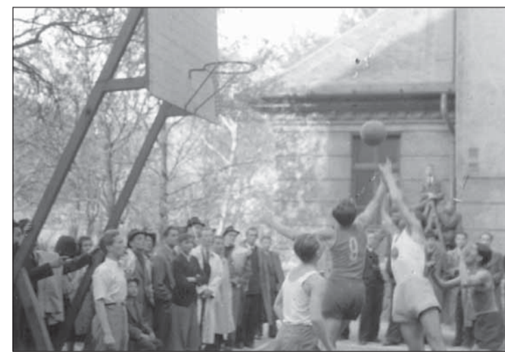
Basketbalový zápas na dvore reálneho gymnázia v druhej polovici 30. rokov 20. storočia.

Rivalita a hrdosť na svoje farby neznamenal automaticky nepriateľstvo medzi členmi jednotlivých skupín, veď všetky patrili pod krídla YMCA. Inak by sa ani neuskutočnil zájazd kombinovaného tímu Hviezdy a Winnetou do Brna na zápasy proti VS a Sokolu s bilanciou víťazstva a dvoch prehíer. Koncom roka 1938 dosiahli hráči Hviezdy v moravskej metropole skvelý úspech, keď vo všetkých troch zápasoch zvíťazili.