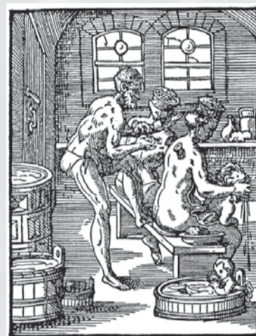
Kúpeľník pri práci na rytine Josta Ammana z roku 1568.

Od 16. storočia sa strach obyvateľov pred rozšírením syfilisu a moru – chorôb spätých so zámorskými plavbami – prejavil negatívne na návštevnosti mestských verejných kúpeľov. Od prelomu 16. a 17. storočia nastal v celej Európe značný úpadok verejných kúpeľov. Prešporok nebol v tomto smere výnimkou.