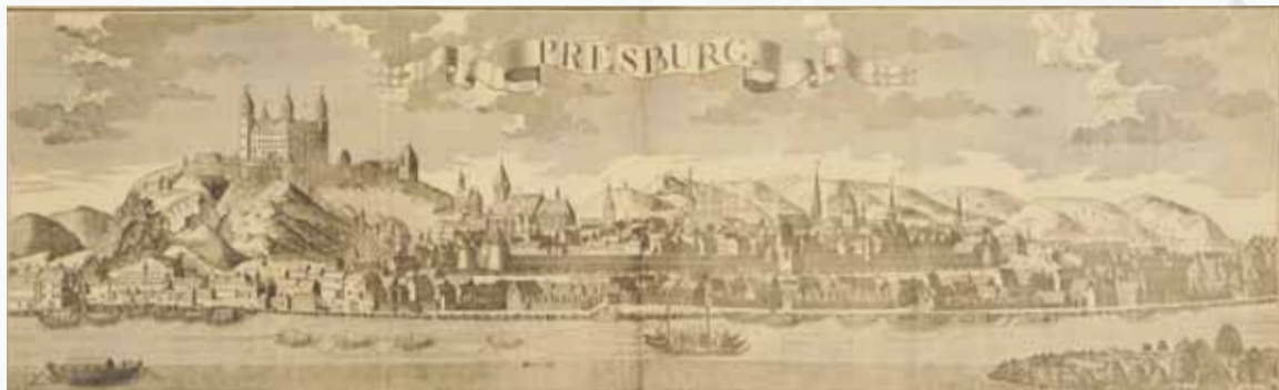
Veduta Prešporka z druhej polovice 18. storočia ešte s mestskými hradbami, ktoré boli na príkaz Márie Terézie definitívne zbúrané roku 1778.