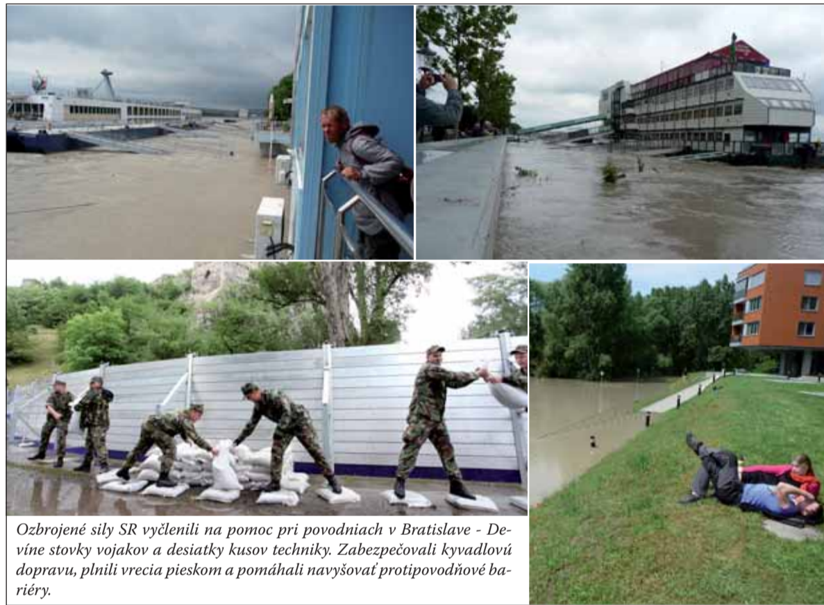
Ozbrojené sily SR vyčlenili na pomoc pri povodniach v Bratislave - Devíne stovky vojakov a desiatky kusov techniky. Zabezpečovali kyvadlovú dopravu, plnili vrecia pieskom a pomáhali navyšovať protipovodňové bariéry.