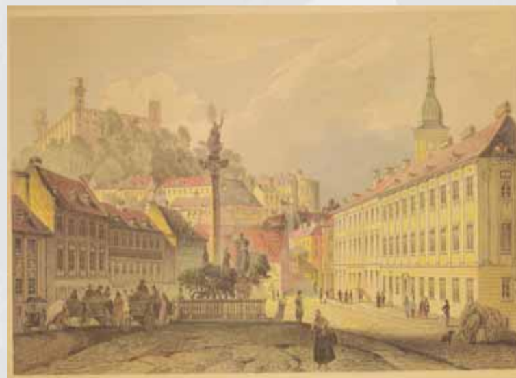
Rybné námestie s morovým stĺpom pripomínajúcim veľkú morovú epidémiu v Prešporku v rokoch 1713 a 1714. Ocelorytina Ludwiga Rohbocka.