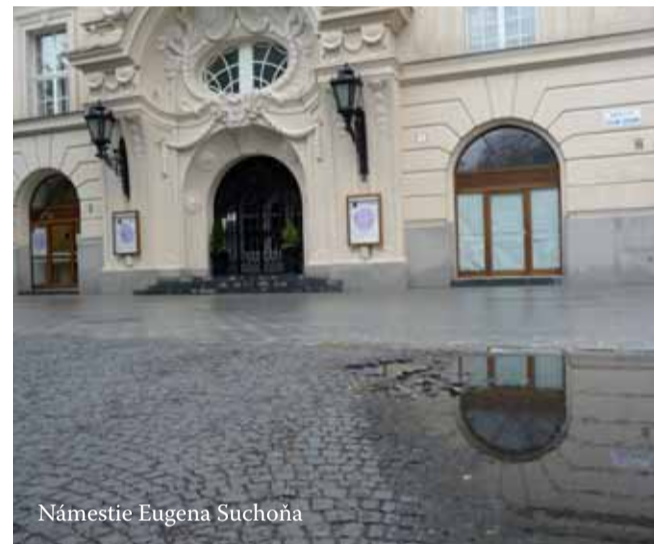
Námestie Eugena Suchoňa