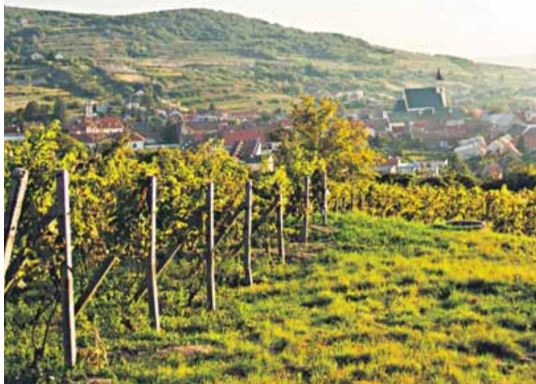
Aj tieto vinice sa stanú predmetom bytovej výstavby?

trás. Ďalším úderom pre vzácny biotop je práve uskutočňovaná, pomerne rozsiahla výstavba rodinných domov v kontaktnej zóne s rezerváciou.