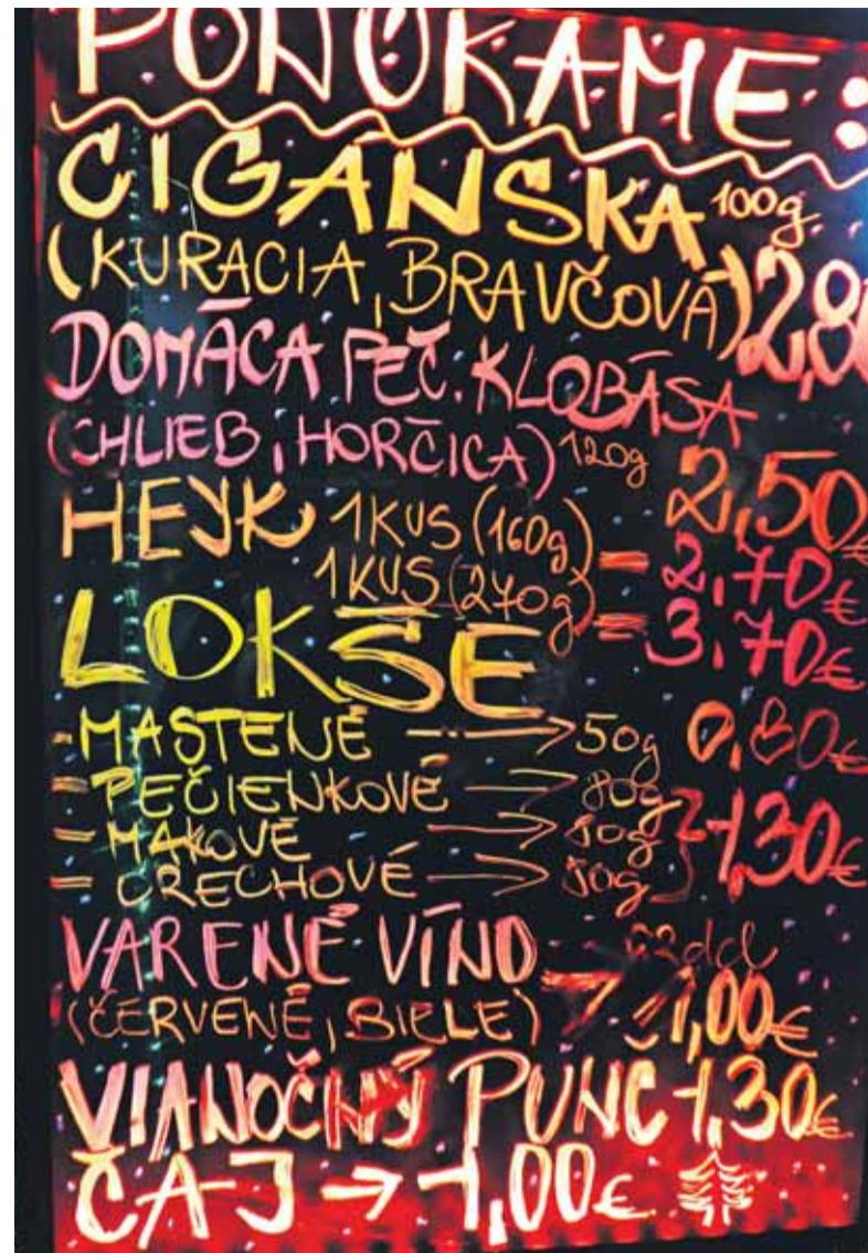
Priveľký rozdiel v cenách medzi jednotlivými predajcami nenájdete.