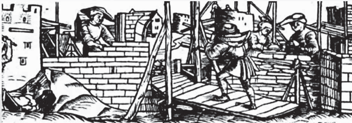
Stredovekí murári na Schöfferevej rytine z roku 1526.

Murárske remeslo bolo v stredoveku príbuzné tak s kamenárstvom, ako aj s tesárstvom, lebo vo vtedajšom Prešporku sa takmer všetky domy, najmä na predmestiach, stavali nielen z kameňa, ale aj z dreva. Preto sa tieto remeslá často spomínajú v spoločných záznamoch. Murári neraz vykonávali aj kamenárske práce, o čom svedčí zápis v komornej knihe z fiškálneho roka 1439/1440, kde sa uvádza, že murárom zaplatili za opravu brány na mestskom opevnení a za zhotovenie kamenných gúl, ktoré sa používali ako strelivo z diel, dovedna 96 libier, 1 zlatý a 3 viedenskú denáre, čo bola mimoriadne vysoká suma. Prešporskí murári vlastný cech v stredoveku nemali, no pravdepodobne už vtedy