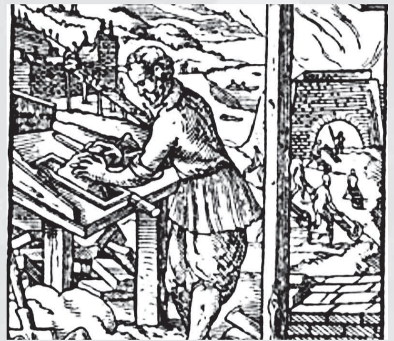
Výrobca tehál na rytine Josta Ammana z roku 1568.