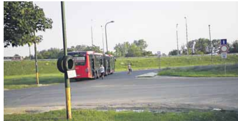
Na Vyšehradskej cestujúci vystupujú rovno do cesty.

„Čakajú tu cestujúci na spoje do niekoľkých smerov (k Technopolu, na Ovsíšte a tiež na AS Mlynské Nivy),“ píše nám čitateľka. V blízkosti zastávky je okrem často využívaných reštaurácie a hotela aj pošta či pobočka bánk. „Pred pár rokmi nás z DPB odkázali na magistrát, ten sa zas z toho vyzul tým, že ukončil zmluvu so spoločnosťou JC Decaux. Nikoho neza-