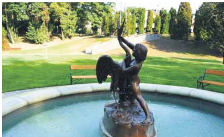
Obnovená záhrada Vodárenského múzea BVS a.s.

pre bicykle, lavičkami a prístreškom. Hlavná časť záhrady je venovaná deťom, vzniknúť mala lúka určená na športové aktivity a aj detské ihrisko s hracími prvkami s tematikou vody. V záhrade má byť aj interaktívny potok aj fontány v modernom aj historickom duchu. Ako uviedol architekt