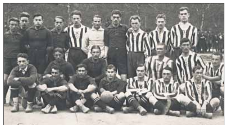
Pozornosť fanúšikov medzivojnovaj Bratislavy priťahovali derby zápasy medzi Slováckmi a Maďarmi, čiže klubov I. ČsŠK a PTE, tu na spoločnej fotografii.

Tento klub, založený v roku 1907, bol prakticky až do polovice 30. rokov jediným nemeckým klubom pôsobiacim vo futbalových štruktúrach riadených MLSz. Donaustadt, spoločne s menšími klubmi bratislavských Nemcov, ako napríklad ŠK Blumental, Admira, Rapid, Zwirnfabrik alebo Kabelfabrik, vyjadril koncom roka 1927 a začiatkom toho nasledujúceho svoju nespokojnosť s postavením v MLSz až do takej miery, že ich zástupcovia vyjednávali s vedením Nemeckého futbalového zväzu v ČSR o utvorení Nemeckej futbalovej župy v Bratislave, k čomu však napokon nedošlo. I. ČsŠK Bratislava získal v roku 1928 horko-ťažko župné prvenstvo po trápení s trnavským Rapidom, no zuby si vylamal na žilinských eškároch, ktorí triumfovali v Petržalke i pod Dubňom. Žilincania nastúpili potom v Petržalke na ihris-