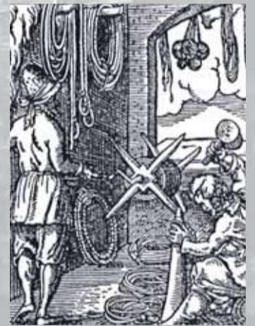
Pohľad na prácu majstra, majstrovej, tovariša a učňa v povrazníckej dielni.