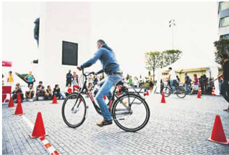
Pred Euroveou sa súťažilo aj o elektrobicykle a elektroskútre.

Týždeň mobility začal už v sobotu 15. septembra nočným behom River Park Night Run. Hneď na druhý deň sa námestí pred Euroveou uskutočnilo podujatie „Elektrina, ktorá s vami pohne“, kde si mohli návštevníci vyskúšať všetky formy alternatívnej dopravy - od elektrickej kolobežky až po najnovšie modely áut poháňaných elektrinou. Nechýbal ani kávovar, či mixér na šliapacím pohonom, či stolný elektrický futbal. Vo štvrtok 20. septembra sa konala v priestoroch Starej tržnice akcia nazvaná „Bezpečne na cestách“. Bola určená pre žiakov materských a základných škôl.