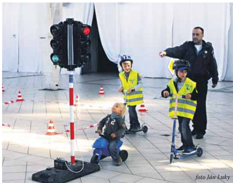
Projekt „Bezpečne na cestách“ zorganizovali pre deti v Starej tržnici.