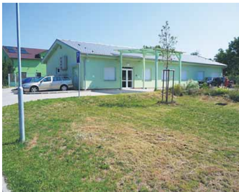
Tu mala byť pravdepodobne zriadená nová mestská záchytky.

Zároveň ale dodáva, že personál musí pacientovi poskytnúť urgentnú zdravotnú starostlivosť. „Každému sa preto robí minimálne CT vyšetrenie. Keď sa ukáže, že nemá žiadne zranenie, ostáva v nemocnici, kým nie je v stave odísť sám. Títo ľudia majú často veľmi nízky hygienický štandard (bezdomovci, asociáli), sú agresívni