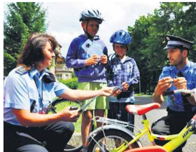
V českých Litoměřicích odmenila polícia v rámci kampane darčekom každé dieťa, ktoré jazdilo s prilbou.

Nedávny prieskum istej komerčnej poisťovne zistoval, ako to vyzerá s bezpečnosťou cyklistov v Bratislave. Výsledky boli viac ako znepokojivé. U korčuliarov vyšiel prieskum najhoršie. Z dospelých si hlavu nechránilo 97 percent zúčastnených, z detí 57 percent. Do prieskumu sa zapojilo viac ako 1000 cyklistov a korčuliarov prechádzajúcich po cykloceste. Pozorovanie sa uskutočnilo práve v deň, keď si cyklisti merali svoje sily na olympijských hrách.