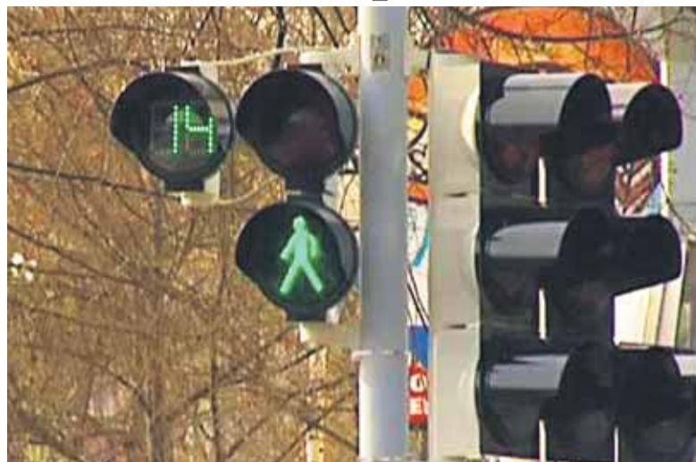
Semafor s časovou signalizáciou.