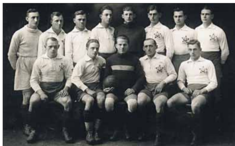
I. ČsŠK Bratislava, amatérsky majster Československa v roku 1927.

V hektickom roku 1927 zaujali aj ďalšie, niekedy až divoké výsledky čerstvého amatérskeho majstra ČSR. A to či už prehra s pražskou Sláviou 3:4, keď si ju pozvali ako hosťa pred zápasom s Prostějovom, či premiérové vystúpenie v Budapešti s prehrou 0:5 proti výberu hráčov Hungarie, Ferencvárosu a Ujpesti, ale aj úspešná domáca odvetá proti kombinovanému tímu Hungarie a Ujpesti 6:2.