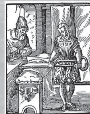
Postríhač súkna na rytine Josta Ammana z roku 1568.